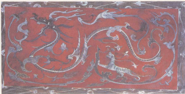
永城汉墓中的龙形壁画

神龙是中国人智慧、勇敢、吉祥、尊贵的象征。河南是龙的故里。被称为人文始祖的太昊伏羲，在今周口淮阳一带“以龙师而龙名”，首创龙图腾，实现了上古时期多个部族的第一次大融合；被称为又一人文始祖的黄帝，在统一黄河流域各部落之后，为凝聚各部族的思想和精神，在今新郑一带也用龙作为新部落的图腾，我