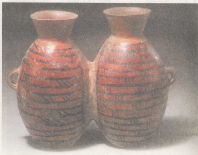
郑州大河村出土的彩陶双连壶

中原文化博大精深，源远流长。从表层看，她是一种地域文化，从深层看，她又不是一般的地域文化，而是中华民族传统文化的根源和主干，在中华文化发展史上占有突出地位。根据中原文化内容的特色，大体可以分为以下十八个方面。