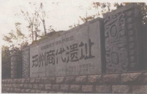
古都郑州商代遗址

历史上的中原大地长期是政治角逐、政权更迭、政体演变“你方唱罢我登场”的大舞台，发生了难以数计的重大政治事件和政治活动，积累了大量的政治