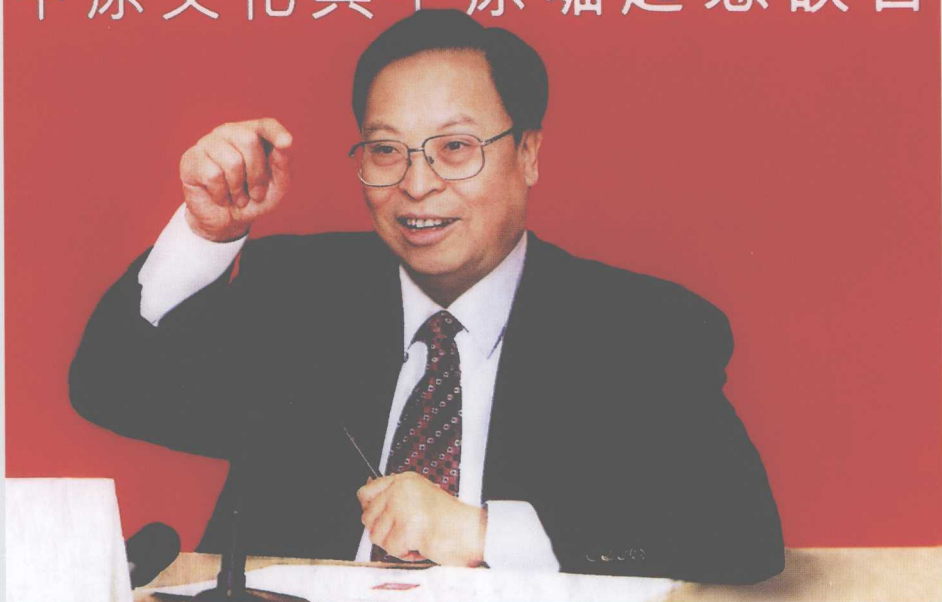
中共河南省委书记、省人大常委会主任徐光春在中原文化与中原崛起 恳谈会上作主题演讲。（2007年1月19日，香港）