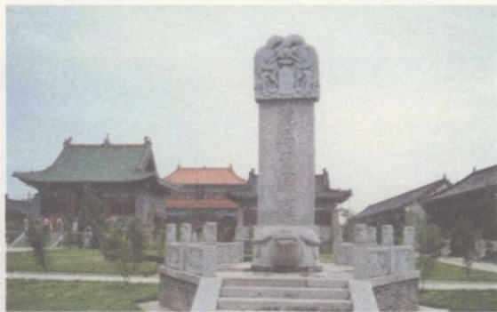
龙马负图寺，位于河南孟津，因龙马“负图出于孟河之中”而建，是河洛文化中“河图”的发现地。

近年来，在河南乃至全国学术界掀起了研究中原文化与河洛文化的热潮，两种文化之间究竟有什么关系？是否是一种文化的两种不同表达方式？或者是两种完全不同的文化？见仁见智，莫衷一是。因此，在介绍中原文化之前，不能不说说河洛文化，尤其是河洛文化与中原文化的关系。一般来说，河洛文化是以洛阳为中心的古代黄河与洛水交汇地