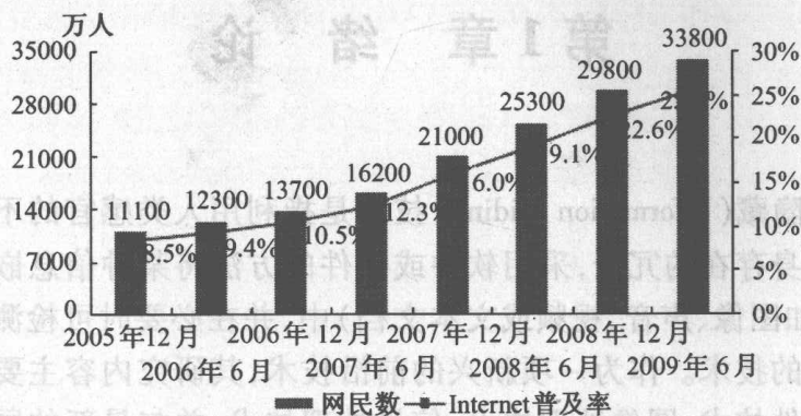
图 1-1 中国网民人数增长情况 ①

2.98 亿高居首位。我国网民的增长速度惊人。1998 年底为 210 万人,而截至 2008 年 6 月底,我国网民数量达到了 2.53 亿人,增长了 120 倍。并首次大幅度超过美国,跃居世界第 1 位,如图 1-1 所示。