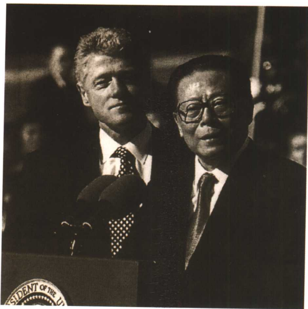
1997年10月， 中国国家主席江泽民 应邀访美。