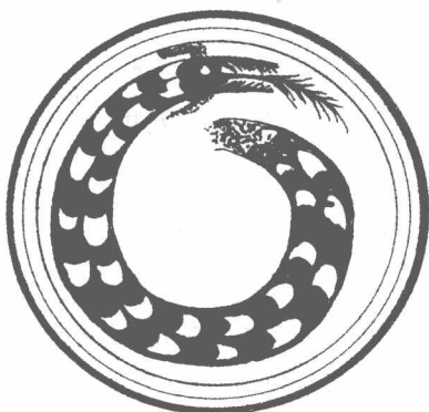
图2-1 山西襄汾县出土的彩绘大陶盘

1978年,我国考古工作者在山西省襄汾县陶寺发掘出一座大规模的龙山文化遗址,出土了一个彩绘大陶盘。陶盘平底,内壁磨光,盘的内壁上用红白两色绘出蟠龙图形(图2-1)。蟠龙的头在外圈,尾蜷盘中。龙体为蛇躯鳞身,巨口利齿,口吐长信,似蛇非蛇,似鳄非鳄,显然已是想象合成的虚拟生物,这是早期龙形的一个重大发现。把这彩绘陶龙同商代玉器上的龙纹作一比较,其间差异不少,确比商代龙纹简朴粗率,显示出较早的特征。据考古界考证推定,年代当不晚于4500年前。可以称之为“中华第一龙”。