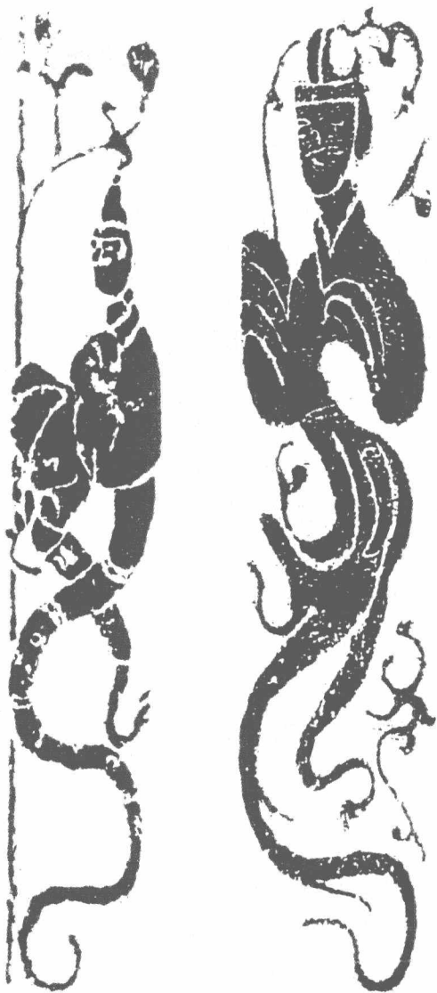
图1-1 “人头蛇身”的伏羲与女娲(画像砖·汉)