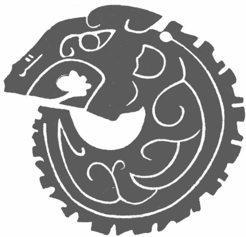
图1-2 酷似蚕形的龙(玉雕龙·商中期)

骆宾基先生的这个论点在美国的中文报刊《中报》发表后,引起了海峡两岸华夏后裔的极大兴趣,本人对他的这个观点也觉得有可取之处,因为商代的玉雕龙更像一条首尾相接的蚕,骆宾基的这个论点为龙的起源和演变增添了新的论说(图1-2)。