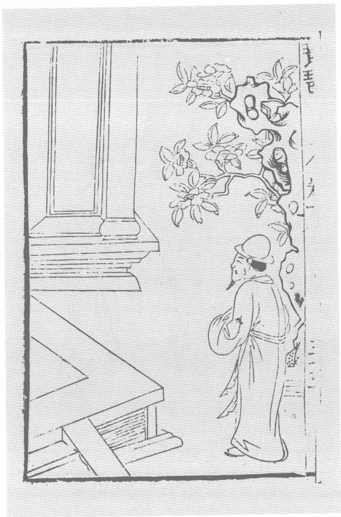
尊生馆刻本《琵琶记》之二两贤相遣(一)