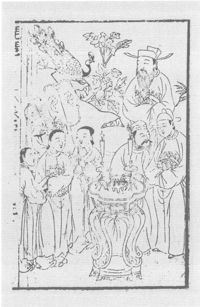
明黄氏尊生馆刻本《琵琶记》之一强就鸾凰(二)