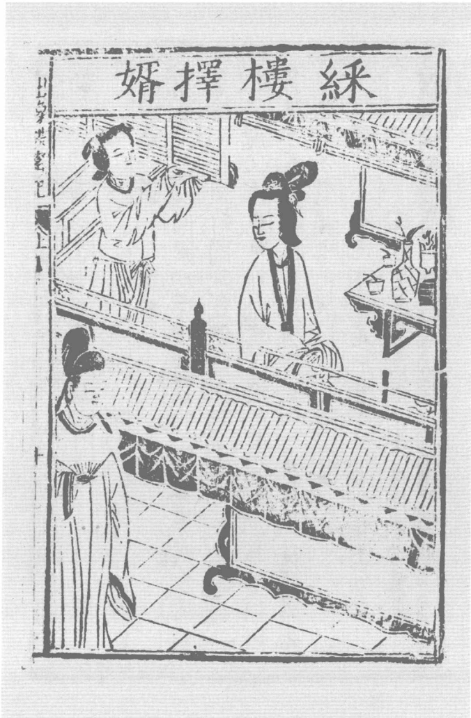
明金陵唐氏富春堂刻本《吕蒙正风雪破窑记》