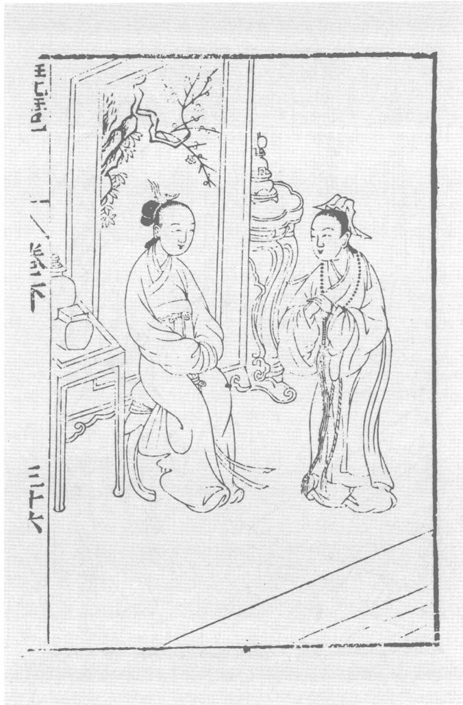
尊生馆刻本《琵琶记》之二两贤相违(二)