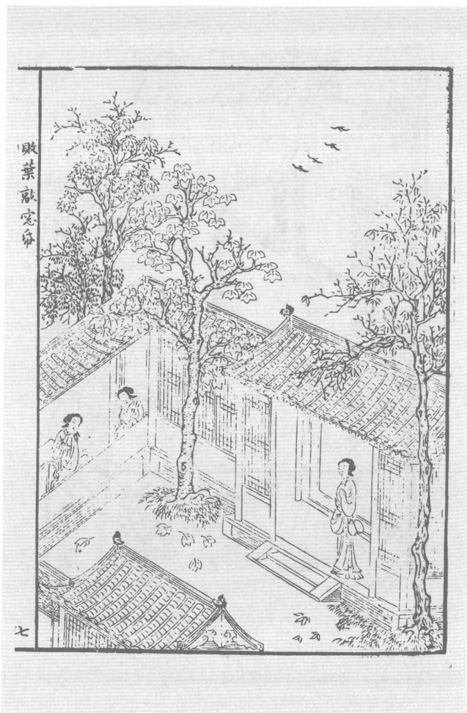
明刻朱墨本《幽闺怨佳人拜月亭》