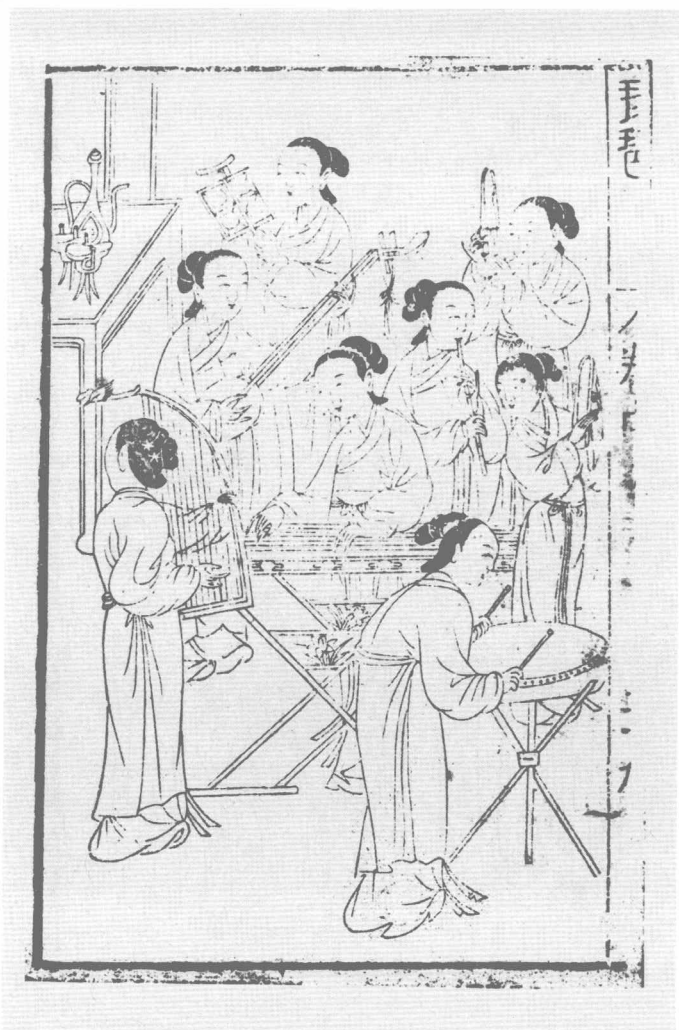
明黄氏尊生馆刻本《琵琶记》之一强就鸾凰(一)