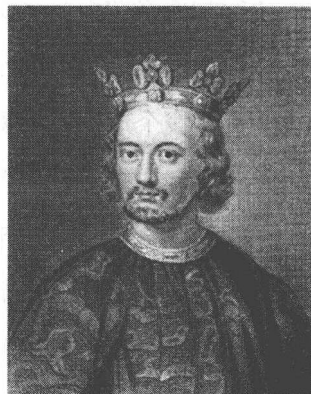
约翰王（1167 - 1216）

金雀花王朝的约翰，他的父亲是文韬武略的英格兰国王亨利二世，母亲是中世纪的传奇女性之一阿基坦的埃莉诺，他的兄长则是十字军伟大的英雄、“狮心”理查德一世。1199年理查德在一场围城战中为弩箭所伤，不久辞世，约翰即位。这位从小娇生惯养的衙内不得不接过父兄留下的基业，担起金雀花王朝，而他面对的最大敌人则是一生以颠覆金雀花王朝为己任的法国国王腓力·奥古斯都。