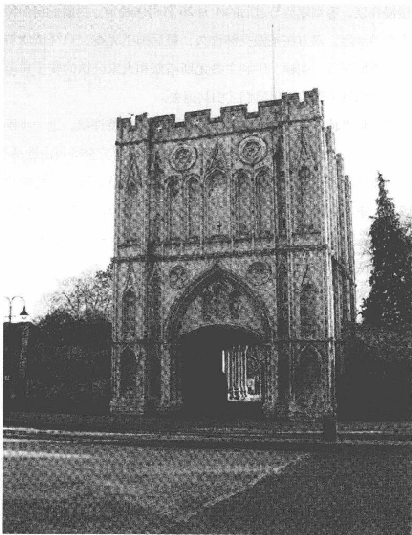
圣埃德蒙修道院（男爵们在此集议对付约翰王）