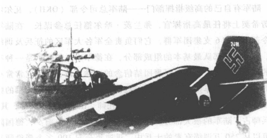
战斗中的德国容克 Ju87 型俯冲式轰炸机。

《凡尔赛条约》规定德国陆军士兵总数不得超过 10 万人，这项规定对德国来说，既有有利的一面，也有不利的一面。规模上的限制确保了只有优秀人才才能入伍，而前魏玛政府留下来的军官能为希特勒训练出大量军队。但是从 1934 年开始，陆军迅速、大规模的扩充也带来了一些问题，尤其是大批机械化部队的装备供应不足，摩托化部队车辆短缺，大部分陆军仍然依靠马匹作为主要运输工具。