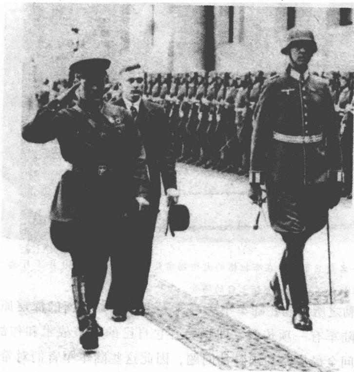
《苏德互不侵犯条约》签订后的情形：一名苏联军官正在向一队德国礼仪兵还礼。

以陆军为主力的德国军队是希特勒外交政策的坚实基础。陆军是德国最强大的部队，希特勒对其放心不下，他想尽办法来最大限度地限制陆军的潜在独立行动能力。自1933年上台以来，希特勒一直致力于削弱陆军部队的政治影响。1938年希特勒以莫须有的性丑闻指控解除了原国防部长瓦尔纳·冯·勃洛姆堡的职务并解散了国防部，取而代之的是国防军统帅部，简称“OKW”，他本人则亲自出任最高司令官。国防军统帅部负责整个武装部队，但在遇到情况时，陆、海、空三军的头目虽然可以直接向希特勒汇报，却不在一起工作、制定政策，因此国防军统帅部只不过是希特勒控制德国武装部队而特别设立的一个机构。