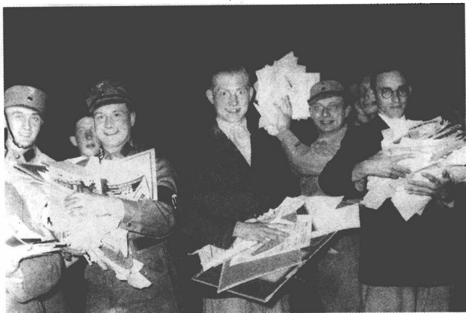
1933年，纳粹分子在柏林参加焚烧“叛乱”材料的集会。

在希特勒的心中，最主要的问题是苏联的态度。他很清楚，德国在东欧的扩张已引起了斯大林的注意，德国对波兰的入侵势必会引起苏联的干预。因此希特勒先把他对苏联的病态仇恨放在一边，而命令