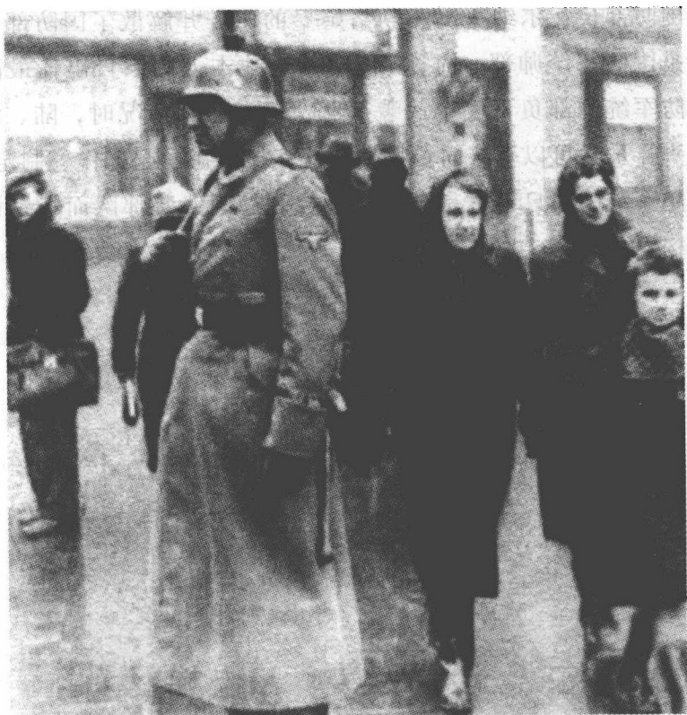
一名党卫军士兵在布拉格的大街拐角处站岗，这是1939年3月德军接管了捷克剩余领土后的场景。

1938年，所有有个人独立见解的军官不是被解职就是被调往其他岗位，而很多没有主见但听话的指挥官则被委以要职。这些人当中就包括威廉·凯特尔将军和阿尔弗雷德·约德尔将军，前者被提拔为国防军统帅部参谋长，后者负责作战计划部。这两个人都让希特勒的野心冲昏了头脑，并对他的所有命令言听计从，从不计后果。