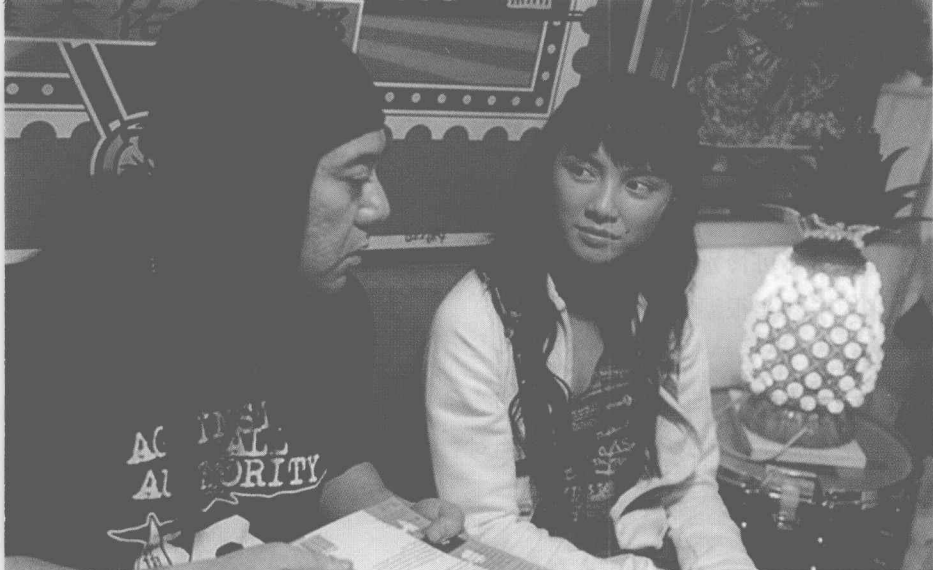
青春派李心洁诱惑黄秋生， 明星梦，追寻

时代给我们的玩笑不只方向这一点，爱情的标志也在改变。如果人的寿命能超过50年，谁肯用10年守着一个人一成不变？