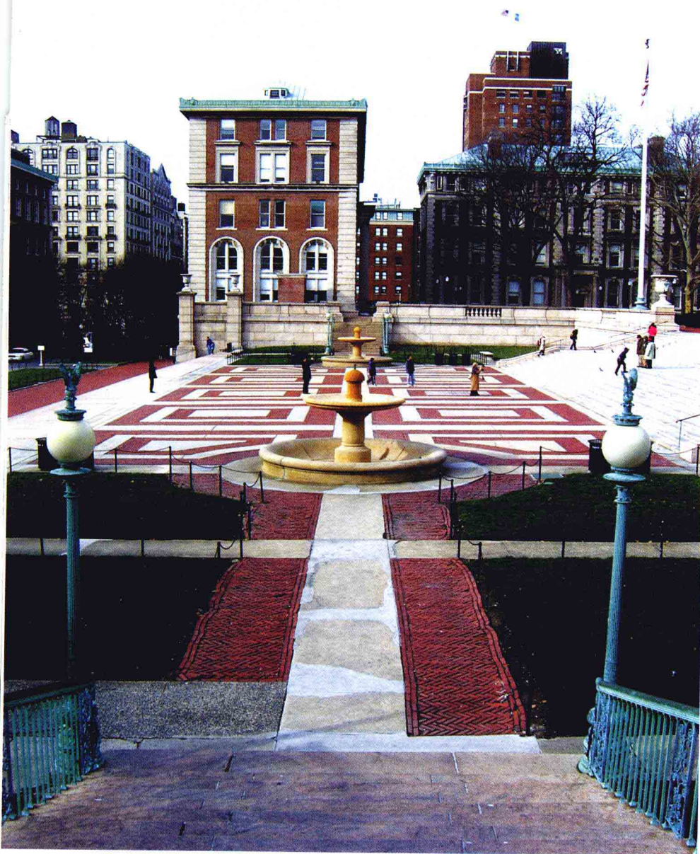
纵深感很强的哥大校园广场。