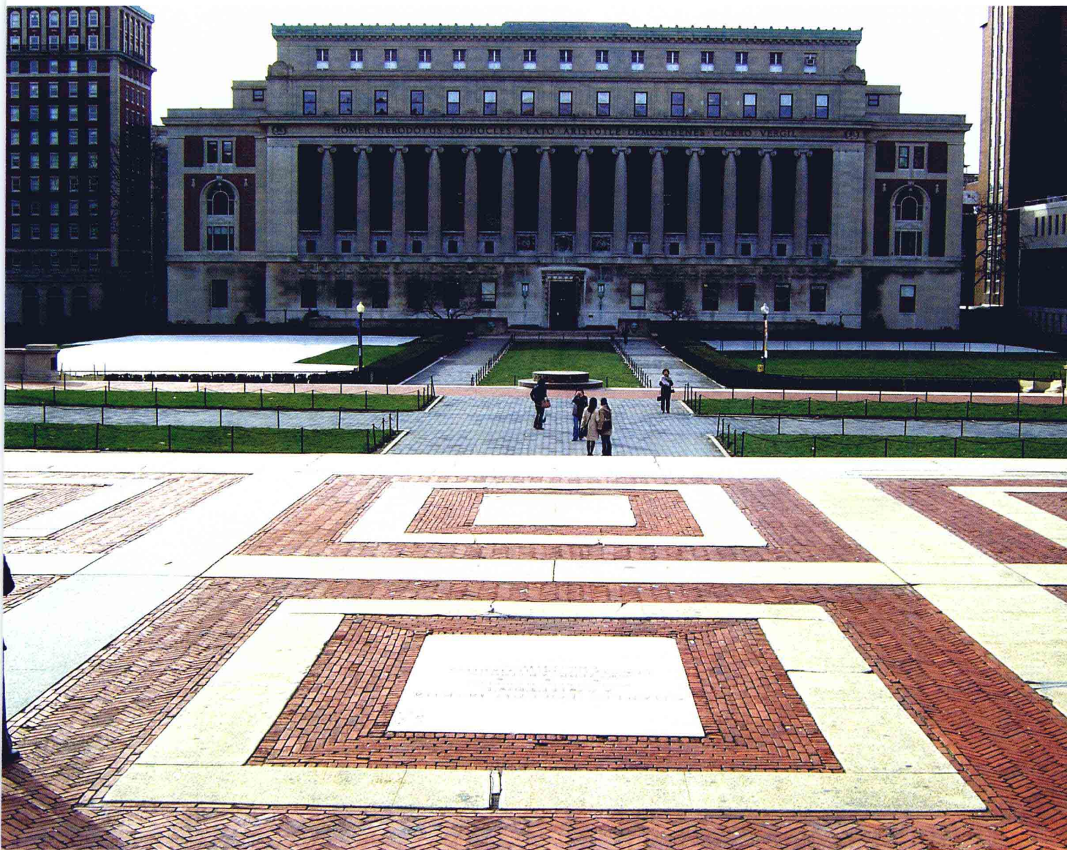
哥大广阔的校园中心广场。