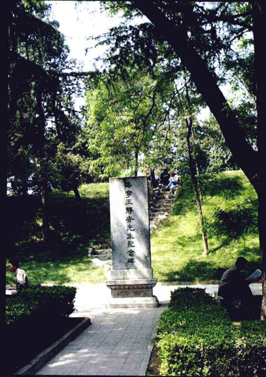
二校门。 甬道上的石碑。 东门入口景观。