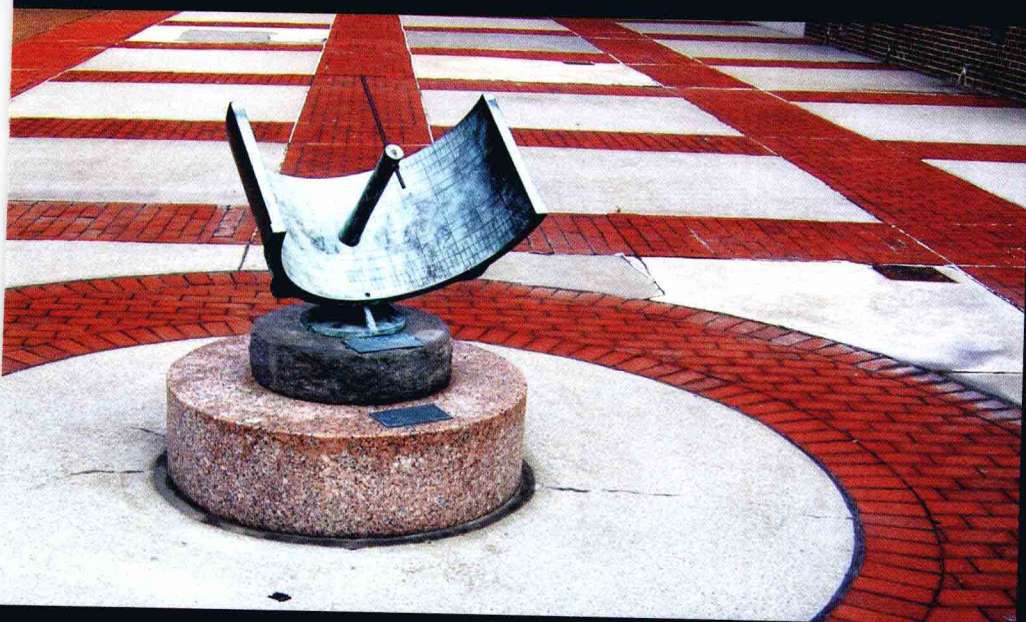
哥大物理系楼前的"图腾"。