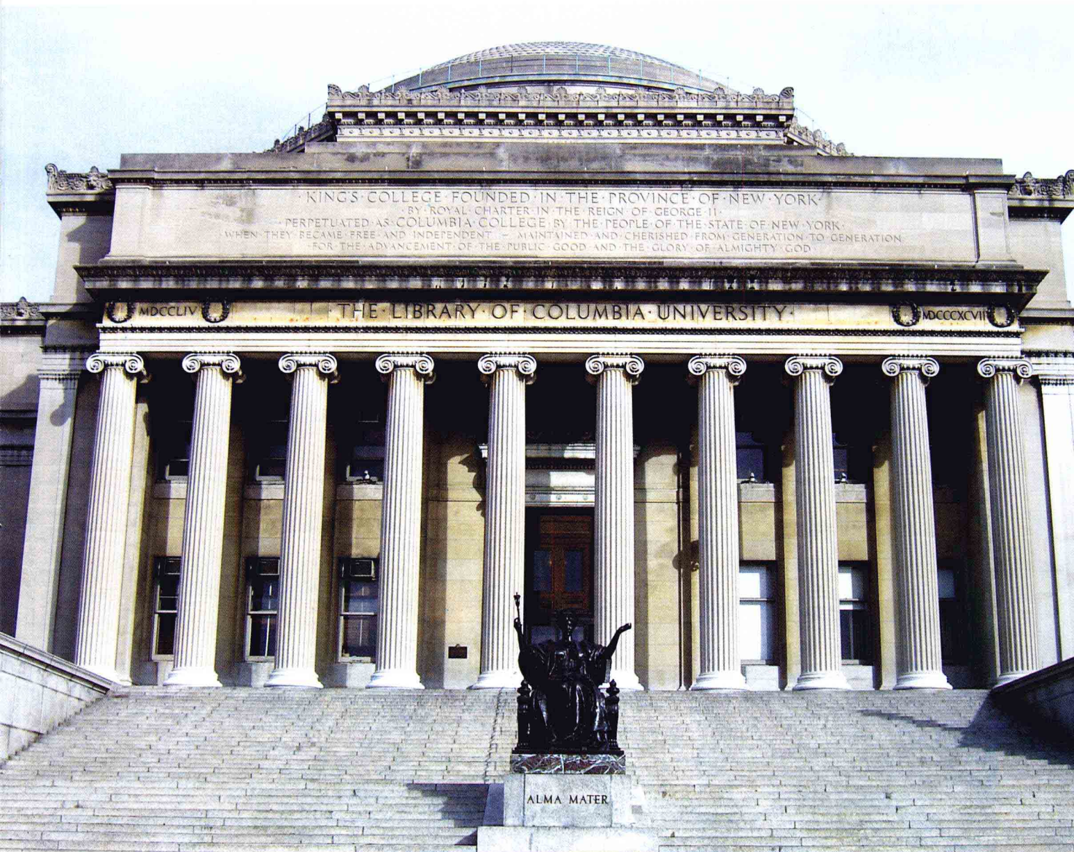
哥伦比亚大学的图书馆，哥达的标志性建筑。