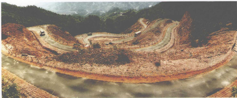
盘山公路