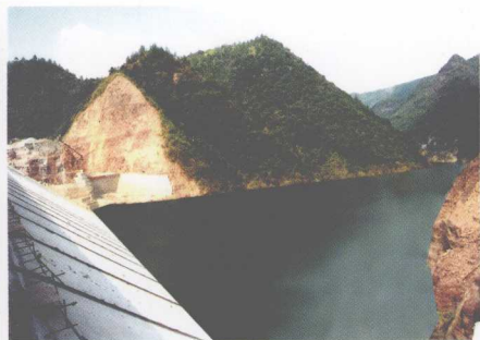
下六甲水电站