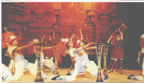
艺术团表演瑶族歌舞