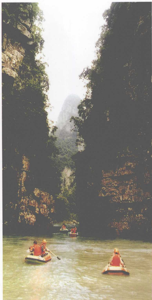
峡谷漂流