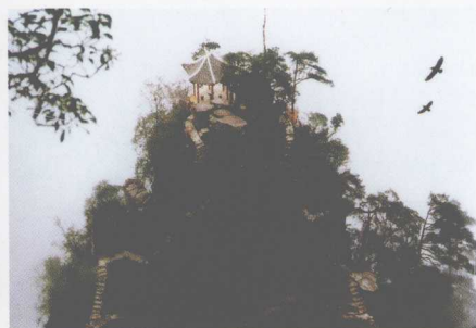
莲花山景区——仙山琼阁