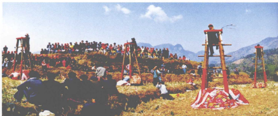
山子瑶度戒——翻云台