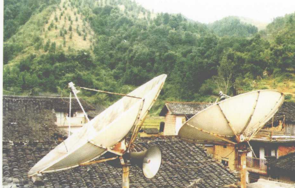
村村通了广播电视