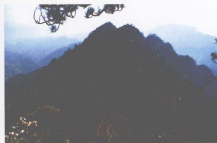
原始森林一角