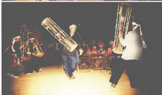
瑶族民间黄泥鼓舞