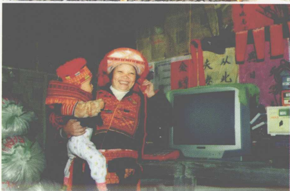
程控电话到瑶家