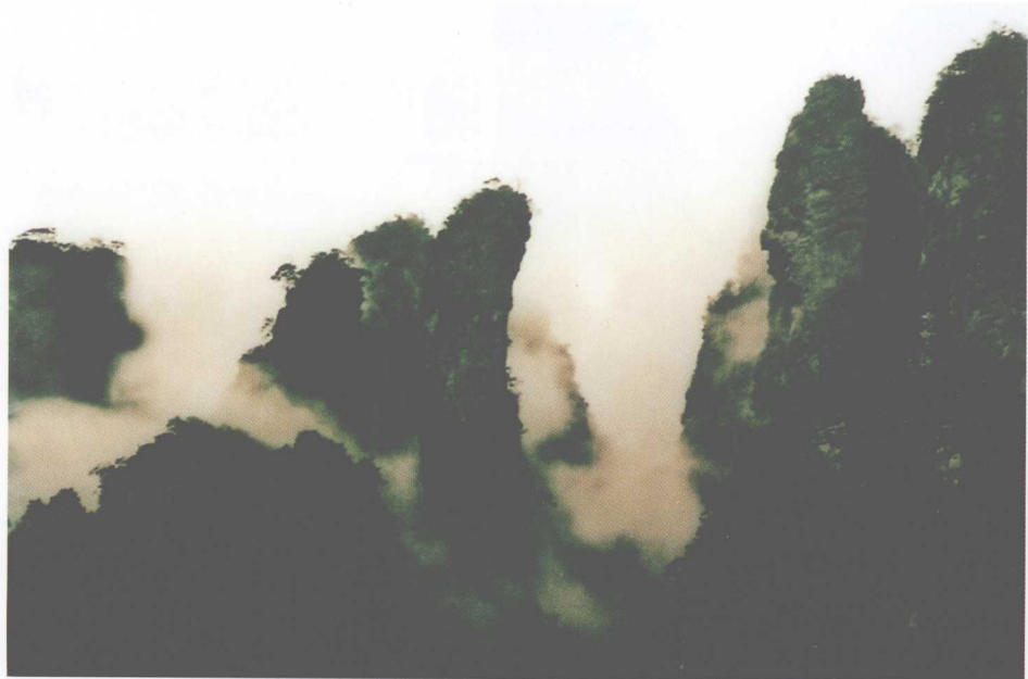
五指山风光