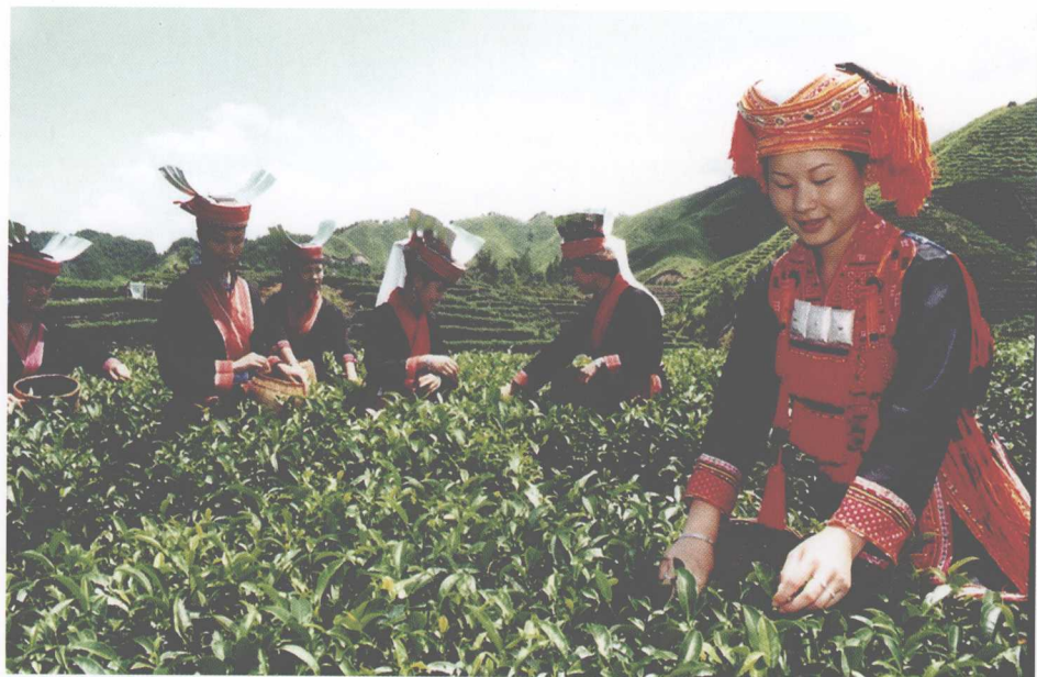
新春瑶妹采茶忙