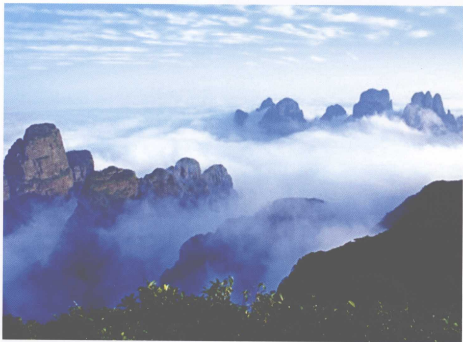
圣堂山风光