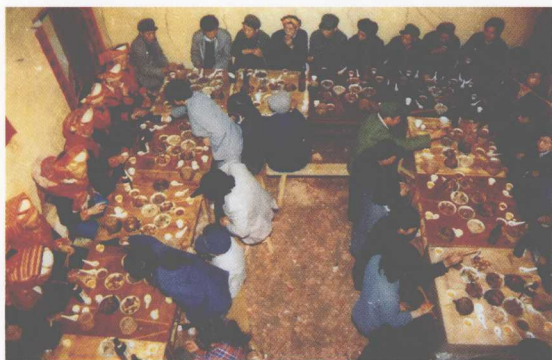
盘瑶婚礼酒席