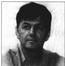
保罗·霍尔特 Paul Halter (1956—)

当代法国侦探小说作家，硕果仅存的坚持本格侦探小说创作的欧美作家，被誉为“黄金时代侦探小说最后的捍卫者”。