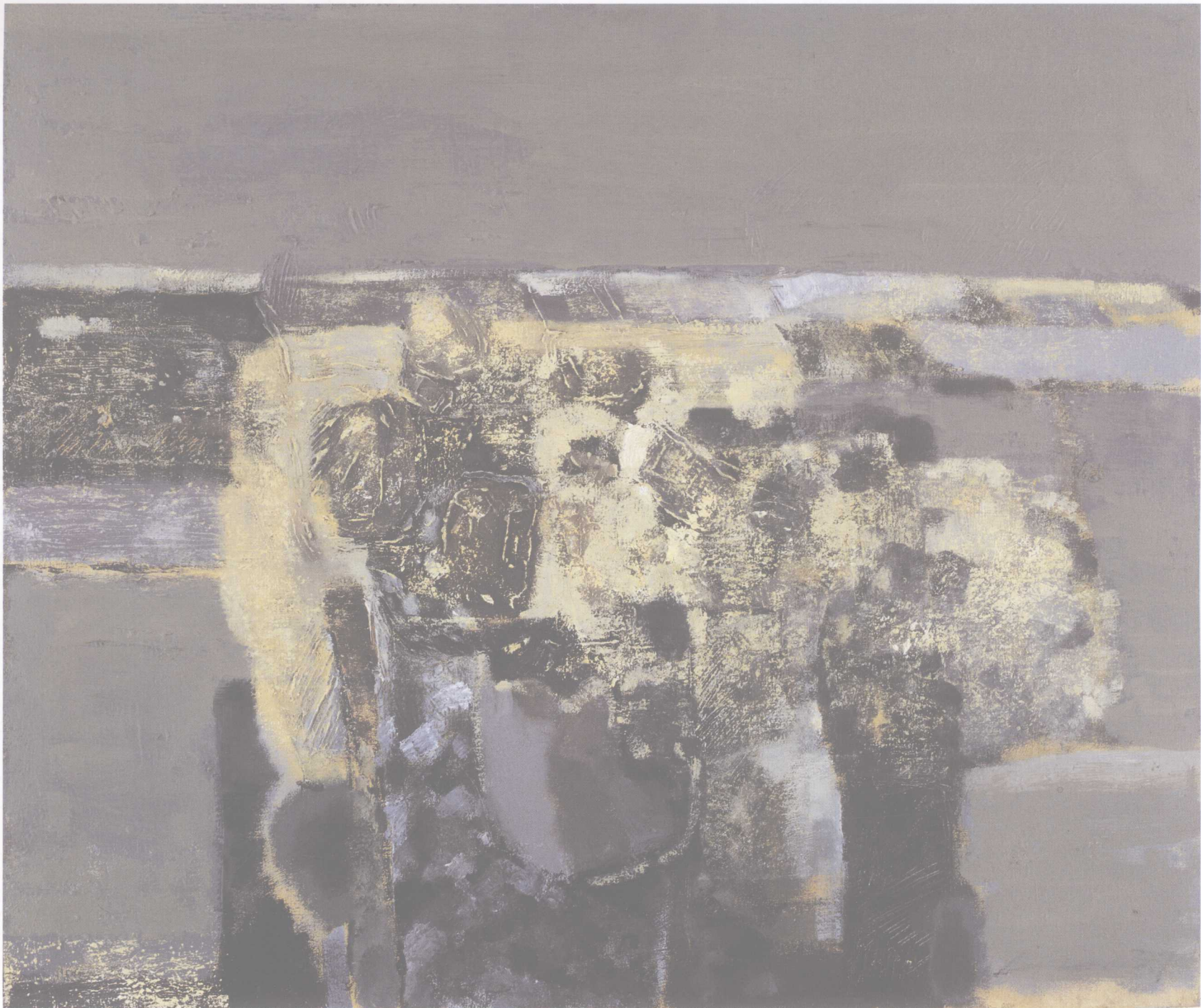
风景与花系列之六 73cm × 61cm