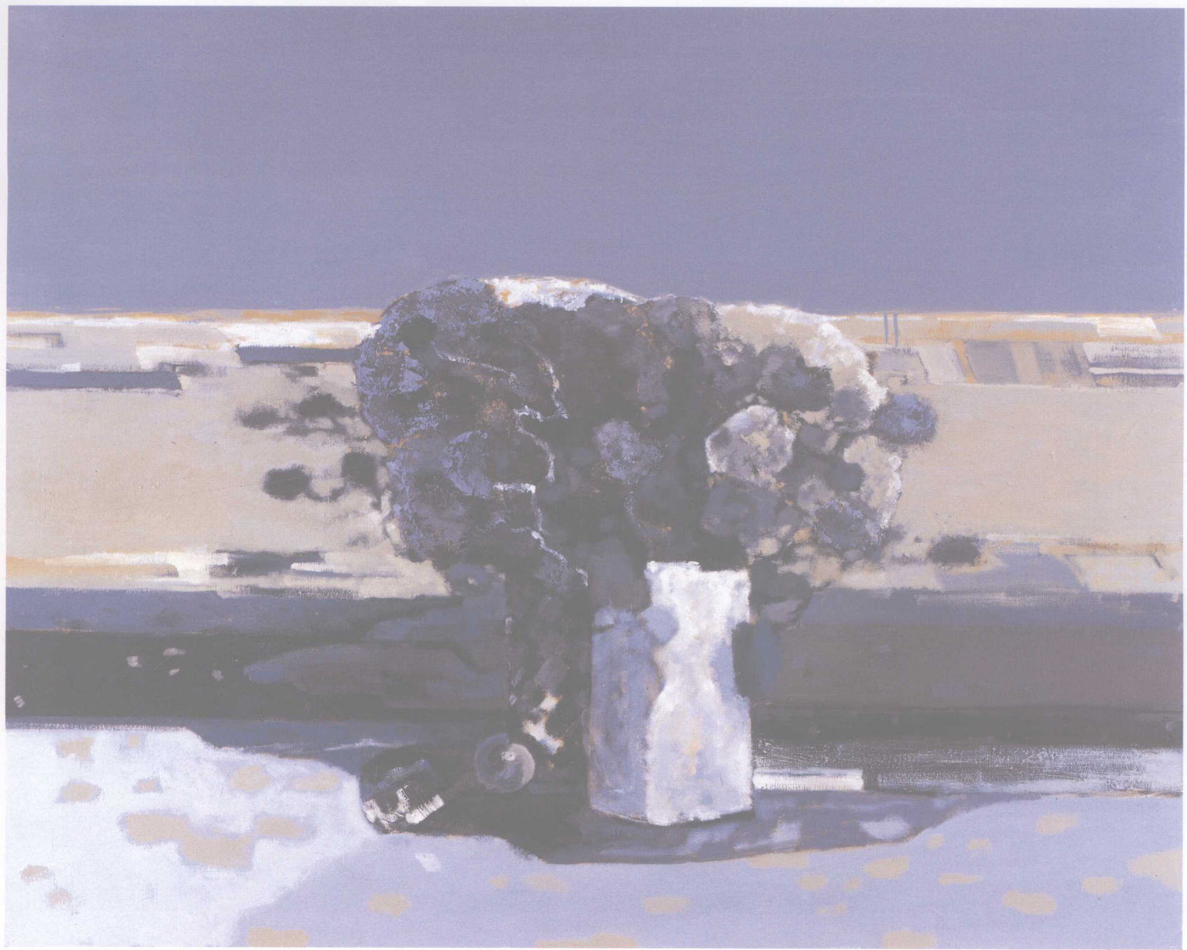
风景与花系列之八 150cm × 120cm