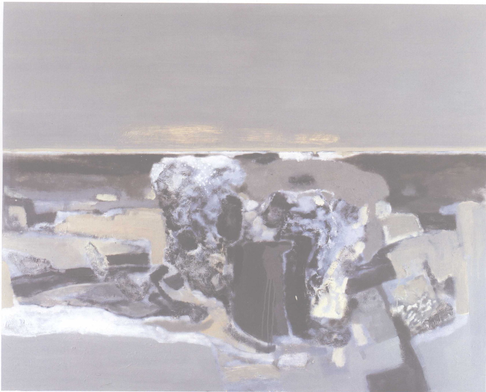
风景与花系列之五 150cm × 120cm