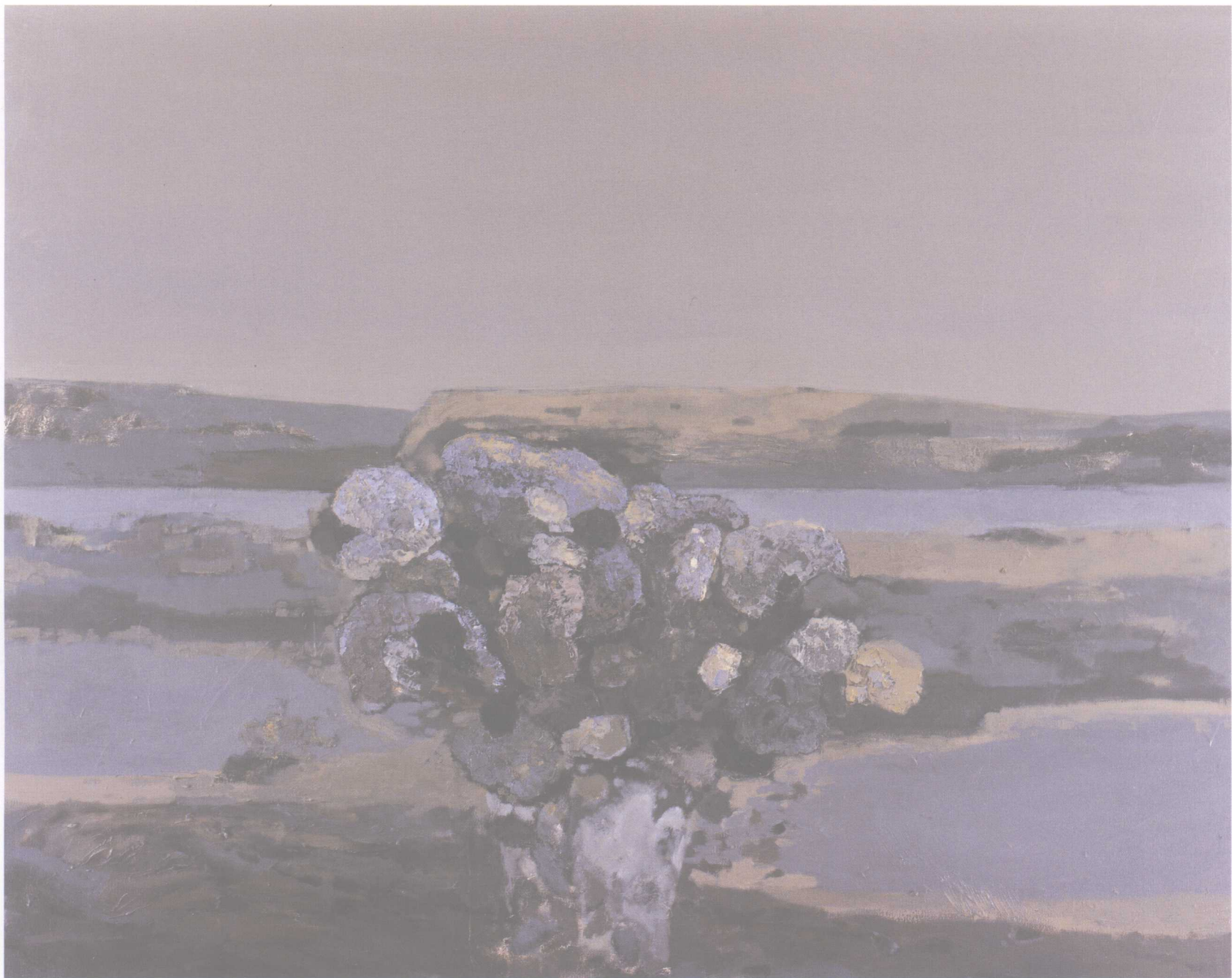
风景与花系列之七 150cm × 120cm