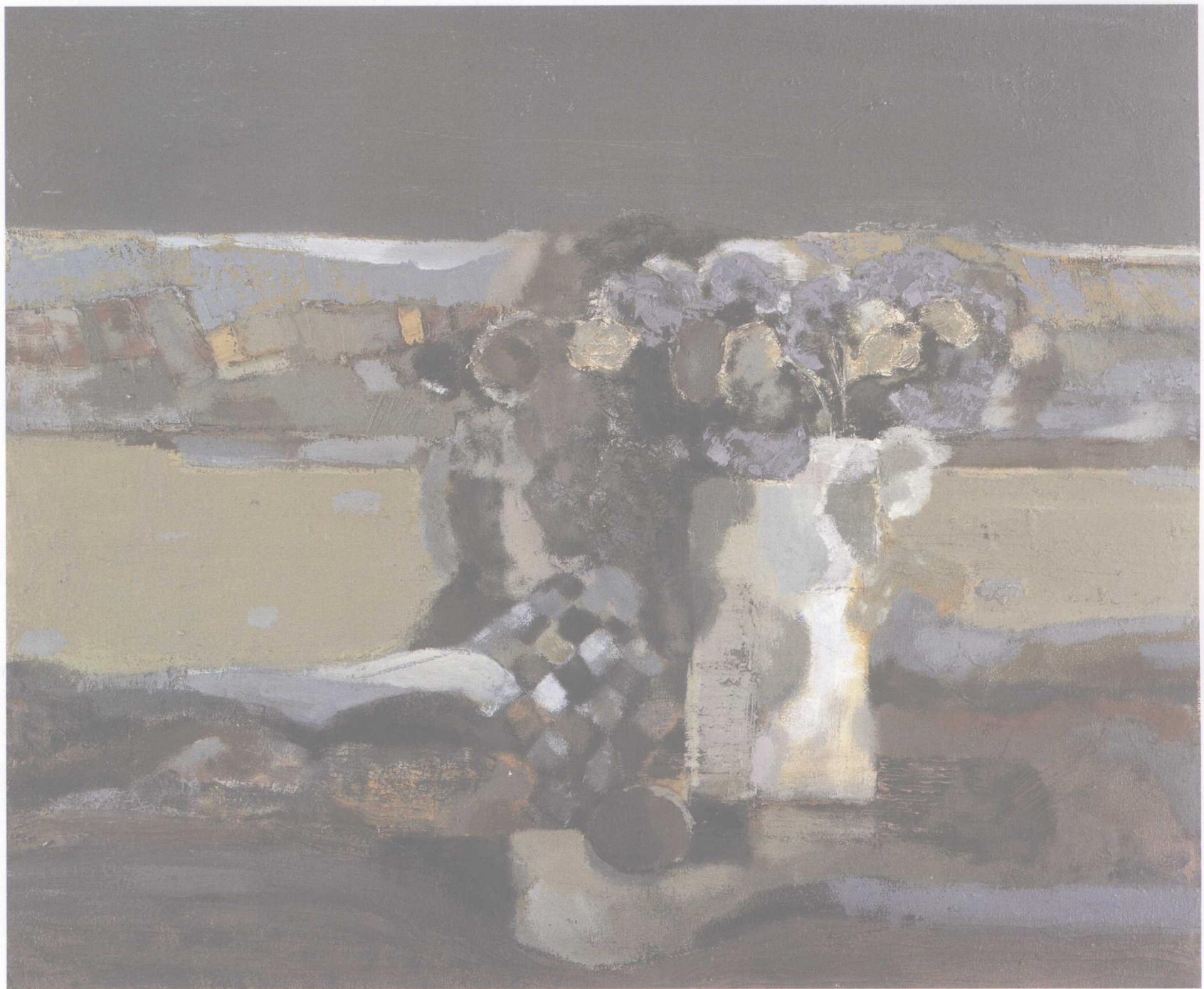
风景与花系列之二 73cm × 61cm