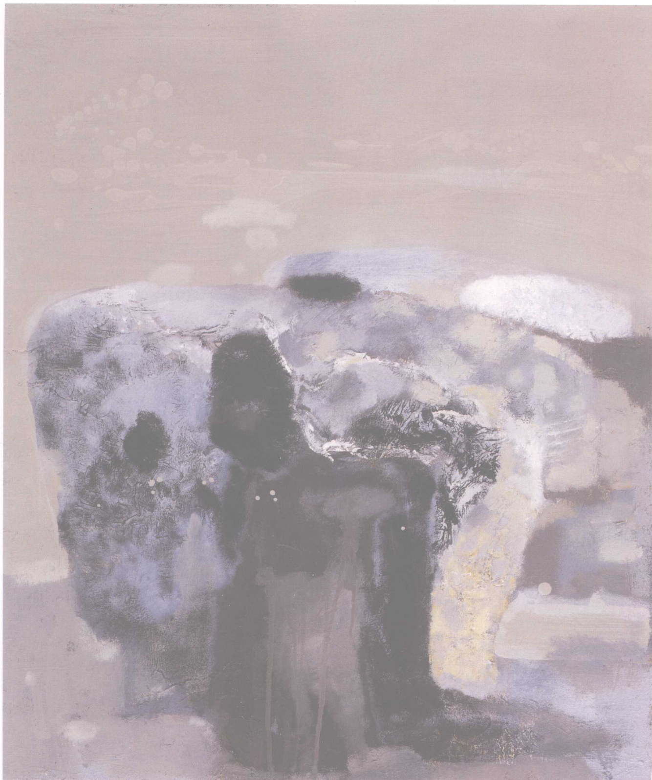
风景与花系列之三 73cm × 61cm