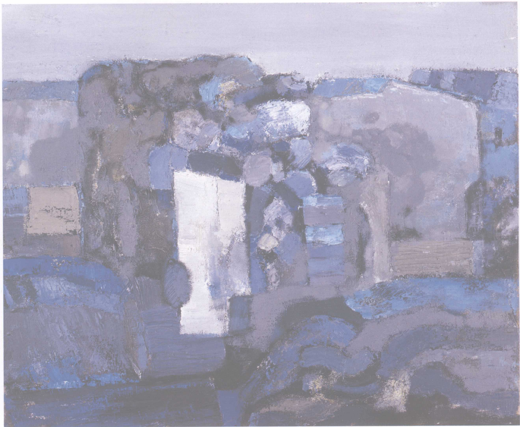
风景与花系列之四 73cm × 61cm