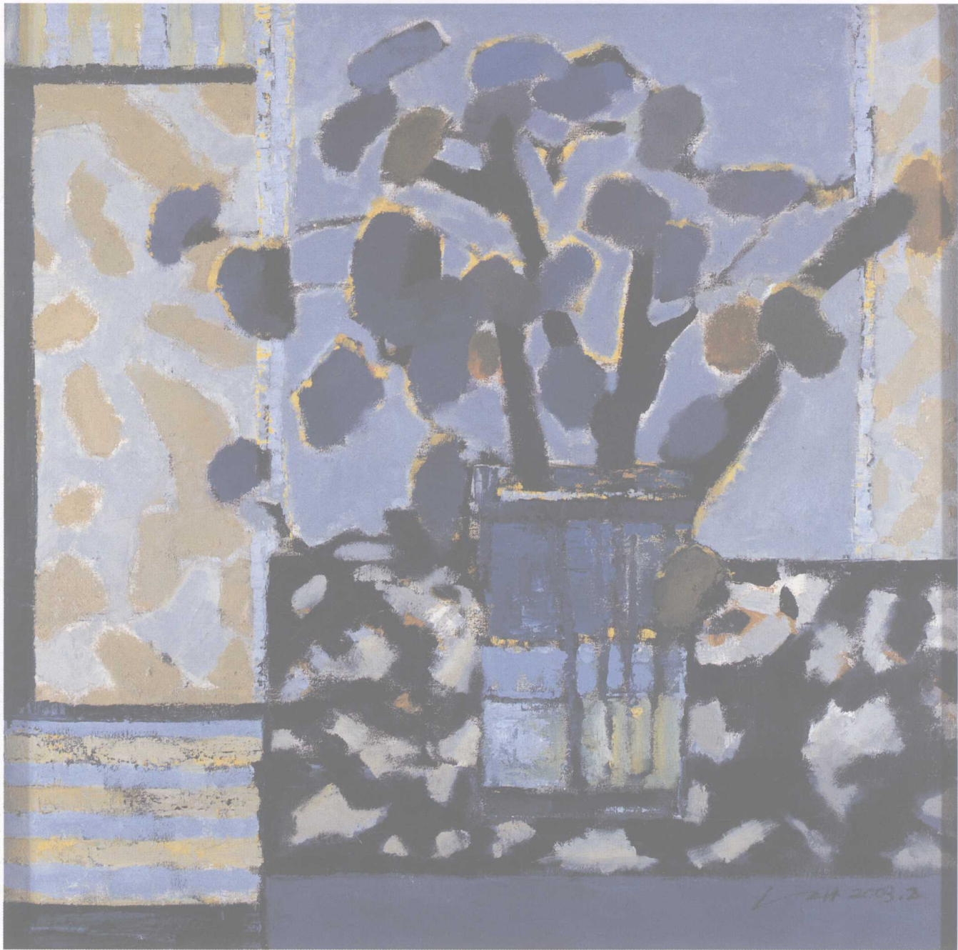
交响 100cm × 100cm