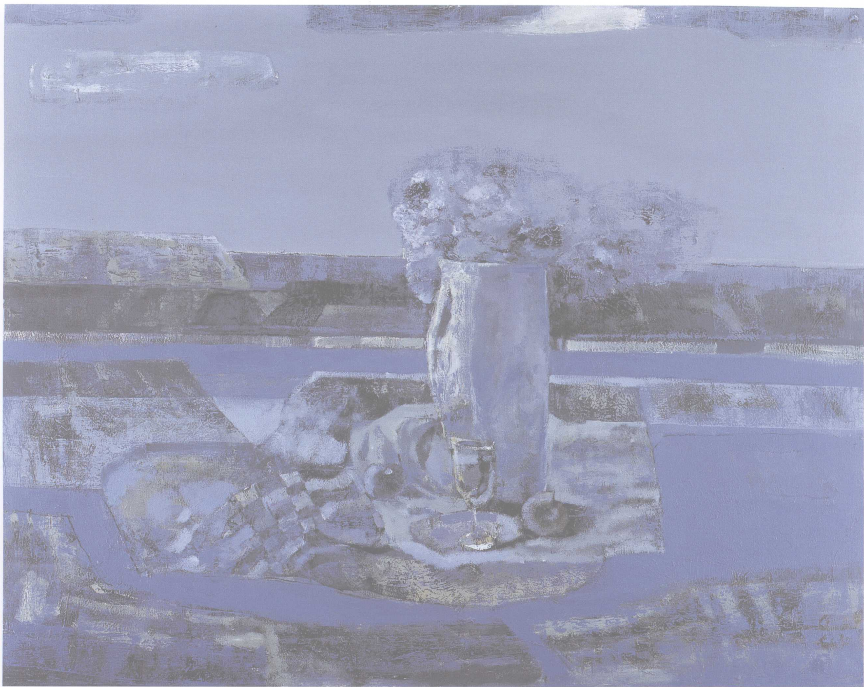
风景与花系列之九 150cm × 120cm