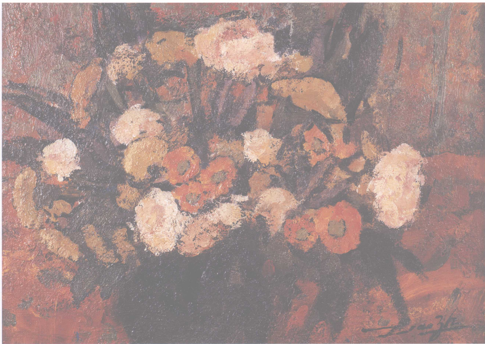
花系列之一 40cm × 30cm