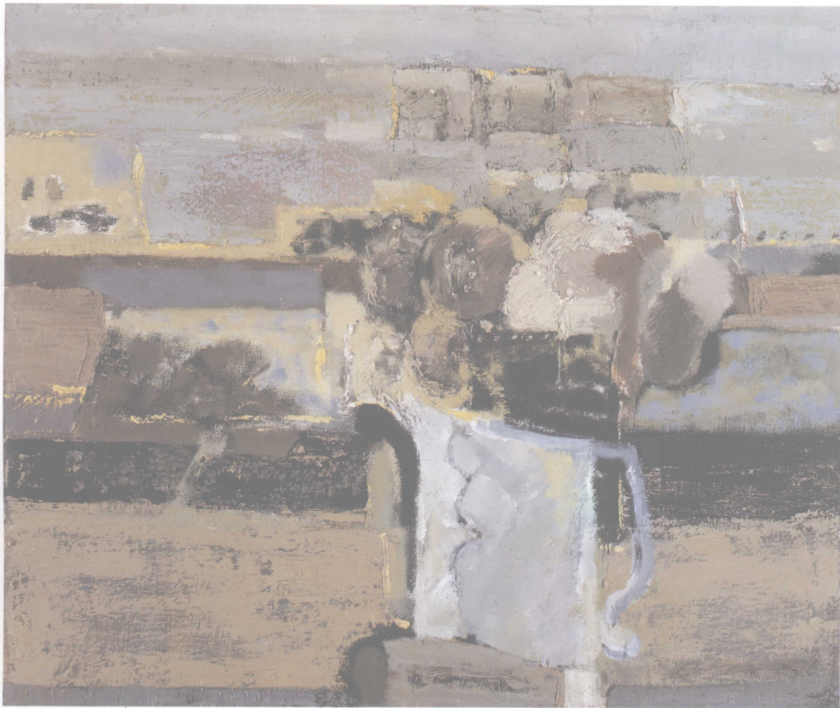
风景与花系列之一 73cm × 61cm