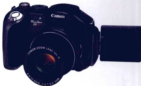
▲市面上有部分便携数码相机的LCD屏可作多角度扭动，方便取景拍摄。

同时，有部分相机的LCD屏可以调校出不同的角度，这设计在高角度或低角度拍摄时尤为方便，父母不须爬高爬低也可轻易取景，要知道当宝贝懂得爬行及走路时，他们便会四处走来走去，要捕捉他们的每个动作都是十分困难的，所以若相机的LCD屏能作多角度的调校，那在拍摄时就更加方便，令日常拍摄变得更轻松。