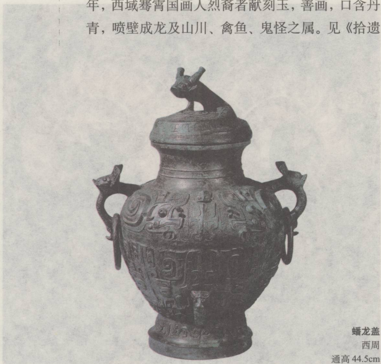
蟠龙盖 西周 通高44.5cm

三代之时，吾国美术盖由自然之发达，尚未受外国艺术之影响。及秦始皇统一天下，其版图扩张，渐与外国交涉，西域之美术渐次输入。始皇元年，西域骞霄国画人烈裔者献刻玉，善画，口含丹青，喷壁成龙及山川、禽鱼、鬼怪之属。见《拾遗