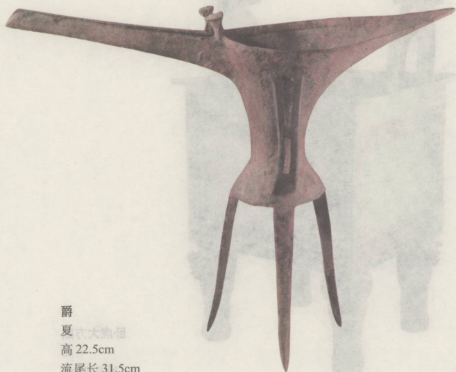
爵 夏 六代铜器 高 22.5cm 流尾长 31.5cm

伏羲画卦，仓颉制字，是为书画之先河，即为书画同源之实证。盖是时文明肇始，事务渐繁，结绳之制不足该备，不得不别创记载之法。而记载之法，必先诸数与形，取其简而易明，便于常用。故画卦所以明乎数，而文字始于象形。以象形而言，即含有图画之意。文字与图画初无歧异之分。例如☉日、☽月、木木、子子、𩺰鱼等字，即谓之图画亦可。迨后制作日繁，绘画之事则以五彩画十二章，藻火、粉米、山龙、黼黻之属为旗常、衣服之装饰，彩色之用，因以发达。华丽壮美，以兴起诚敬欢悦之感情。凡文字之所不能表明者，借此以表明之。钟鼎彝尊既有文字，又有饕餮、螭文、雷文、云文等互相表见。盖其时因文明制作渐兴，而文字绘画为民情民性表示之要素，故特显著也。