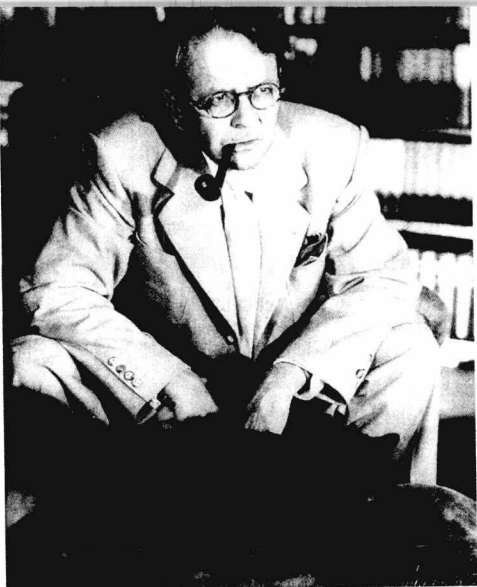
雷蒙德·钱德勒 Raymond Chandler (1888-1959)