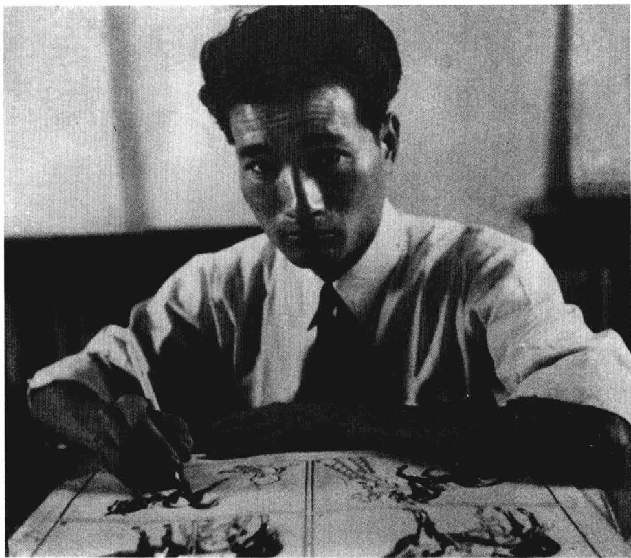
摄于 1946 年张乐平先生在创作《三毛从军记》时