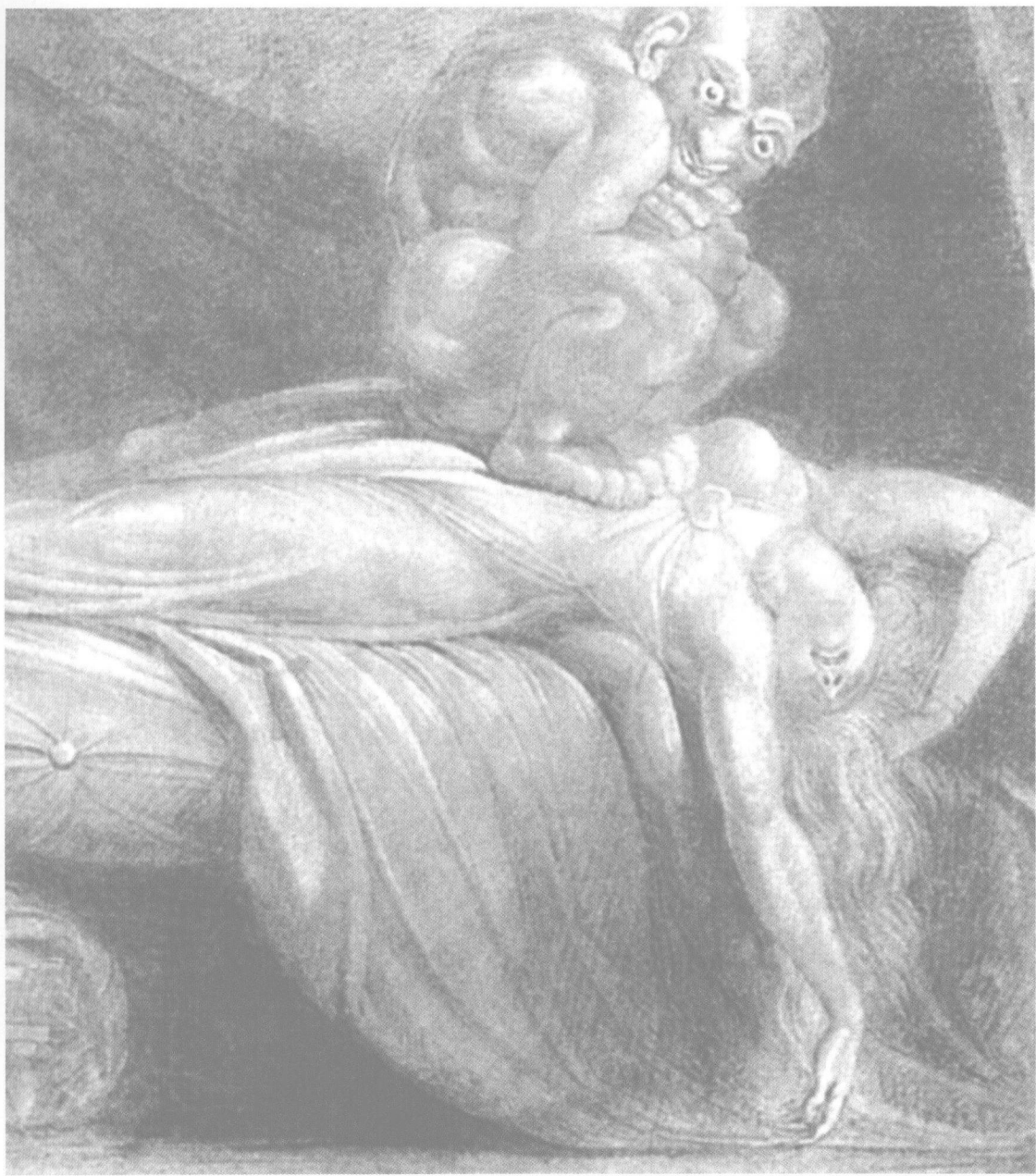
梦中景象 傅斯利 素描