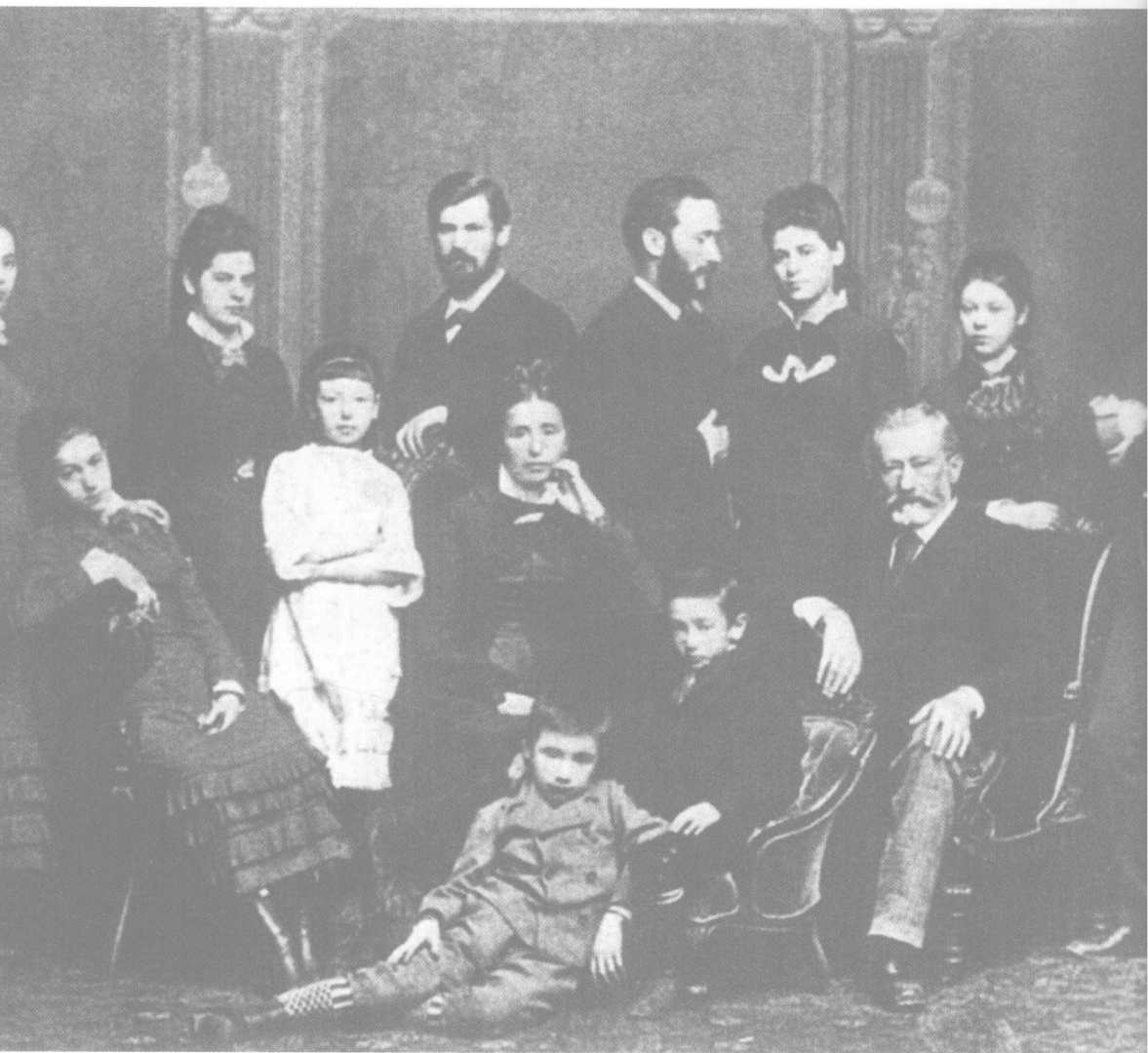
弗洛伊德全家摄于 1876 年,他中立正位,右面背对着他的是其同父异母兄伊曼努尔。后排左起:他的妹妹保琳、安娜;后排右起:表舅西蒙·纳森,妹妹玛丽和罗萨。中排坐者为弗洛伊德父母与妹妹多尔菲,座位上的小孩可能是弗洛伊德的小弟亚历山大,另外两个小孩不知是谁。