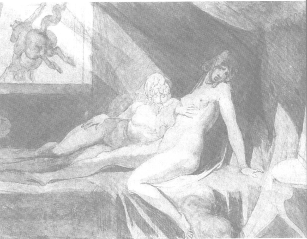
梦中景象 傅斯利 素描