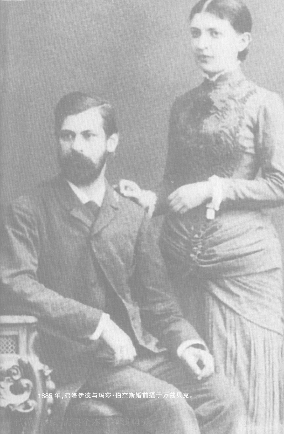
1885年,弗洛伊德与玛莎·伯奈斯婚前摄于万兹贝克。