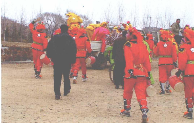
海阳秧歌表演队演出完毕被客村群众送出,再赴下一村