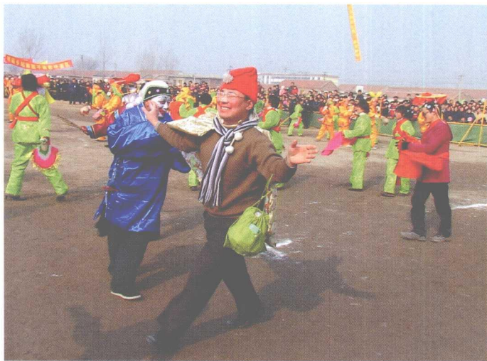
商河鼓子秧歌表演中的丑角扮相