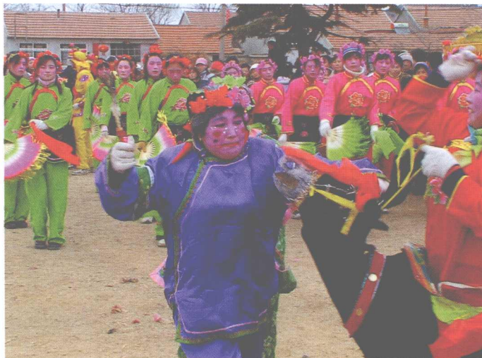
海阳秧歌表演中的女性角色及丑角