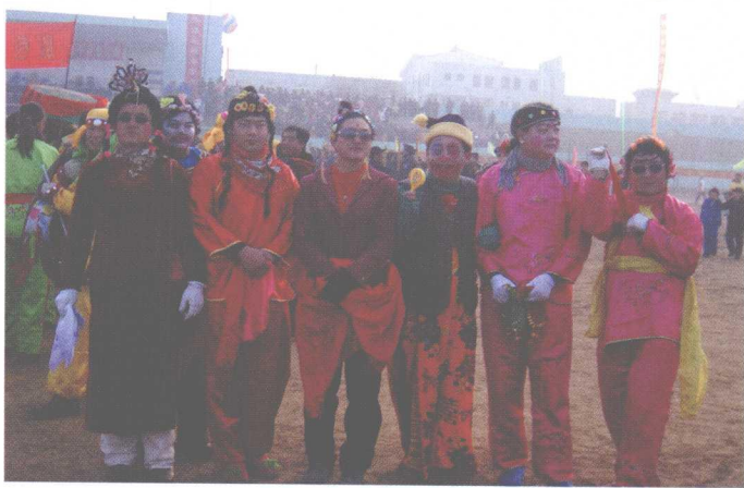
新春闹节时商河鼓子秧歌中的丑角(杂扮)形象(张蔚摄)