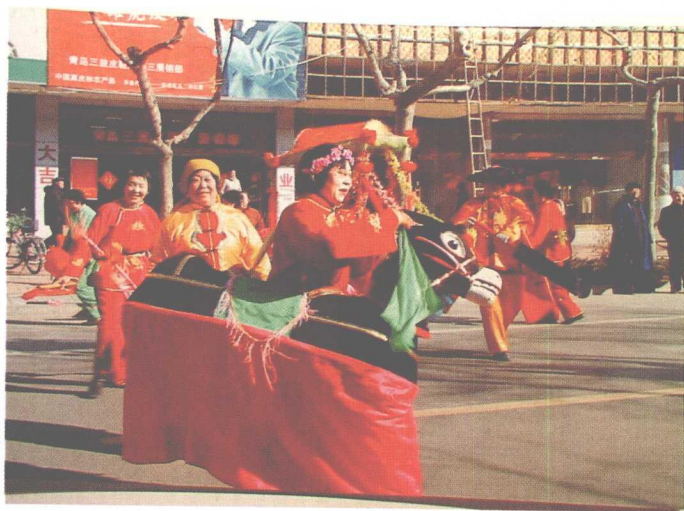
节庆期间胶州县城街头闹秧歌的喜庆气氛