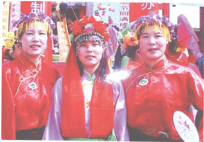
胶州秧歌节上的女性角色