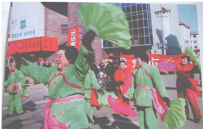
胶州秧歌也是中老年人热爱参与的表演形式