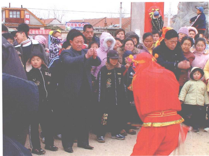
海阳秧歌年节村际互拜表演时的拜叩大礼