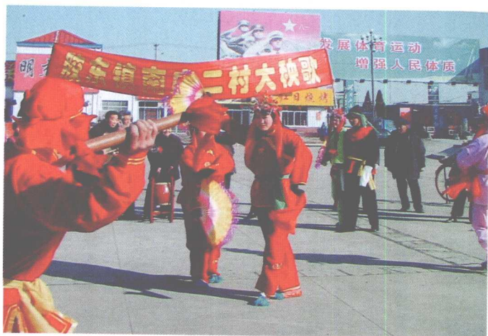
胶东镇南二庄的胶州秧歌表演