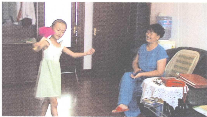
胶州市民从孩童时代开始学习胶州秧歌的现象非常普遍