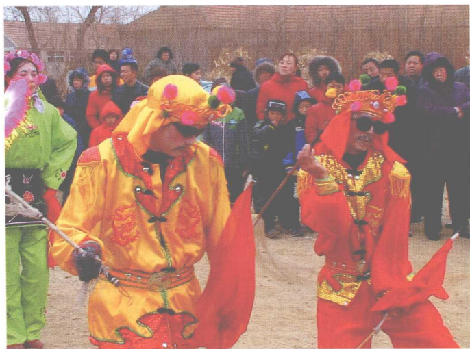
海阳秧歌中手持马甩的乐大夫装扮