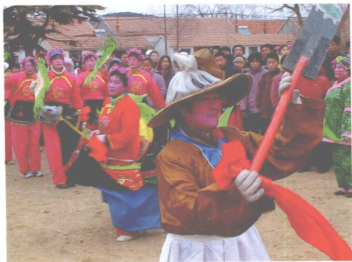
海阳秧歌表演中的杂扮人物造型