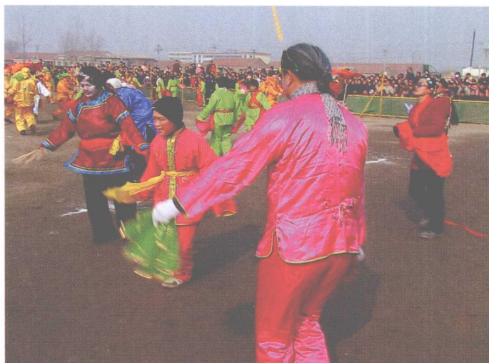
商河鼓子秧歌中的丑角表演