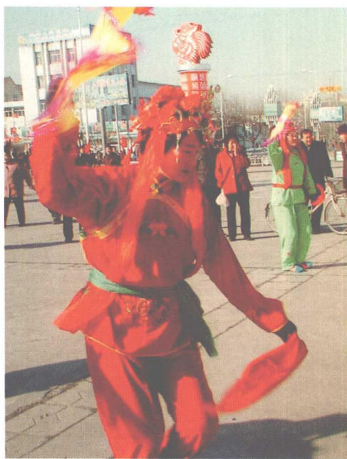
胶州秧歌传统装扮(宋振江 摄)