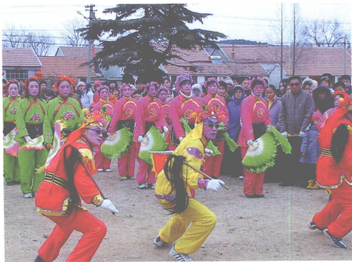
海阳秧歌中的乐大夫代表秧歌队完成三拜九叩的大礼