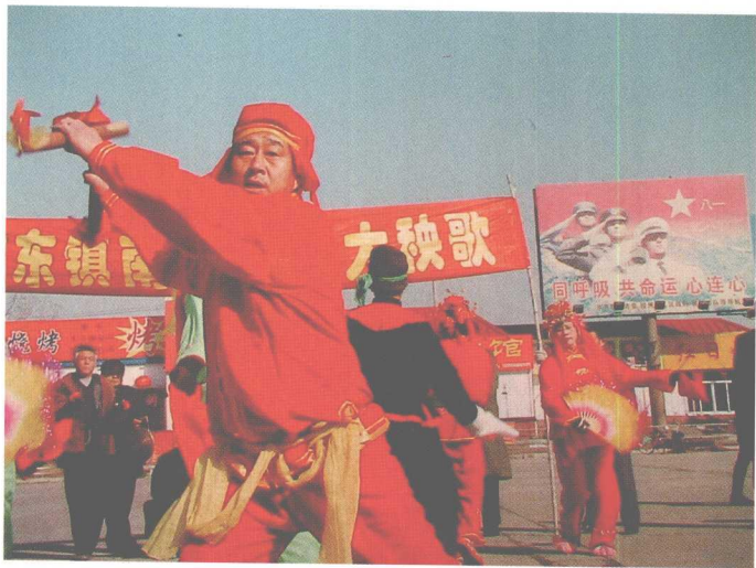
胶州秧歌中的男性角色着装