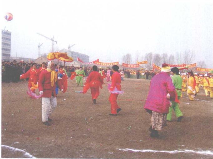
商河鼓子秧歌表演中的人物丑角(前戴头巾、戴帽者)与“花”