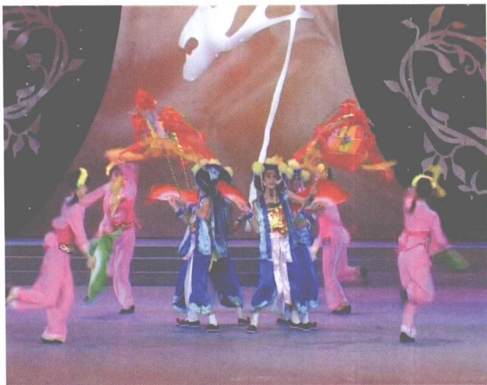
海阳秧歌参加 2007 中央电视台三套秧歌电视大赛