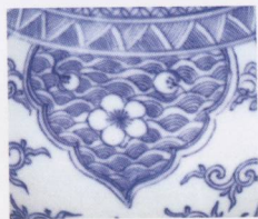
001 顺治青花长颈瓶（毛口）