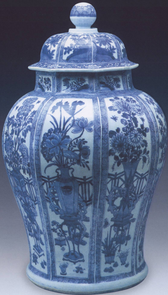
004 顺治八棱青花花卉将军罐