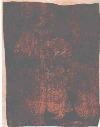
图 1-5 人物龙凤帛画

代名画记》中所描绘的那样：“汉武创置秘阁，以聚图书。汉明雅好丹青，别开画室。又创立鸿都学，以积奇艺，天下之艺云集。”汉代最著名的帛画为1972年在长沙马王堆利仓及其家属坟墓中出土的“T”形旌幡帛画，这幅帛画充分显示了当时画家们对绘画中色彩、动物形象以及巧妙布局的较高的把握能力与表现技巧。