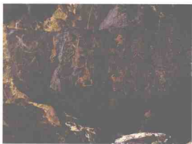
图 1-1 阴山岩画之围猎图