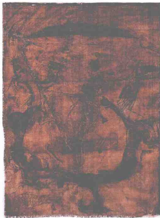
图 1-4 人物御龙帛画