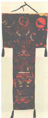
图1-6 马王堆一号汉墓T形帛画

魏晋南北朝时期的绘画艺术在继承前代绘画艺术的基础上，空前发展，人才辈出，出现了中国绘画史上第一批有可靠文献记载并有绘画作品传世的画家队伍。这一时期的绘画既有“成教化，助人伦”的功能，也有追求畅神适意、纯粹审美的艺术享受；既有“笔才一二，像已应焉”的张僧繇的疏体，亦有笔迹周密、顾恺之、陆探微的密体；既有“其体稠叠，衣服紧窄”的“曹衣出水”，亦有“春蚕吐丝，流水行地”的传统线描。人物画出现了东吴的曹不兴，西晋的卫协，东晋的顾恺之，南朝的陆探微、张僧繇，北朝的曹仲达、杨子华等一大批画家。山水画与花鸟画开始萌芽，山水画虽然没有独立成科，但关于山水画的著述与记载为数不少，顾恺之的《画云台山记》、宗炳的《画山水序》、王微的《叙画》等论著都是探讨山水画的重要著作。此时期的山水画多作为人物画的背景出现在画面中，张彦远在《历代名画记》中云：“其画山水，则群峰之势，若钿饰犀栉，或水不容泛，或人大于山。率皆附以树石，映带其地，列植