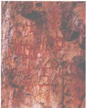
图 1-2 花山岩画之祭神舞蹈图

中国古代绘画艺术源远流长，最早可追溯到远古时期的岩画与彩陶器皿上的简单的装饰绘画。中国绘画艺术在历史的长河中，几经嬗变演进，逐渐形成了其独特的艺术风格与表现语言。这种传统风格和民族的审美需求，又在时代的前进中不断地得到充实、突破和创新，并孕育和造就着新的风格，成为华夏艺苑中的瑰宝，也是世界美术花园中一朵光彩夺目的奇葩。