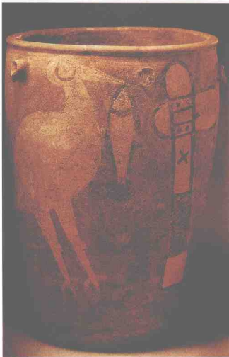
图1-3 鹤鱼石斧图彩陶缸

汉代的帛画作品颇多，也比战国时期更为成熟、完善。由于历史原因，虽然留存下来的绘画作品极少，但是都极具历史价值与艺术价值，正如唐代张彦远在《历