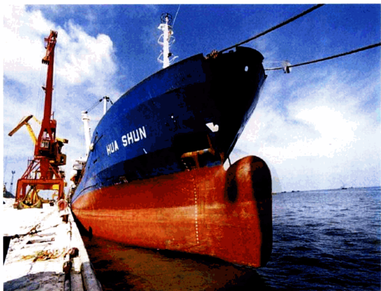
千年商港巨轮待发

进入新世纪以来，中国实施西部大开发战略，北海被国家定位为西部开发重点和优先发展区域，获得了历史性的发展机遇。