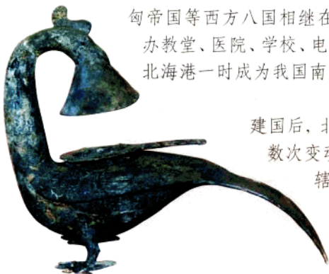
合浦汉墓出土的国家 一级文物—西汉铜凤灯

北海之名始于清康熙元年（1662年）所设“北海镇标”，因市区北面临海而得名。1876年，《中英烟台条约》将北海辟为通商口岸，英国、法国、德国、美国、意大利、葡萄牙、比利时、奥匈帝国等西方八国相继在北海设立领事馆，开办教堂、医院、学校、电报公司和轮船公司等，北海港一时成为我国南方重要的对外商港。