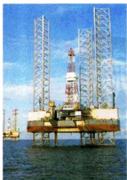
北部湾油气钻井平台

境内地势从北向南倾斜，东北、西北为丘陵，南部沿海为台地和平原。沿海多港湾，市区南北西三面环海，地形南北狭，东西长，呈半岛状，市区海滨平原土地占总面积的 70% 以上，海洋滩涂占市区土地总面积 20% 左右，市区海岸线总长 173.18 公里。平均海拔为 10—15 米，市区最高点（冠头岭）为 120 米，全市最高峰（五点梅）为 554 米。有涠洲（24.74 平方公里）、斜阳（1.8 平方公里）二个海岛，属火山岩台地。