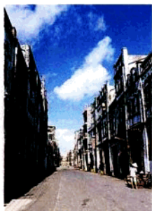
百年老街见证 北海沧桑历史

北海历史悠久。早在汉武帝元鼎六年（公元前111年），北海所辖的合浦县即设立合浦郡，是当时幅员辽阔的岭南三大郡之一，从那时起，北海港即成为中国与东南亚、西亚乃至欧洲进行海上贸易的最早商港和闻名于世的“海上丝绸之路”始发港之一。