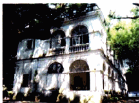
建于1877年的原英国驻北海领事馆

北海面向北部湾，背靠云贵川，毗邻粤港澳，处于中国东部与西部的结合带和大西南、海南及东南亚的中枢位置，是中国大陆距离东南亚、西亚、欧洲最近的港口之一，是中国西南及华南、华中部份省区最便捷的出海口，也是中国五个少数民族地区和中国西部唯一的沿海开放城市，在西南经济区域及亚太经济区域发展格局中具有独特的区位优势。