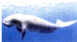
中国一级海洋保护动物—儒艮

全市沿海海洋生物共有1500多种，拥有中国仅有的两种国家一级海洋珍稀保护动物—儒艮（俗称美人鱼）和中华白海豚，北海海域内茂盛的海草、鱼虾蟹和微生物，为儒艮、白海豚提供了良好的食物链，目前，合浦沙田设有中国唯一的儒艮自然保护区。全市有经济价值的沿海生物高达450种。海洋植物以红树林最为名贵，红树林具有净化环境、防浪抗潮、保护堤围的作用，是