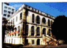
建于1877年的北海海关旧楼