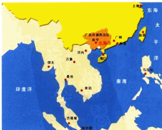
北海在亚太经济区域中的位置