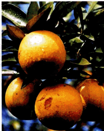
北海出产的热带和亚热带水果