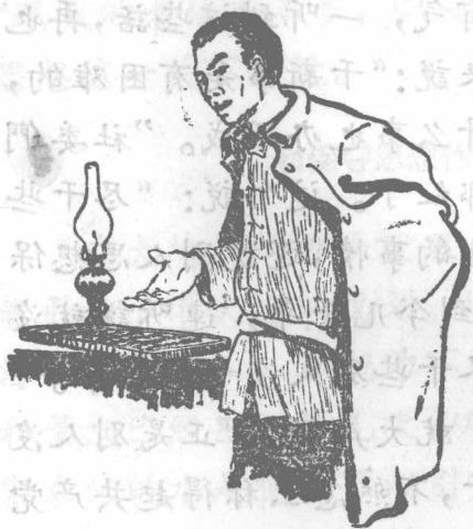
張先知講修水渠的道理

正确的。照我看，能修100亩活水，也不修1万亩死水。去年、前年修的死水庫，到今天不还是干的嗎？第四队正冲修的那条活水渠，受的200多亩田，今年遇到大旱，还不是获得600斤