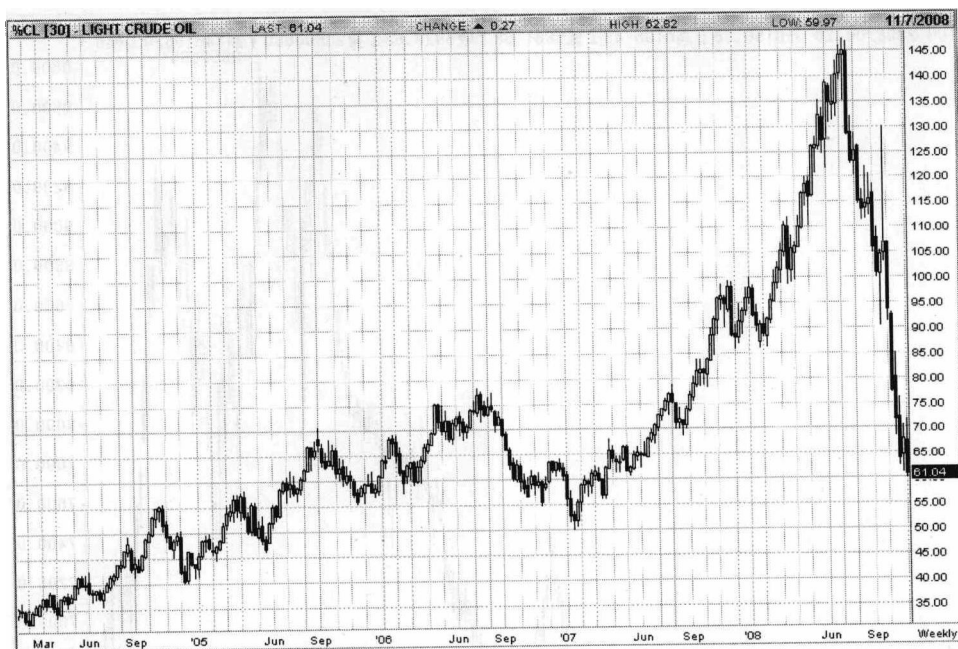
图 1 轻原油 K 线图

请投资人们注意，人类任何的行为都有其特定的动机与目的存在，请思索行为背后真正代表的含意。就股市中的操作而言，为什么要刻意释放利多消息，为什么公司的经营者会不断地上媒体宣扬公司前景如何美好……。思考可以协助我们适当地解读其行为真正之目的而不被蒙蔽，若再辅以技术分析中相对位置的分析，自然就容易规避不确定的风险。