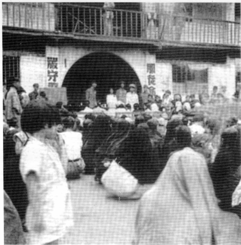
1951年6月南宁市公安局领导 向有关人员宣布政府禁娼令。