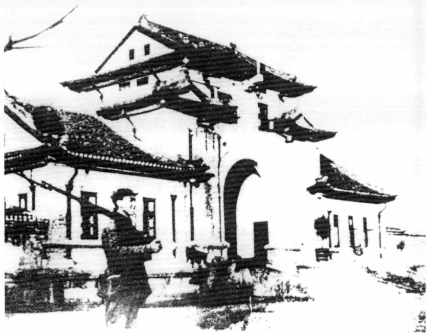
在桂林设立广西省委和省人民政府的临时 办公机关。广西省委于1950年1月迁往南宁。 图为广西省委在桂林的驻地。