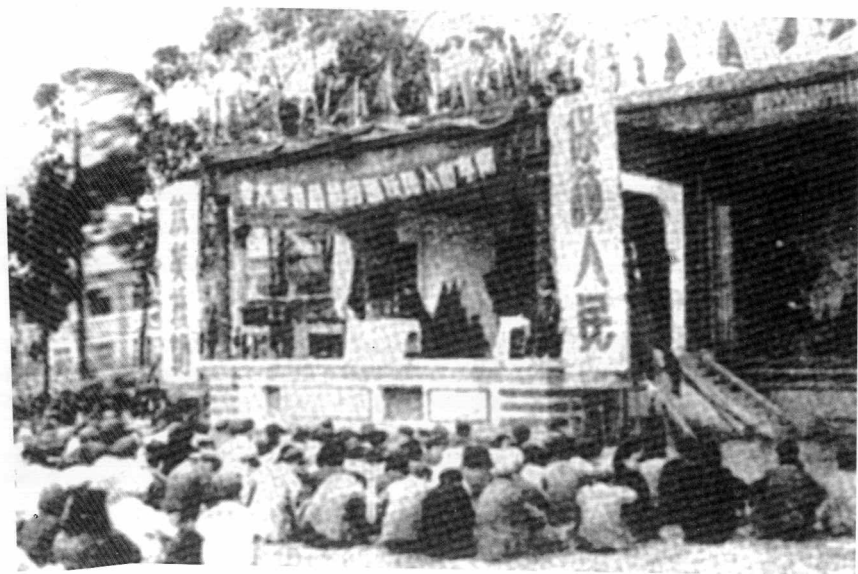
1951年4月召开的南宁人民反匪特维护治安大会会场。