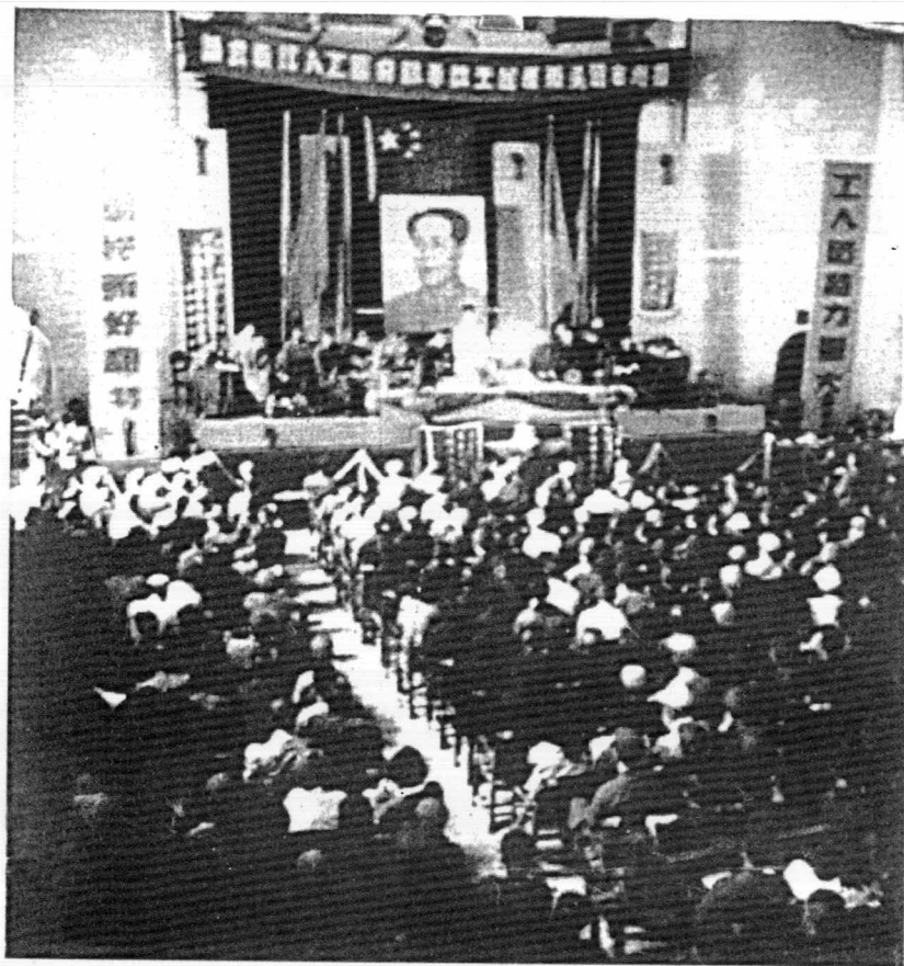
梧州市民主改革会场(1952年)