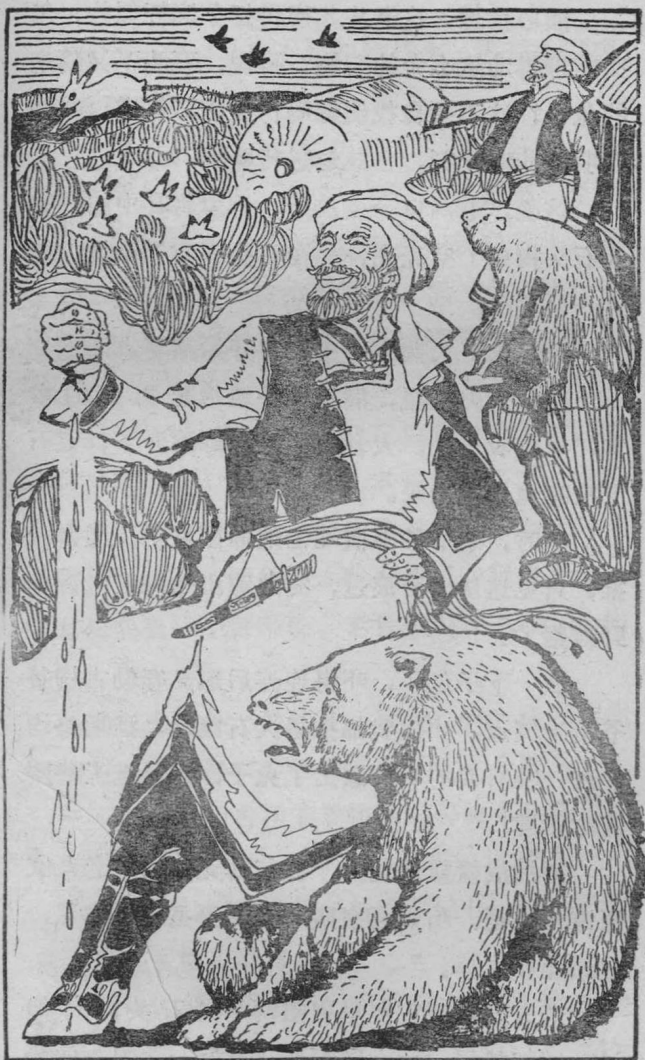
文 涛 画