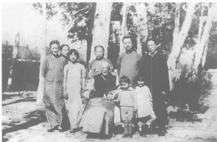
陳寅恪與諸兄妹陪同父親游北平香山，於白皮松前合影