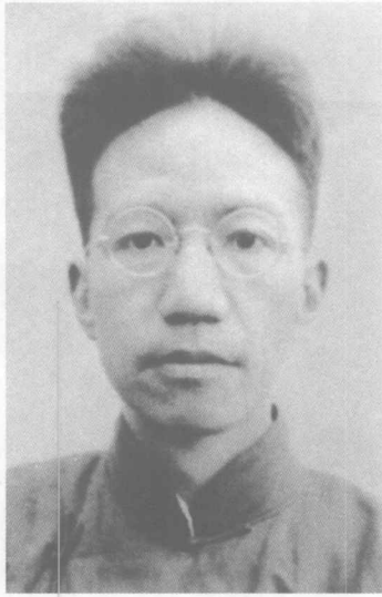
香港期間留影 一九四〇年