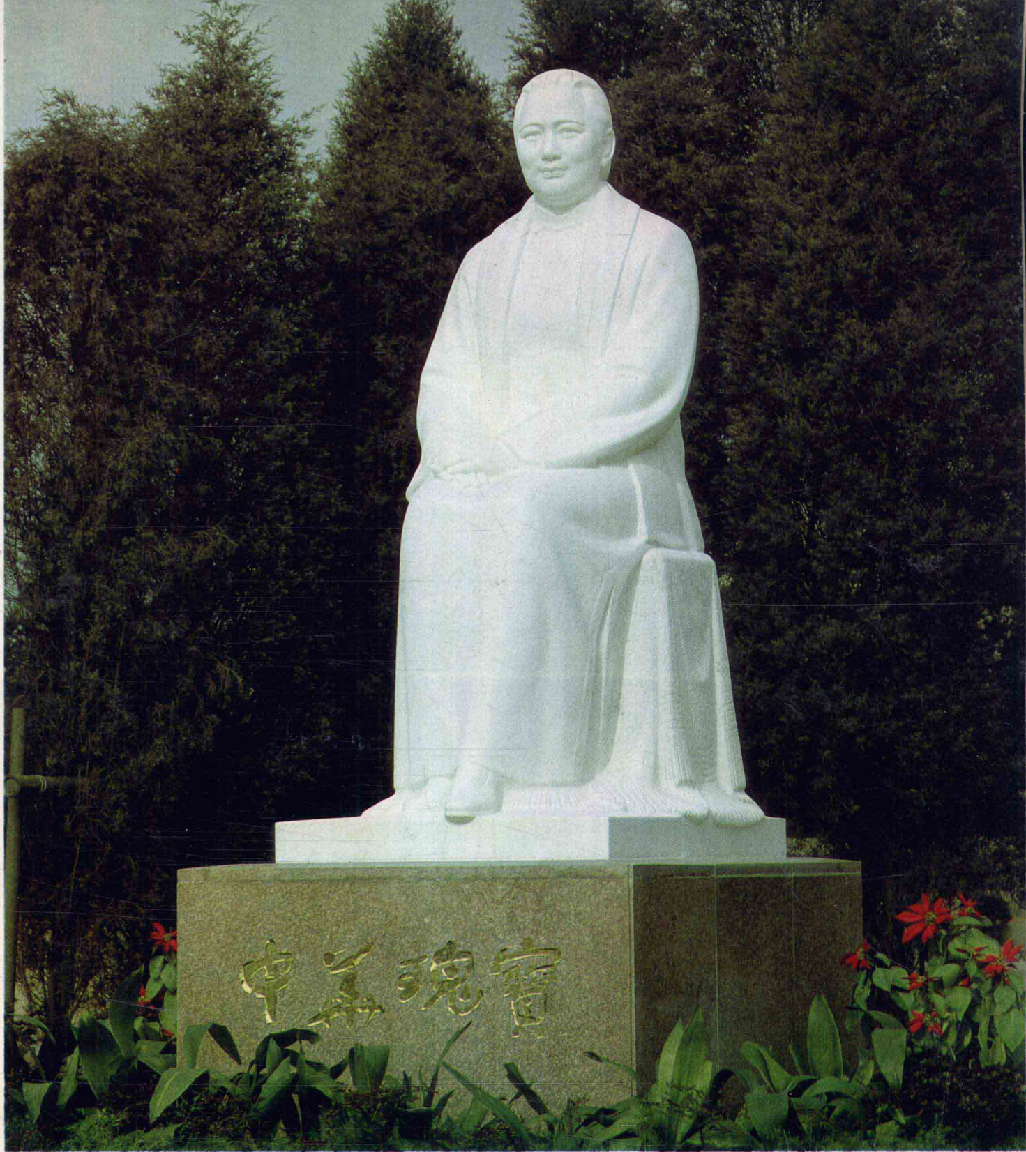
宋庆龄名誉主席像 1983年 高360厘米 汉白玉石 上海宋庆龄同志陵园 张德蒂(女) 郭其祥 孙家彬 张润圯 曾路夫

The Portrait of Honorary Chairman Song Qingling, 1983, 360cm high, white marble, Song Qingling Cemetery, Shanghai, by Zhang Dedi (female), Guo Qixiang, Sun Jiabin, Zhang Runkai and Zeng Lufu