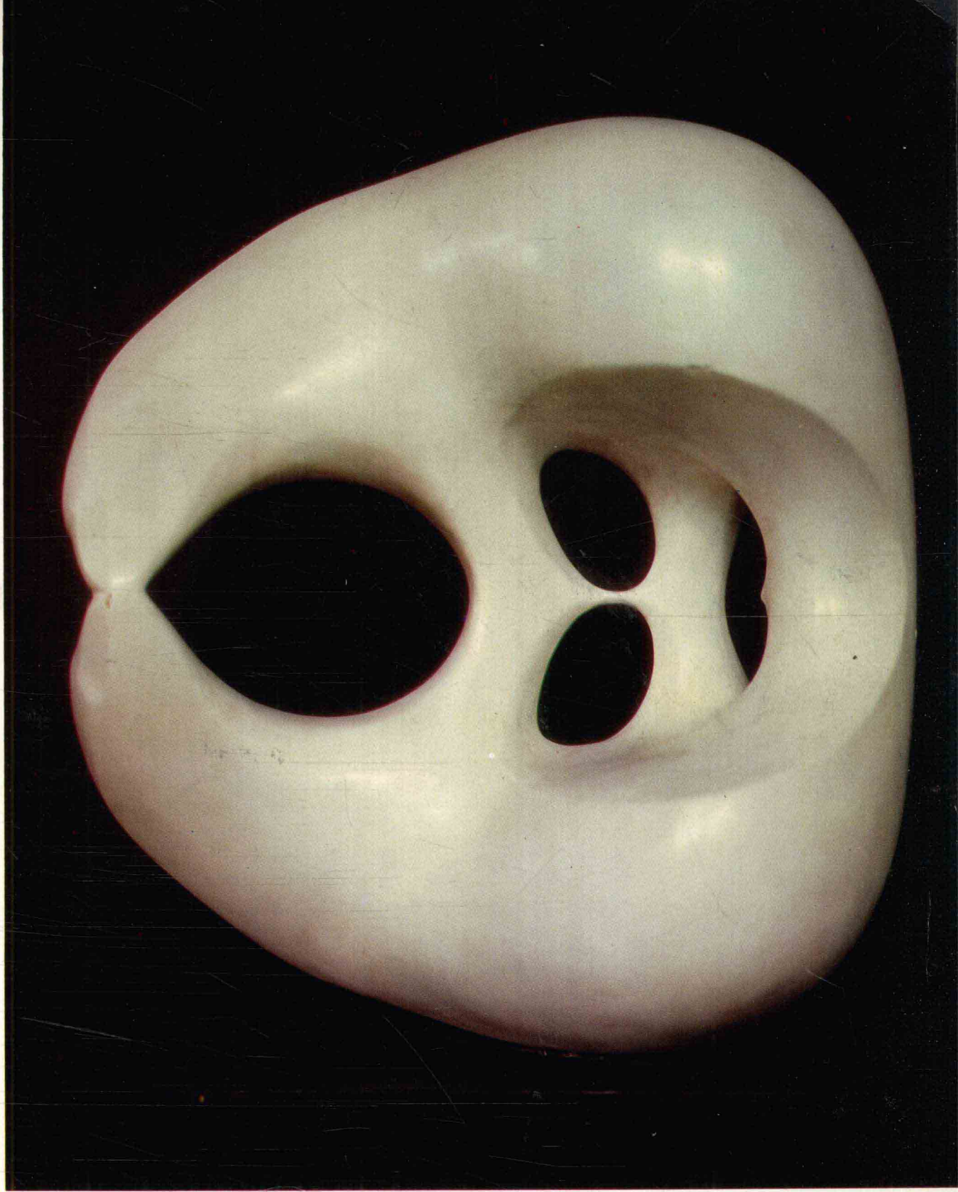
饮水的熊 1984年 高60厘米 石 雕