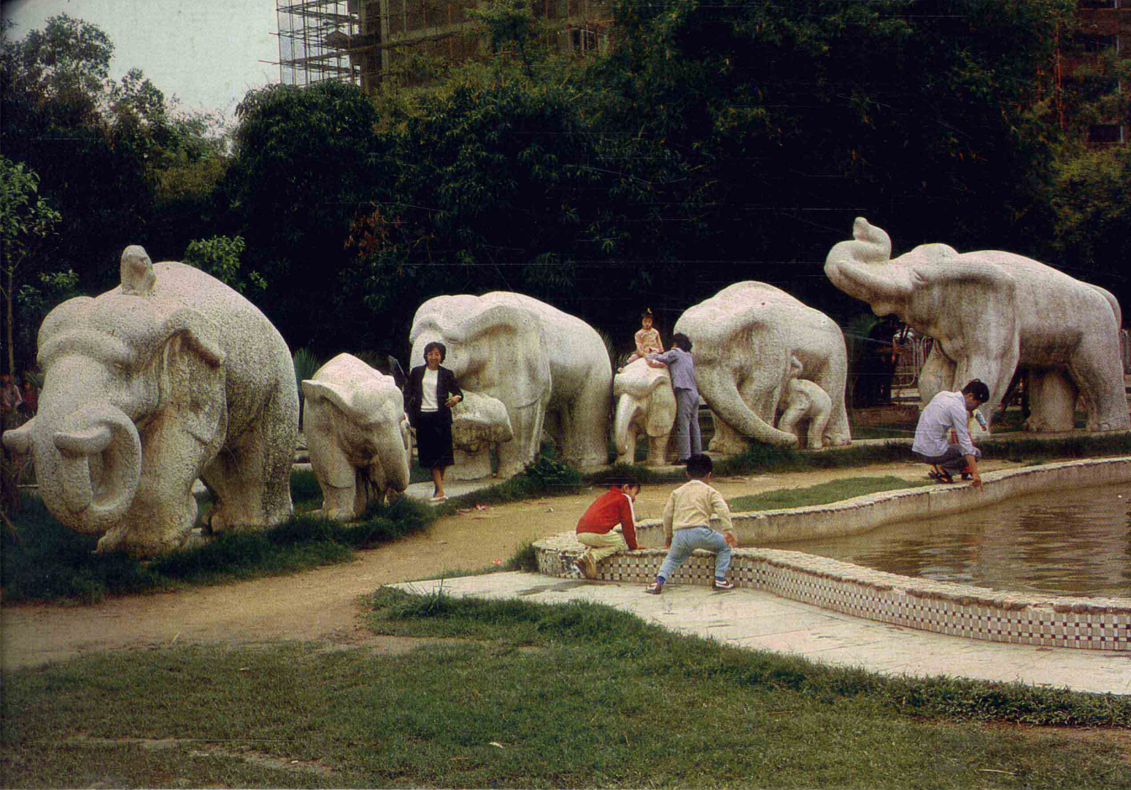
大象家族 1981年 310×1750厘米 深圳工人文化宫