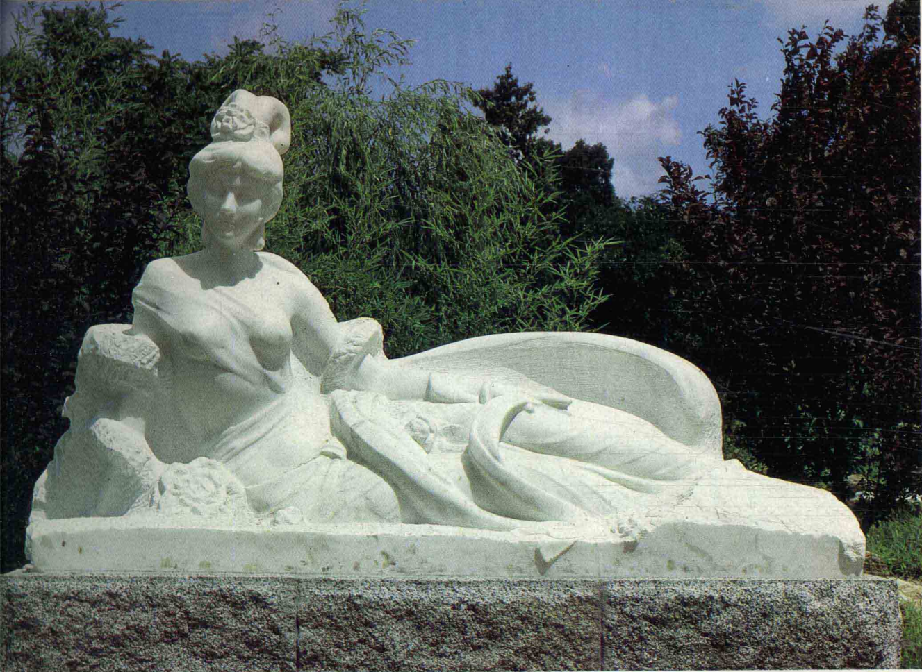
牡丹仙子 1982年 高 300 厘米 汉白玉石 北京植物园 史超雄

Peony Fairy, 1982, 300 cm high, white marble, Beijing Botanical Gar- den, by Shi Chaoxiong