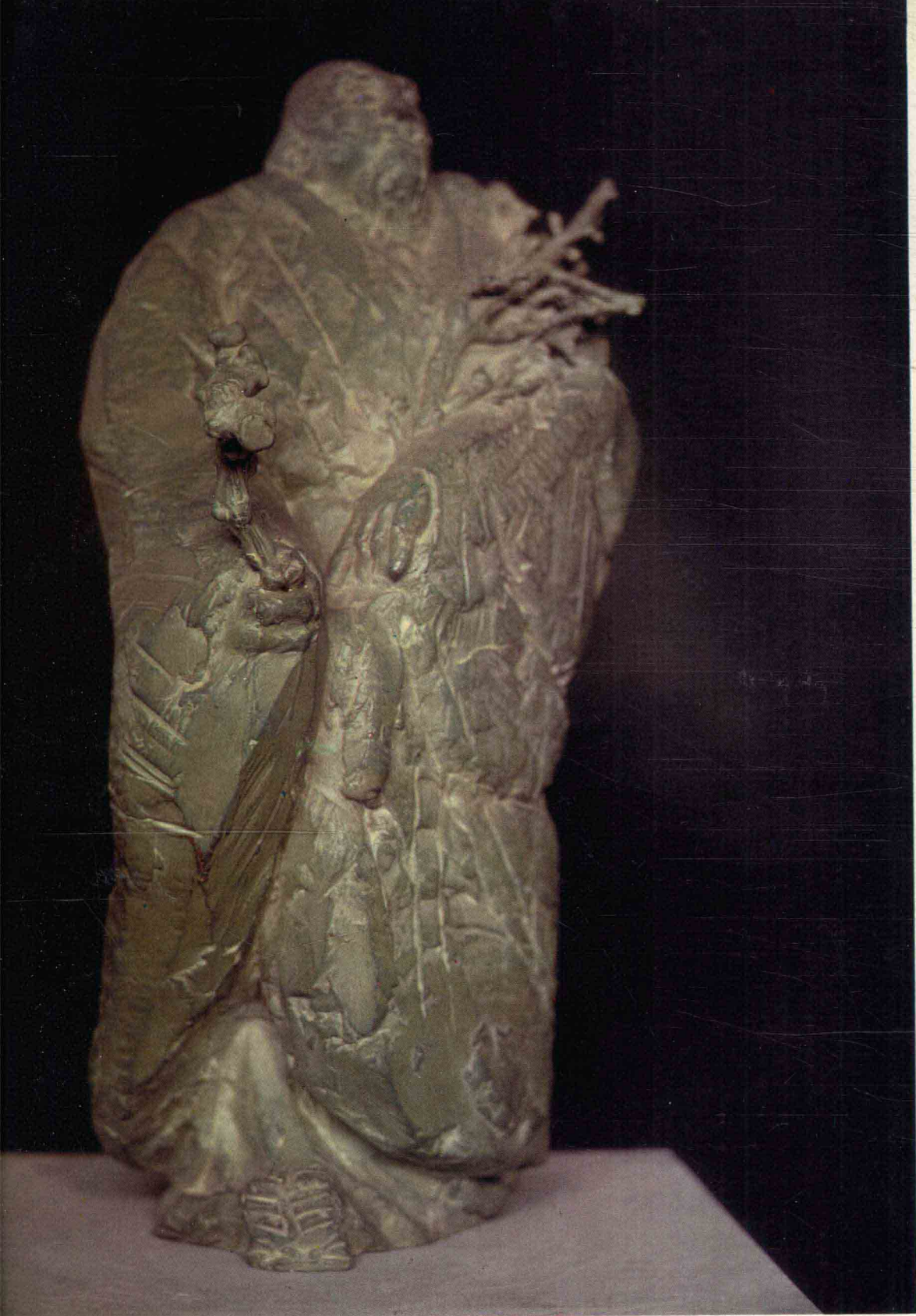
画僧——担当 1981年 高70厘米