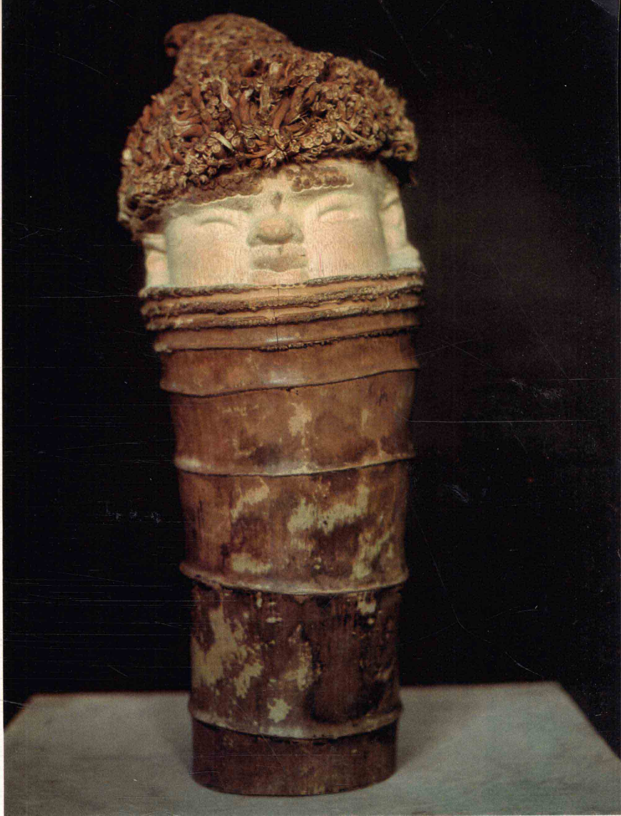
高山人家（组雕之一） 1984年 高53厘米 竹根雕