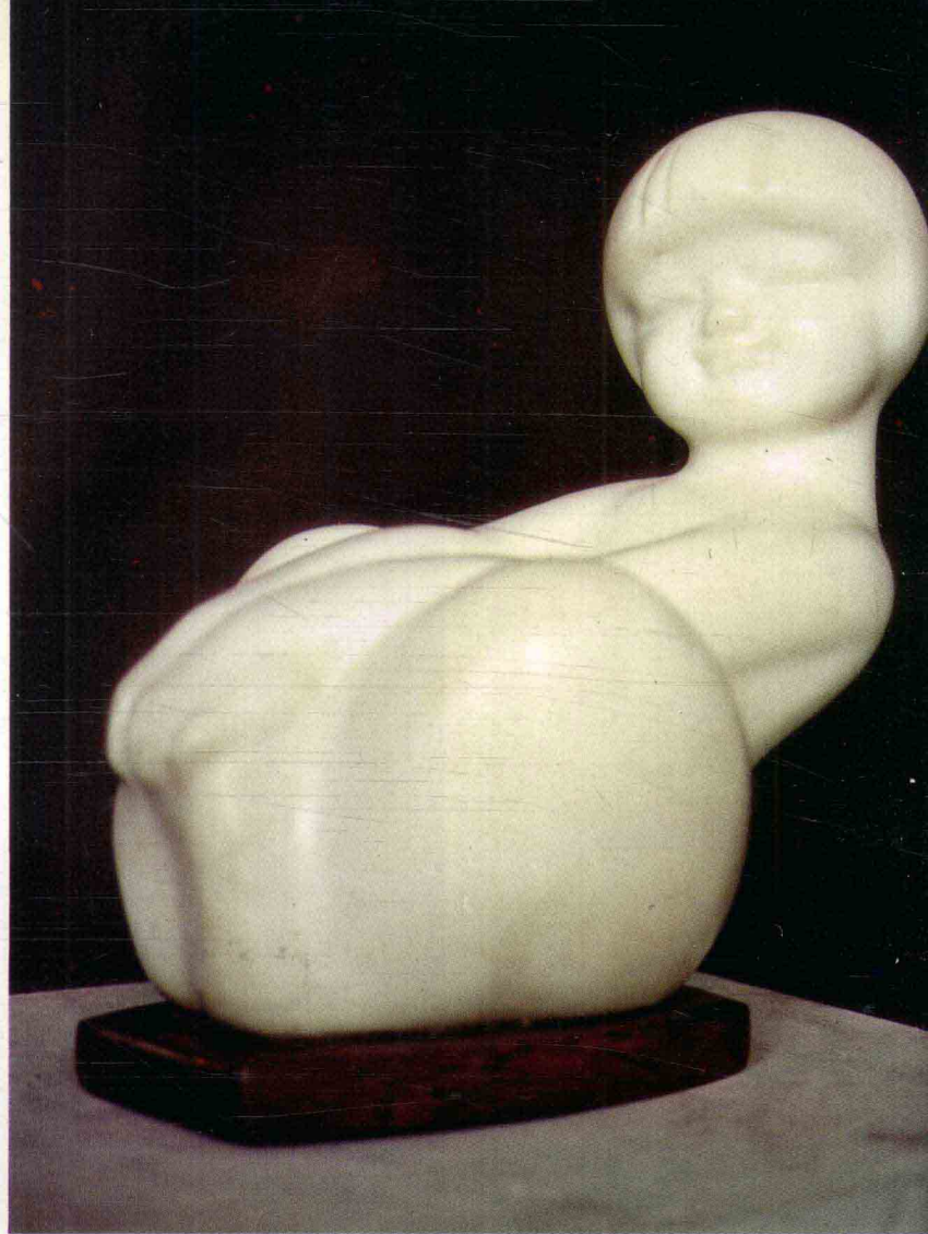
摇 1982年 高40厘米 汉白玉石