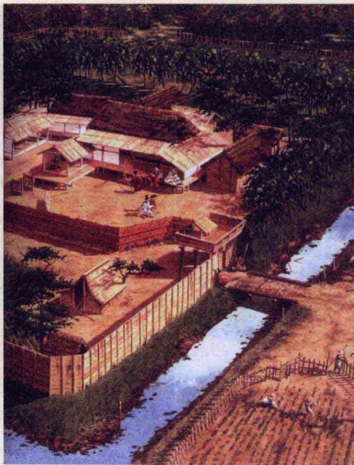
图4 早期武士庄园,庄园公领制为武士的产生奠定了经济基础

本形成,根据日本学者的研究,应在鸟羽院政时期(1129—1156年),即12世纪中叶。这样,从10世纪初到12世纪中叶,经过将近两个半世纪之久庄园制才基本形成。其原因就在于庄园是上述几种力量间反复斗争的结果。庄园与国司间的武装斗争,开始为小规模冲突,国司以武力强行进入庄园,庄园也以实力相对抗。后来发展到庄园豪族主动袭击国衙,现存的当时文书中常见“郎党”[图5]、“凶党”、“乱斗”、“乱治安”、“施加暴行”、“对捍宰吏”、“暴猛”等纪录。再进一步则双方请求军事贵族支援,并且由于军事贵族的介入而爆发大规模的地方叛乱,如“平将门之乱”。庄园与国司间的斗争虽然激烈复杂,反反复复,但基本态势是势均力敌,谁也不能吃掉谁,因此庄园与公领两种制度才得以并存。此其一。其二,双方的斗争已非经济和政治斗争形式所能解决。国司受中央贵族的压制,他可以向太政官申诉以对抗;中央贵族又是太政官的成员,可以使太政官的决定有利于自己。这样,各方都希望能找到并借助一种超出当时地方水平的有组织的强大武力,来达到自己的目的。这样,武士就应运而生。总而言之,庄园公领制与阶级阶层关系的多元多层化,既使得武士的出现成为必要,并且也提供了武士出现的经济基础——领主土地所有制。