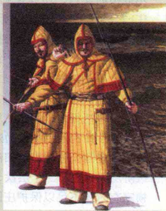
图2 奉行200年唐律的日本，武士也被引入，这是奈良时代的日本宫廷武士（非后世之武士）