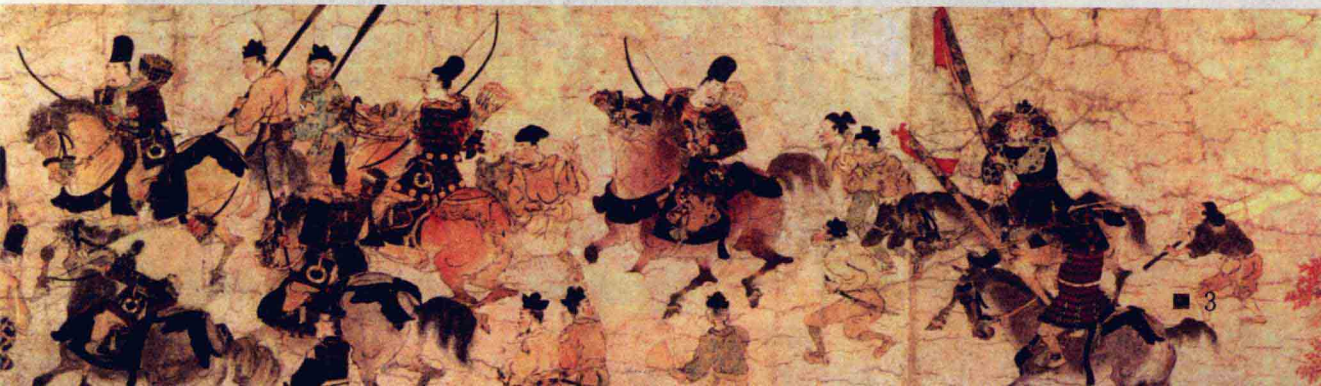
图5 郎党是早期具有宗法性质的地方武装团体,具备了武士的“侍”的原貌

“王朝国家”是日本学者广泛使用的概念,他们用这个概念来概括摄关政治和院政时期亦即庄园公领制形成过程中统治体制和方式的变化。过去,日本学者往往用“贵族政治”的概念与“律令国家”相区别,但是这似乎是两个不同范畴的概念,因为前者说明谁人统治,而后者则说明如何统治,不同范畴的概念显然不能比较。而且,“贵族政治”能否完全用于这两个历史时期也是疑问,院政时期就未必适用。当然,“王朝国家”的概念也并非完全没有问题,例如,这