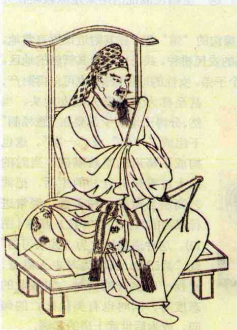
图11 武家之栋梁，第一个被授予征夷大將軍的坂田仲麻呂

居。人们可以通过交重税来免除兵役，这种主要由农民组成的士兵，在日本统称为防人〔图8〕。由于防人士兵的不正规性，而且又给农民带来了巨大的负担，在平安时代初期被恒武天皇所废止。这种形式的士兵并不是真正意义上的武士。