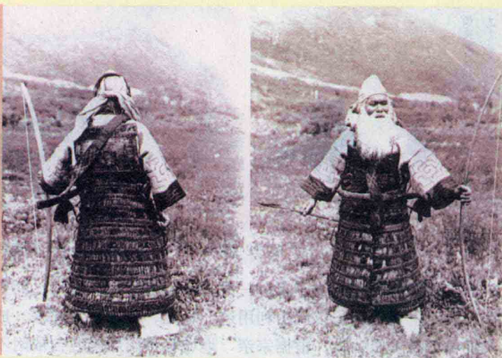
图10 虾夷武士，虾夷铠甲保持了早期日本铠甲许多唐土特征

居。人们可以通过交重税来免除兵役，这种主要由农民组成的士兵，在日本统称为防人〔图8〕。由于防人士兵的不正规性，而且又给农民带来了巨大的负担，在平安时代初期被恒武天皇所废止。这种形式的士兵并不是真正意义上的武士。