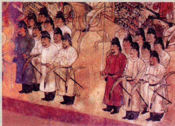
图1 唐朝宫廷卫士被命名为武士，“武士”第一次被正式应用为职务而非“身份特征”

武士作为科学研究的对象应该予以明确的定义。日本学者间有两种定义方法。一种从职能定义，例如：“以武艺为专业者”、“以武技、战斗为业者”，[图3]可以说是“杀人请负人”（杀人包干者），而武力的请负化是与当时王朝国家的基本统治原则“请负制”一致的。军制史则强调武士与地方政权相结合，构成军团制废除后的国衙军制的一部分。但是，武士不仅是一个职能集团，而且还是一个政治集团、社会集团。显然这种职能定义的方法不能全面反映武士的状况，因此都需要作补充说明。例如：“在封建时代作为支配者而发挥权势”、“后来成为身份阶层或其所属成员的称呼”。