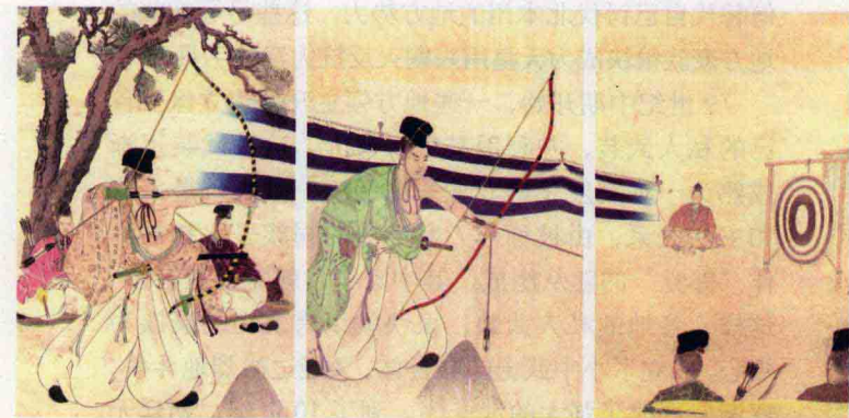
图 13 初步形成的武家尚武习俗

甚至称为女御家人或女地头。当然，分得土地的子弟要在“惣领制”下组成“一门”或“一家”。这也构成了幕府的军政基础。当时的武士过着极其俭朴的生活，把武艺高超当做是一种美德，经常进行艰苦的兵法（格斗技）修炼[图 13]。这种道德称之为“武家习俗”或“兵道”，表现为对主人献身，重视一门名誉的精神，知廉耻的态度等，同时也有美化死亡的倾向，成为后世武士道的起源。