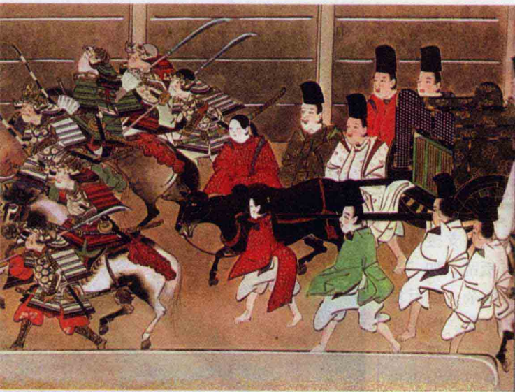
图6 10世纪开始摄关政治，迅猛崛起的武士阶层凌越公卿阶层