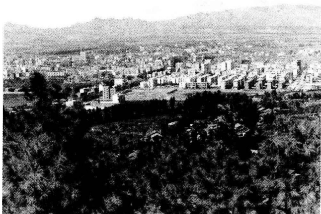
昭通城区

合部政治、经济、文化中心之一，是一个历史悠久、风景怡人的城市。从昭阳区出发，南至省会昆明 381 公里，北达四川省会成都 697 公里，北到重庆 609 公里，东至贵州省会贵阳 462 公里。