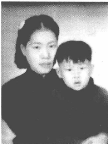
楼先生幼时与母亲的合影

承蒙先生厚爱，这些年能亲近先生，并得到先生的关心、帮助与提携，在内心中，我是把先生当成自己的导师看待，不仅是学问的导师，更是人格的导师。先生所学之广、所证之深，均非我能揣测，加之文字能力有限，这里只能以零散片段的形式，呈现出“冰山一角”了。