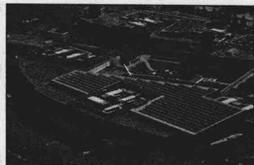
图 1-1 Googleplex

2001 年 9 月，Google 的网页评级机制——PageRank 被授予了美国专利。专利正式地被颁发给斯坦福大学，拉里·佩奇作为发明人列于文件中。