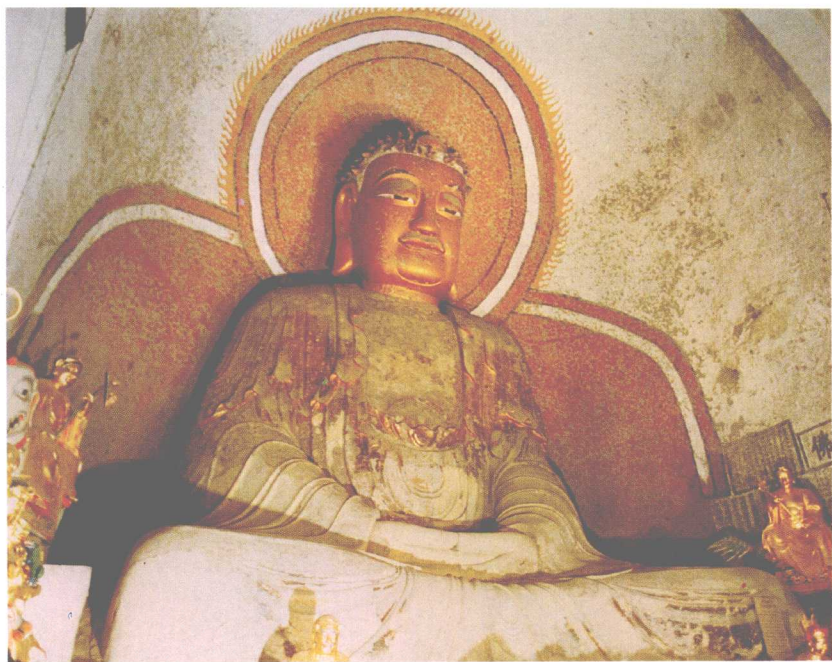
新昌大佛寺弥勒石佛