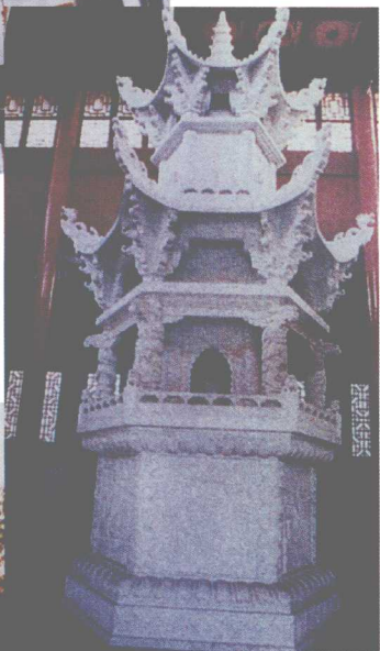
杭州净慈寺南屏晚钟（上左）