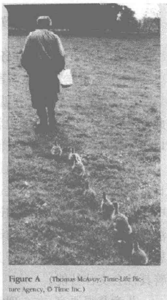
Figure A

以后人们把这种动物实验研究的结果应用到早期儿童发展的研究上,于是就提出了儿童各种心理发展的关键年龄问题。对于语言,有关研究认为2~3岁是儿童口头语言发展的关键期,4~5岁是儿童书面语言发展的关键期,这一时期婴幼儿的听觉和言语器官的发育逐渐完善,正确发出全部语音的条件已经具备,发音机制已经开始