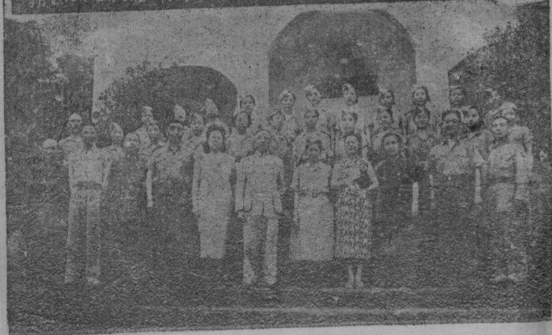
軍委會女幹部訓練班第一期官生聚餐留影紀念