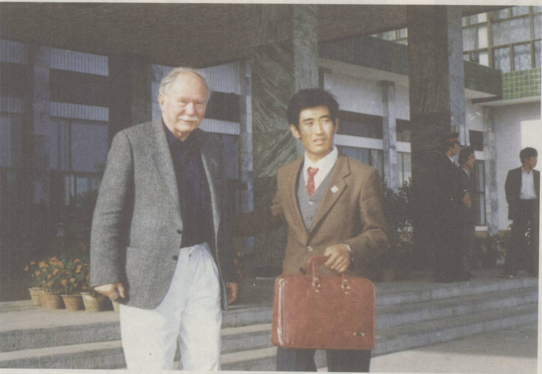
1986年海西希教授第一次来到呼和浩特市