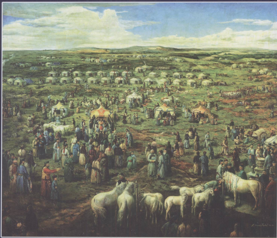
1909年成吉思汗八白宫春季大祭祀图