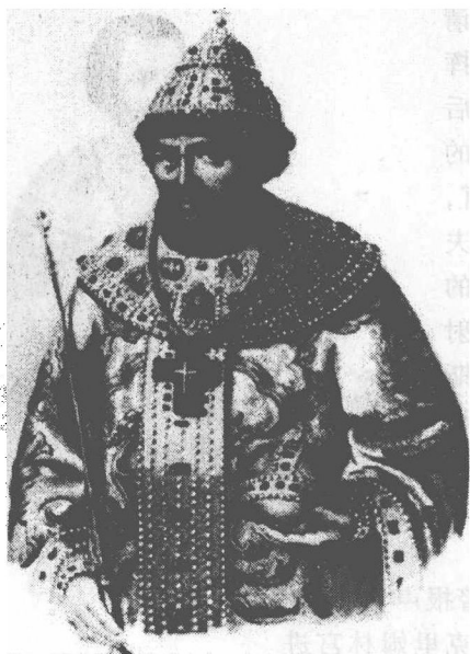
阿列克谢·米哈伊洛维奇

* 射击军 (стрелцы), 亦译“火枪军”。是俄国最早的装备了火器 (火绳枪) 的常备军, 由伊凡雷帝建立于1550年。射击军驻在大城市的特区里, 平时从事手工业, 经营小买卖。在17世纪90年代沙皇宫廷夺权斗争中, 射击军屡为索菲亚一派所利用, 并为彼得所深恶痛绝。1698年事件 (见本书《改革的开端》章) 后, 射击军被彼得残酷镇压和解散。