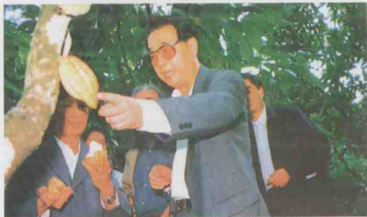
中共中央政治局常委、全国人大委员长李鹏于1990年12月22日到兴隆可可园视察。(选登)