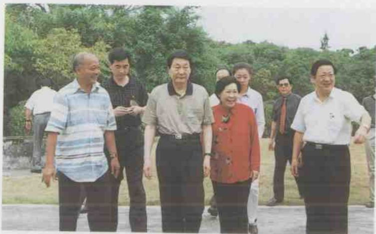
中共中央政治局常委、国务院总理朱镕基于2002年4月11日在海南省委书记白克明(右一)陪同下到兴隆热带花园视察。