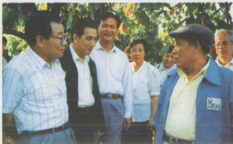
中共中央政治局常委、全国政协主席李瑞环 于1991年2月18日到兴隆视察。(选登)