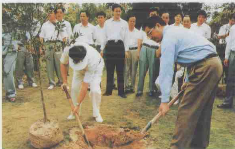
中共中央政治局常委、国家副主席胡锦涛于 1996年3月到兴隆热带花园视察。(选登)