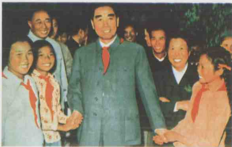
周恩来同志于1960年到兴隆视察，和少先队员一起合影。(选登)