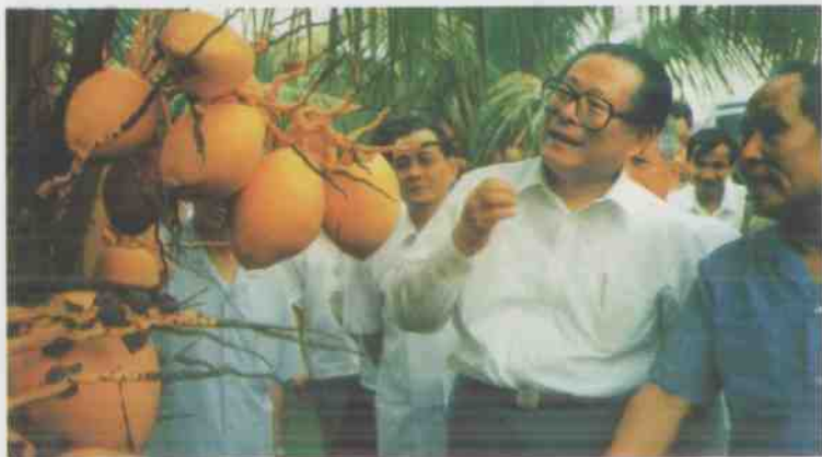
中共中央总书记、国家主席江泽民于1990年5月13日到兴隆视察椰子生产基地。(选登)