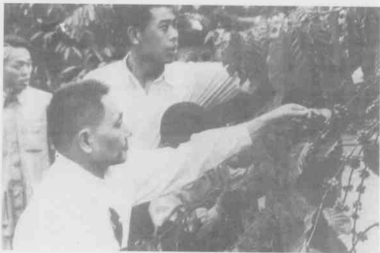
邓小平同志于1961年到兴隆视察咖啡生产。(选登)