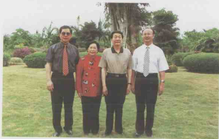
2002年4月,国务院总理朱镕基和夫人在万宁市委书记丁尚清(右一)、市长张志平(左一)陪同下,视察兴隆热带花园。