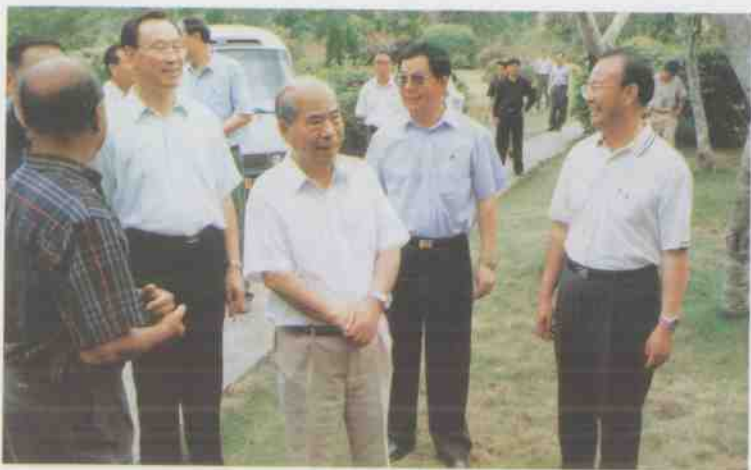
中共中央政治局常委、中纪委书记尉建行于 2001年3月24日到兴隆热带花园视察。(选登)