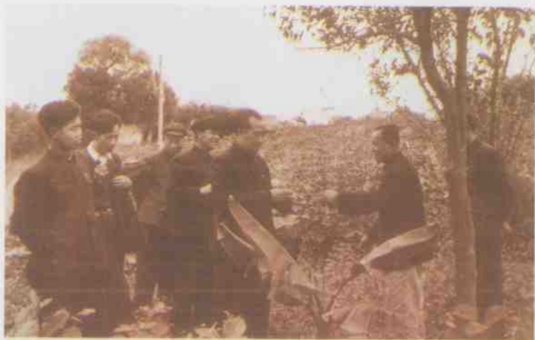
朱德同志于1957年11月到兴隆视察。(选登)