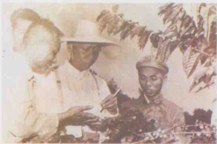
刘少奇同志于1959年11月到兴隆视察咖啡生产。(选登)