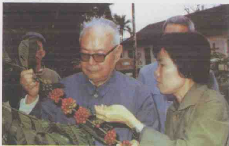
叶剑英同志于1979年1月到兴隆视察咖啡生产。(选登)