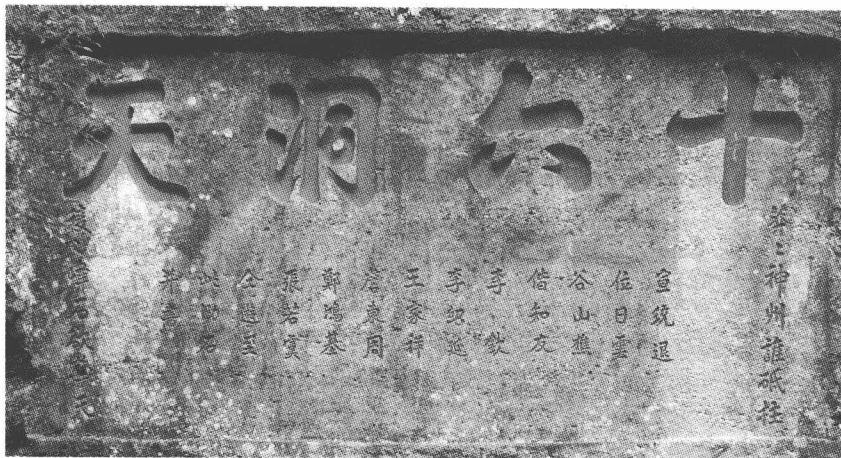
位于天游峰的摩崖石刻

1. 唐孙樵的《送茶与焦刑部书》 ① ，写到赠送武夷之茶。孙樵，字可之，关东人。笃于学，工散文。唐宣宗大中九年（855年）登进士第，授职方员外郎、上柱国。这位监管国家勘界、绘制地图的官员，当是来到南方武夷山品饮武夷茶后，深深感到武夷茶的优异和珍贵，因此将之送与尊贵的焦刑部（编者注：志上说孙于806—820年元和年间送茶，若按孙高中进士的时间来看，时间似有误），并附有一札短言，写道：“晚甘侯十五人，遣侍斋阁。此徒皆请（编者注：不少书本写为‘乘’字，系误）雷雨摘，拜水而和。盖建阳丹山碧水之乡，月涧云龕之品，慎勿贱用之！”在这里，擅长文学的孙樵把武夷茶拟人化为尊贵的晚甘侯；把回甘快捷持久、滋味醇厚，喻为保持晚节；把在春天采制茶叶，比喻为请雷公采摘，拜用天水而搅和；把生长茶叶的武夷山峰岩誉为“月涧云龕”。丹山碧水或为碧水丹山，系南朝著名文学家江淹在任吴兴县（今福建浦城）令时，游览武夷山后对武夷山的赞美之词，被后人广为沿用，成了武夷山的代称。孙樵将武夷丹山碧水写为建阳属地，是因为当时尚未建立崇安县，此地归建阳县管辖。这是武夷茶最早的拟人化名称，广为后人所引用。孙樵此文被曾任兵部、吏部侍郎，兵部、刑部、户部尚书和翰林承旨的文学家、书画家的宋代陶谷收入其所编著的《清异录》。清人蒋蘅也以此茶名撰写了《晚甘侯传》，高度赞赏武夷茶。据载，武夷山