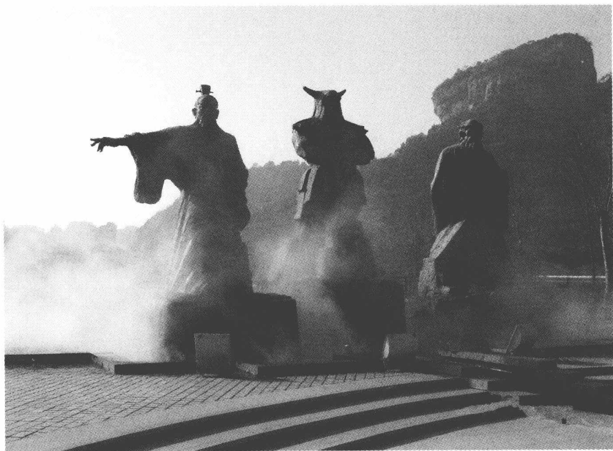
中华武夷茶博园中的雕塑

种茶、制茶人说茶、写茶，作家种茶、制茶。专业不精，文辞欠美。《武夷茶说》只是一本茶文化读物。