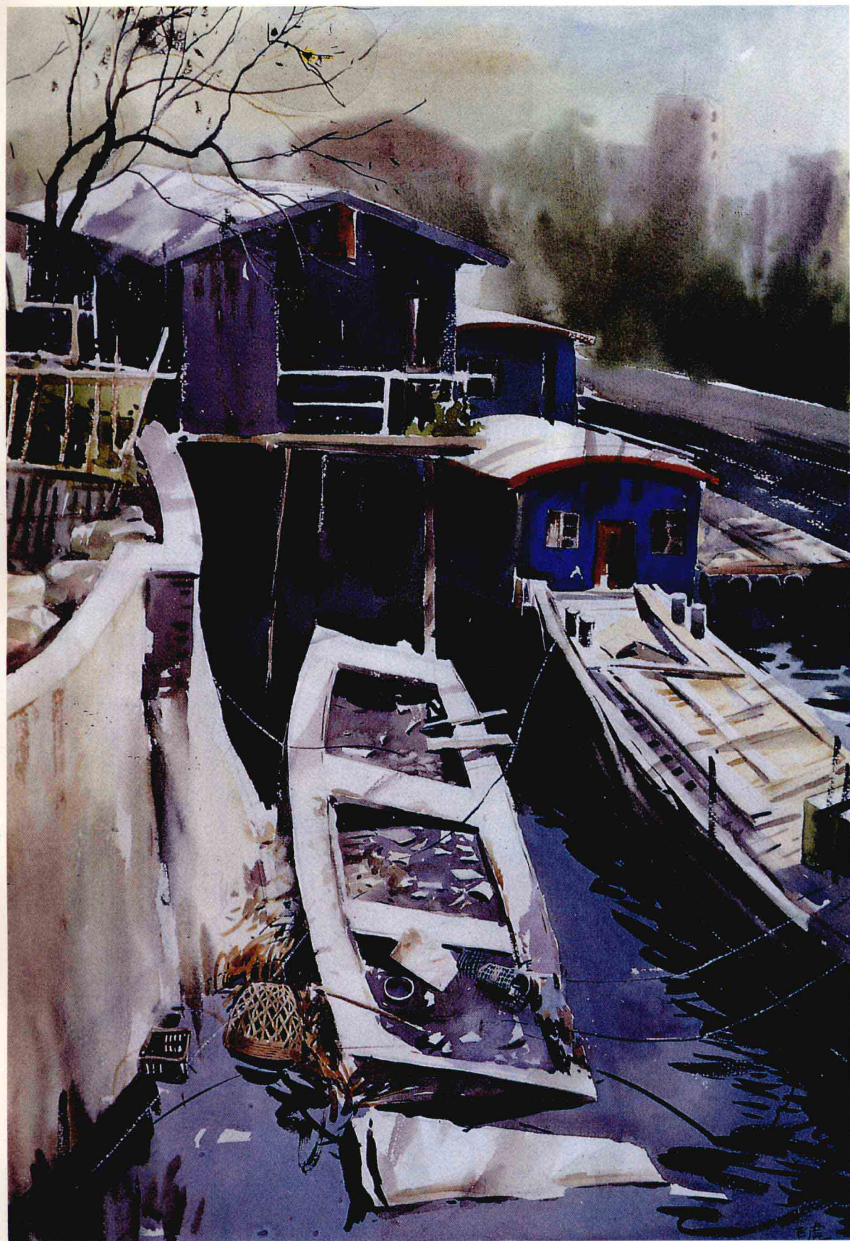
图 1 城外有条河 A River Outside the City 79 × 54cm 1992