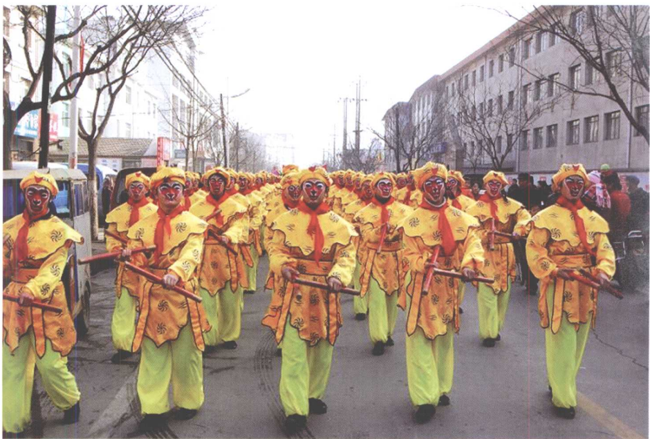
河北省首批非物质文化遗产——猴打棒