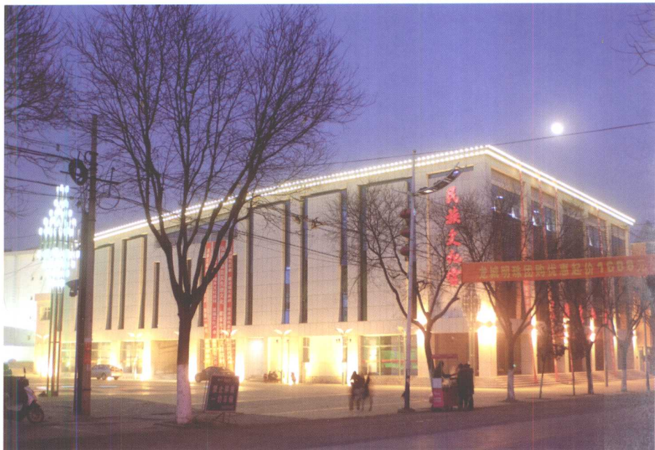
青龙县民族文化宫