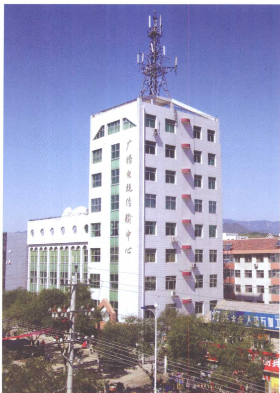
青龙县广播电视传输中心