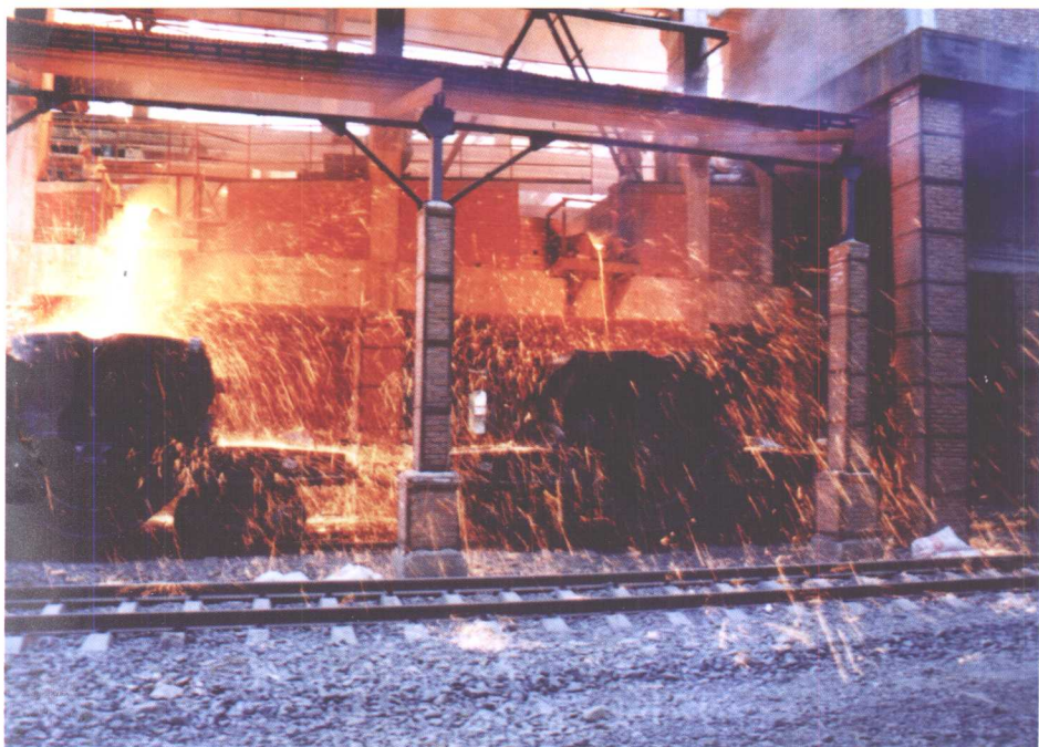
庙沟铁矿炼铁车间