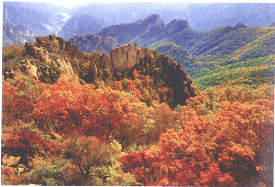
祖山秋色