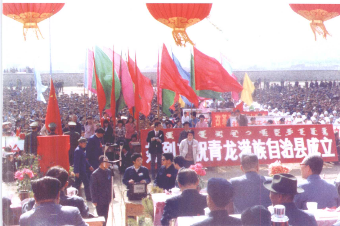
青龙满族自治县成立大会庆典