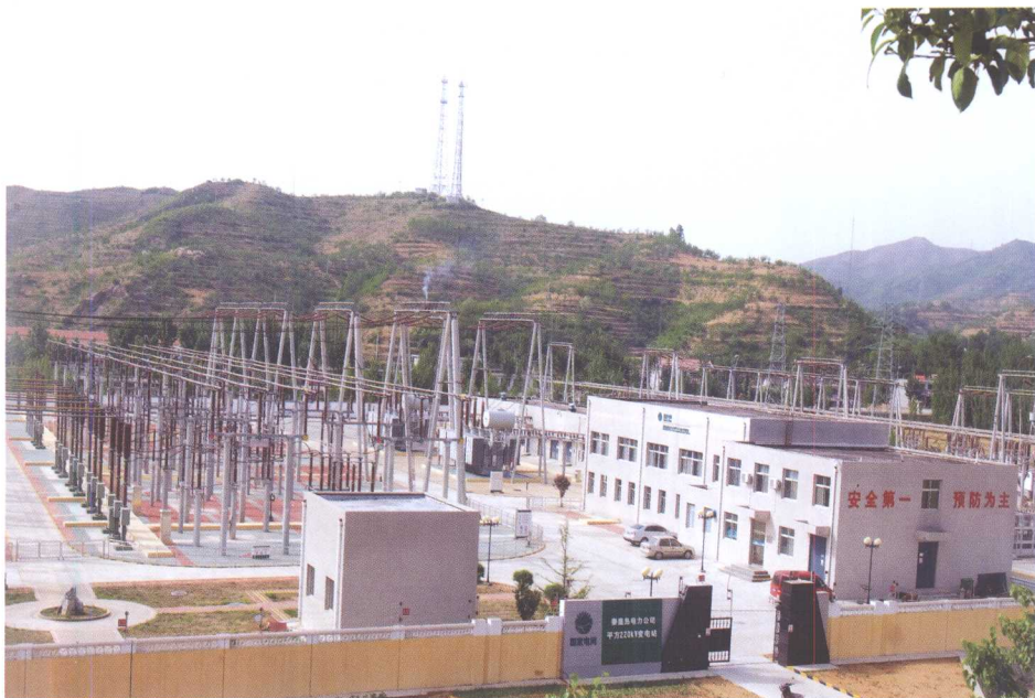
平方子 220 千伏变电站