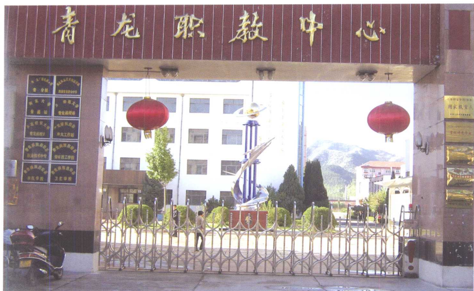
青龙职教中心