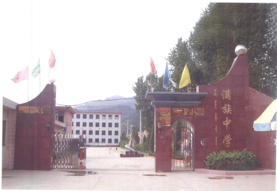
青龙县满族中学