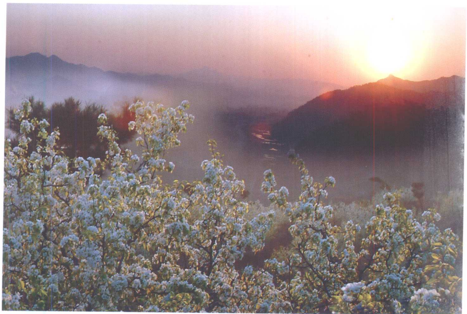
青龙县南山公园晨景