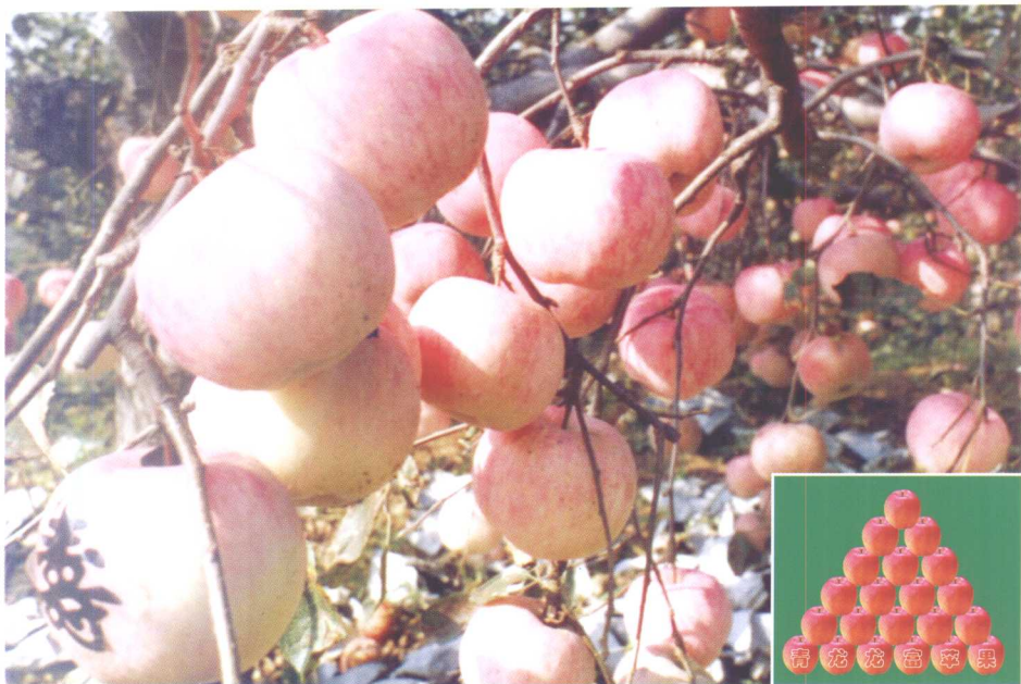
龙富苹果