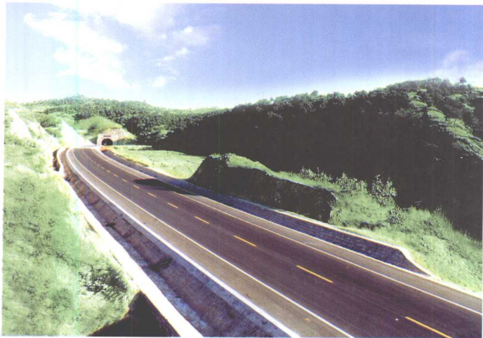
承秦出海及村村通公路