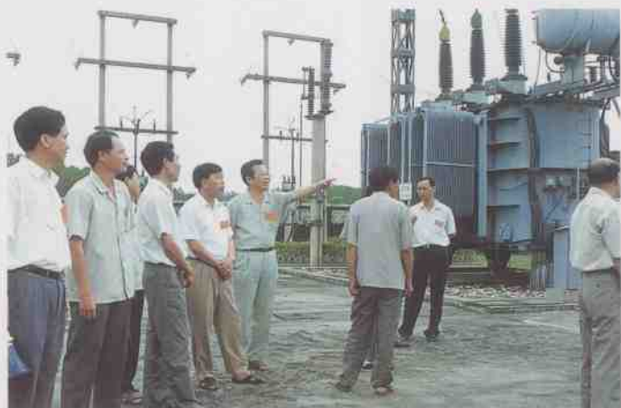
市党、政主要领导视察新建的 11 万伏输变电站