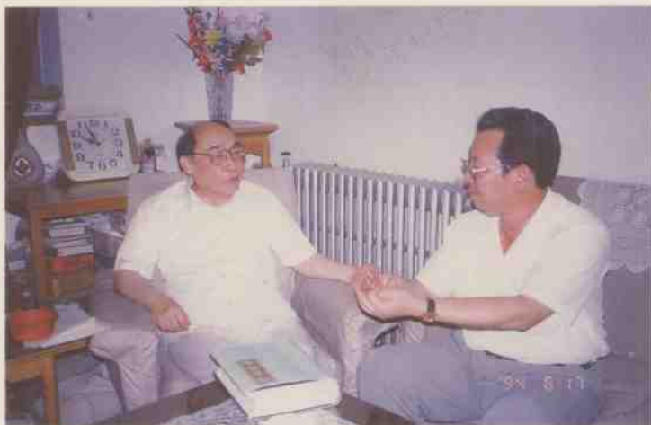
国家计委副主任甘子玉（左）听取 市委书记黄福春汇报工作