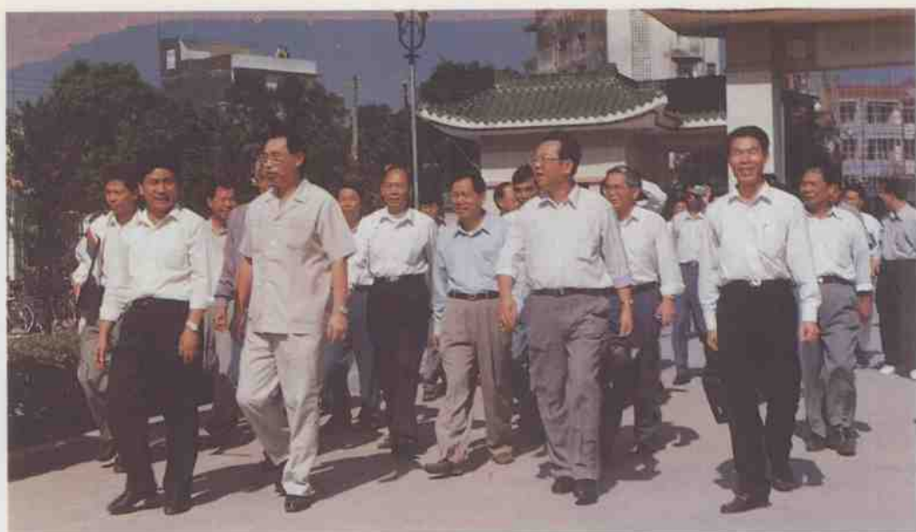
广东省省长朱森林（左二）在市委书记黄福春（右二）、市长陈自昌（右一）等陪同下在信宜中学视察