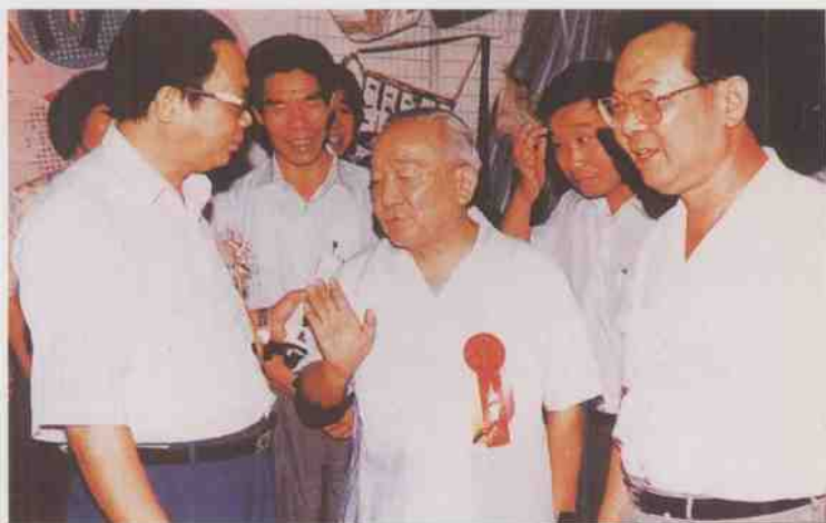
原广东省省长刘田夫（中）在茂名市副市长吴寿炎（左一）、信宜市委书记黄福春（右一）、市长陈自昌（左二）等陪同下参观信宜名优产品展览