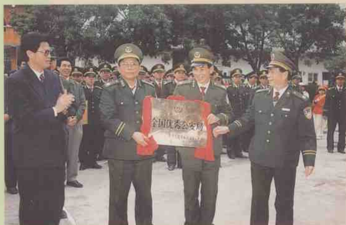
1992~1995年，信宜市公安局连续四年被评为“全国优秀公安局”。

新编《信宜县志》荣获全国地方志奖二等奖，广东省新编志书优秀成果奖，茂名市首届新闻出版成果一等奖，茂名市第四届社会科学优秀成果一等奖，茂名市历史学会优秀成果一等奖。