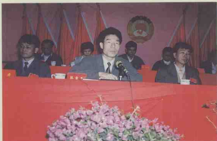
市长陈自昌在市五届政协会议上作重要讲话