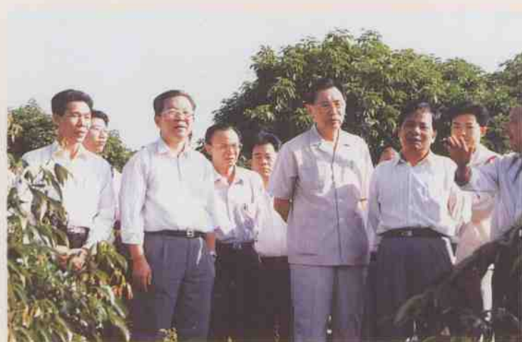
1995年，广东省省长朱森林（前排左四）在茂名市市长张惠忠（前排左五）、市委书记黄福春（前排左二）、市长陈自昌（前排左一）等陪同下视察百鸟塘果场。