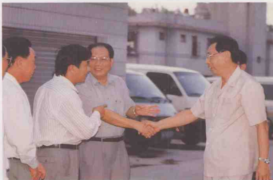
广东省省长朱森林（右一）在茂名市副市长吴寿炎（左三），信宜市委副书记、政协主席阮康佑（左一），常务副市长甘达文等陪同下在信宜视察。