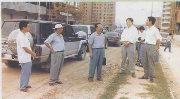
广东省交通厅厅长牛和恩（右二）视察 207 国道信宜路段一级公路扩改工程