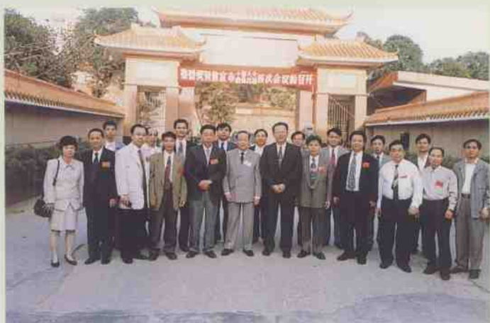
中共信宜市委书记黄福春，市委副书记、政协主席阮康佑等领导与港澳政协委员合影。