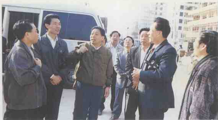
市长陈自昌，市委副书记、政协主席阮康佑，市人大主任彭传荣等陪同中共茂名市委书记肖贤成视察信宜邮电大厦建设工地。