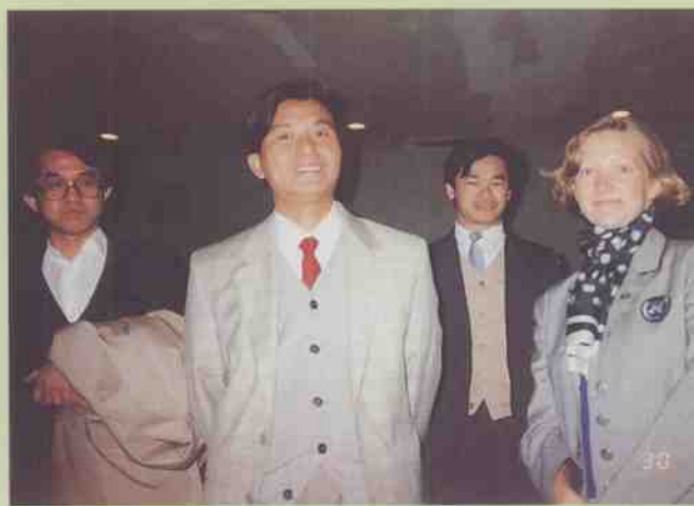
常务副市长甘达文(左二)与翻译(右一)在联合国安理会会场