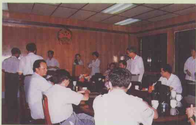
市人大常委会举行全体会议，表决人事任免事项。