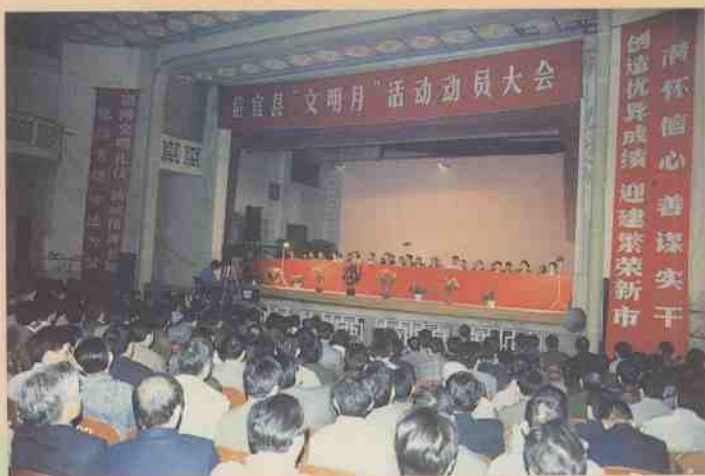
信宜县“文明月”活动动员大会会场