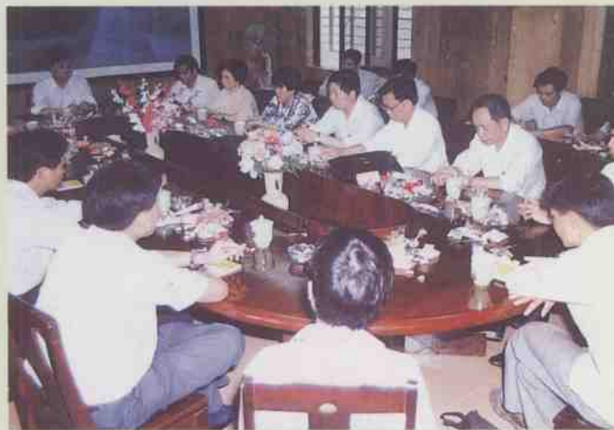
市政协非公有制企业挂钩联系户座谈会