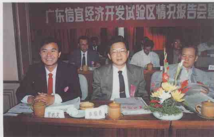
市经济开发试验区情况报告会暨广州粤信大厦开业典礼