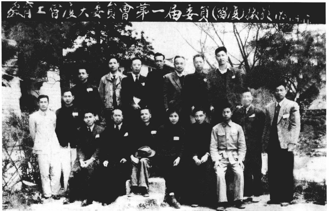
厦门大学工会第一届委员会在厦委员合影 1951年4月19日