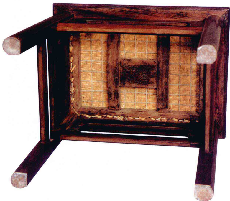
黄花梨无束腰长方凳成对