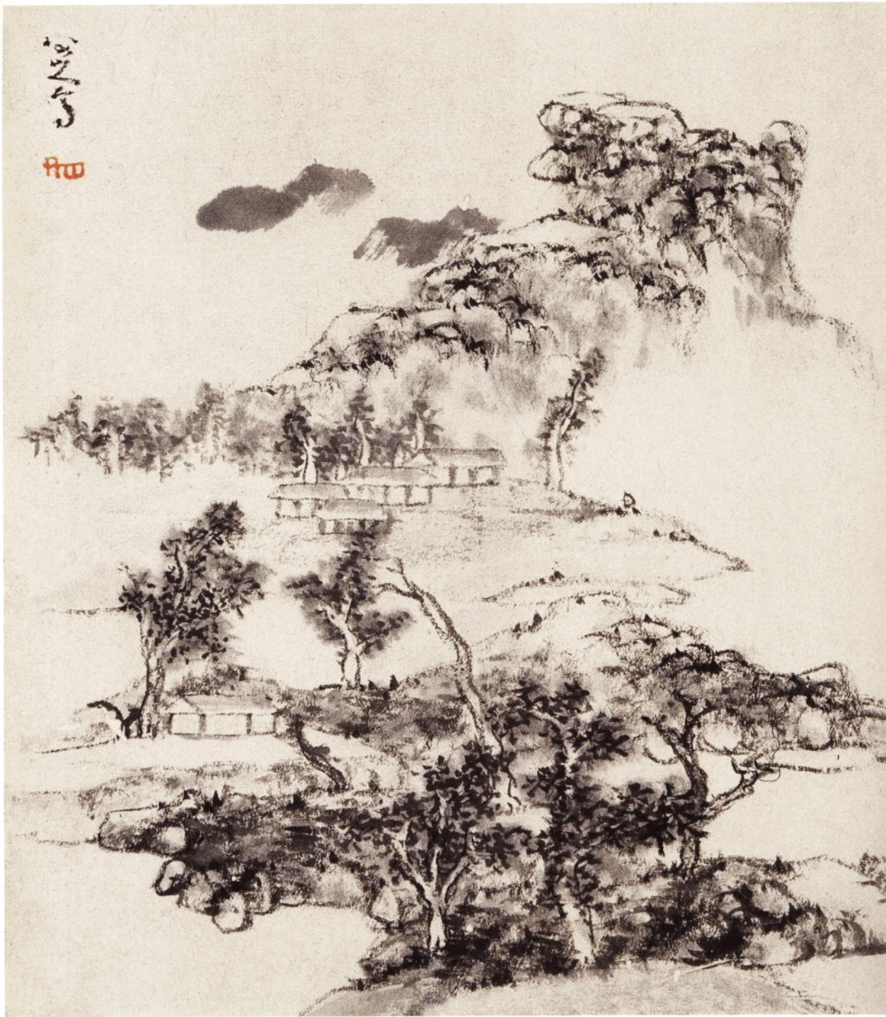
书画册 之一 山水 纸本墨笔 纵 26.5 厘米 横 23 厘米 浙江杭州西泠印社藏