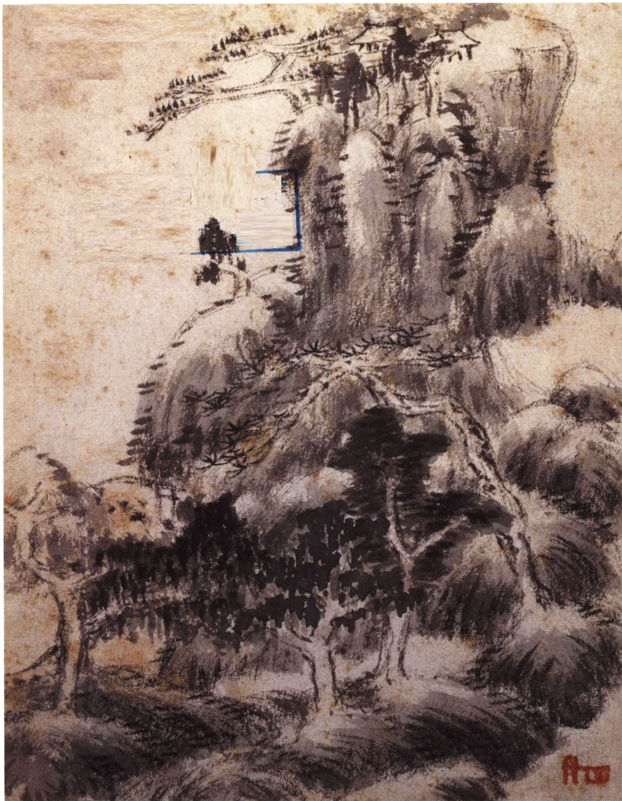
墨笔杂画册 之一 山水 纸本墨笔 纵 24.4 厘米 横 23 厘米不等 北京故宫博物院藏