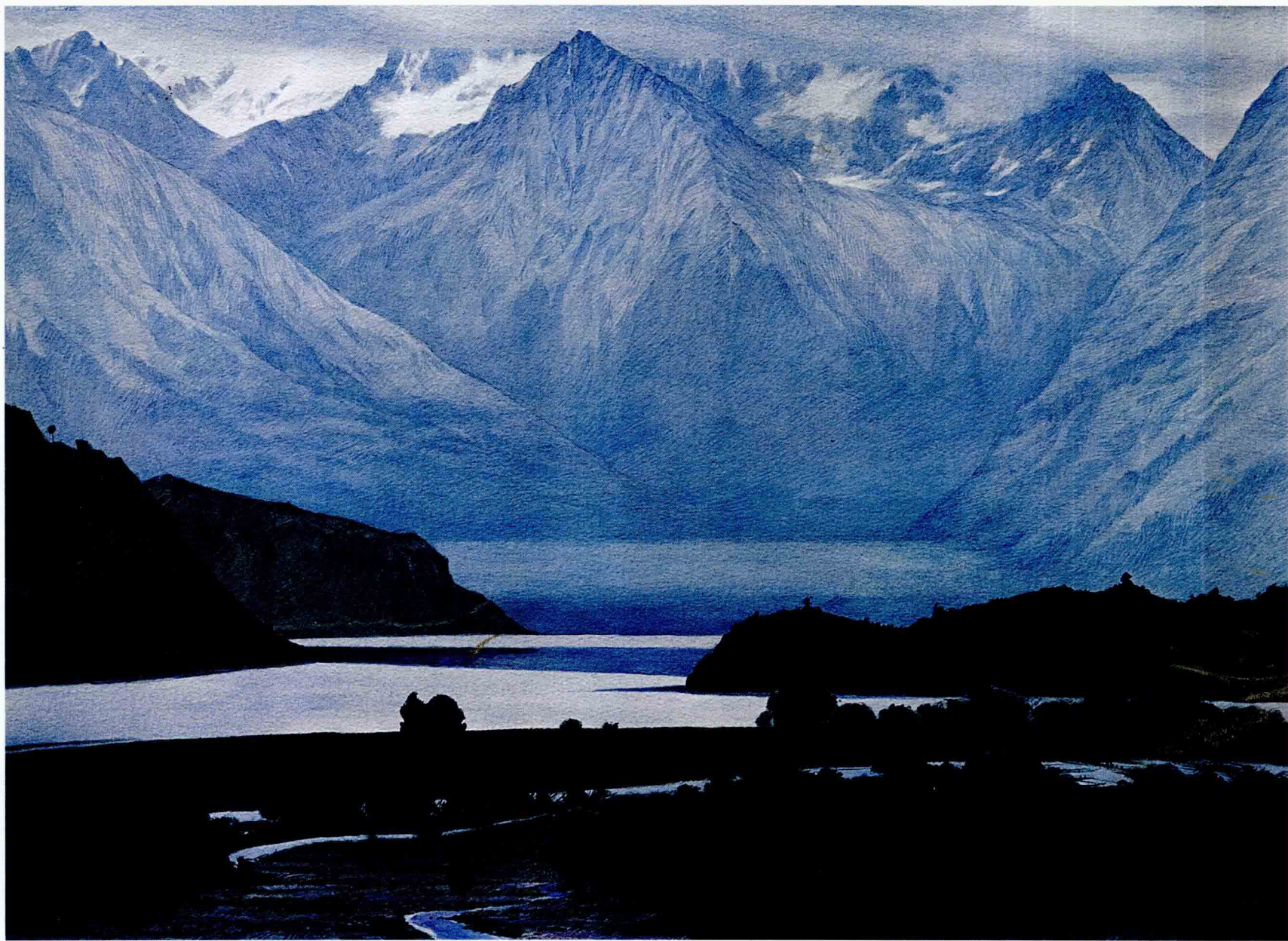
梦回然乌湖 2004年 76cm × 56cm

海拔 3900 米的然乌湖镶嵌在群峰峻岭之间。2001 年 7 月 24 日驻然乌兵站，享湖水甘甜。