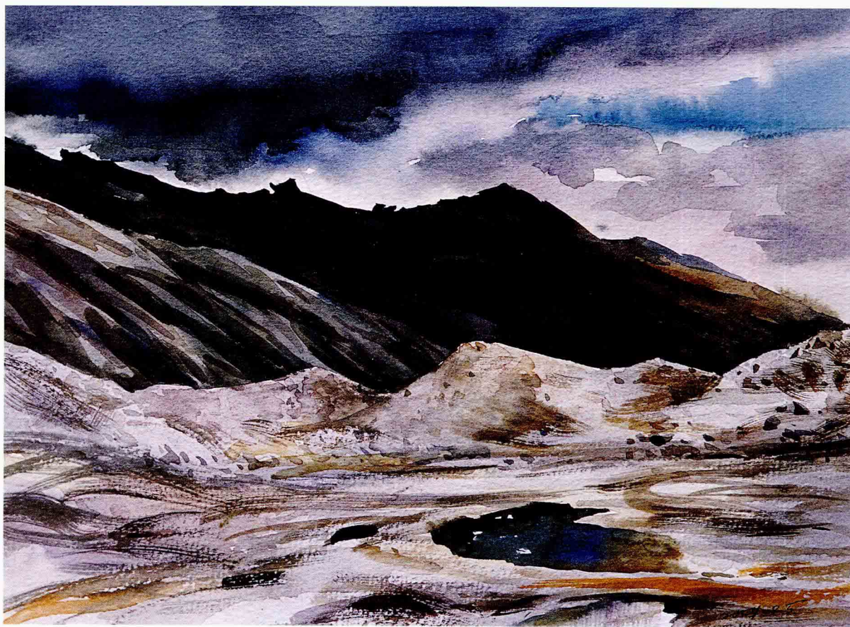
天低云浓 2001年 38cm × 28cm