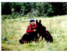
翠绿的鲁朗——雅鲁藏布江边的绿宝石，来了还想再来的地方。