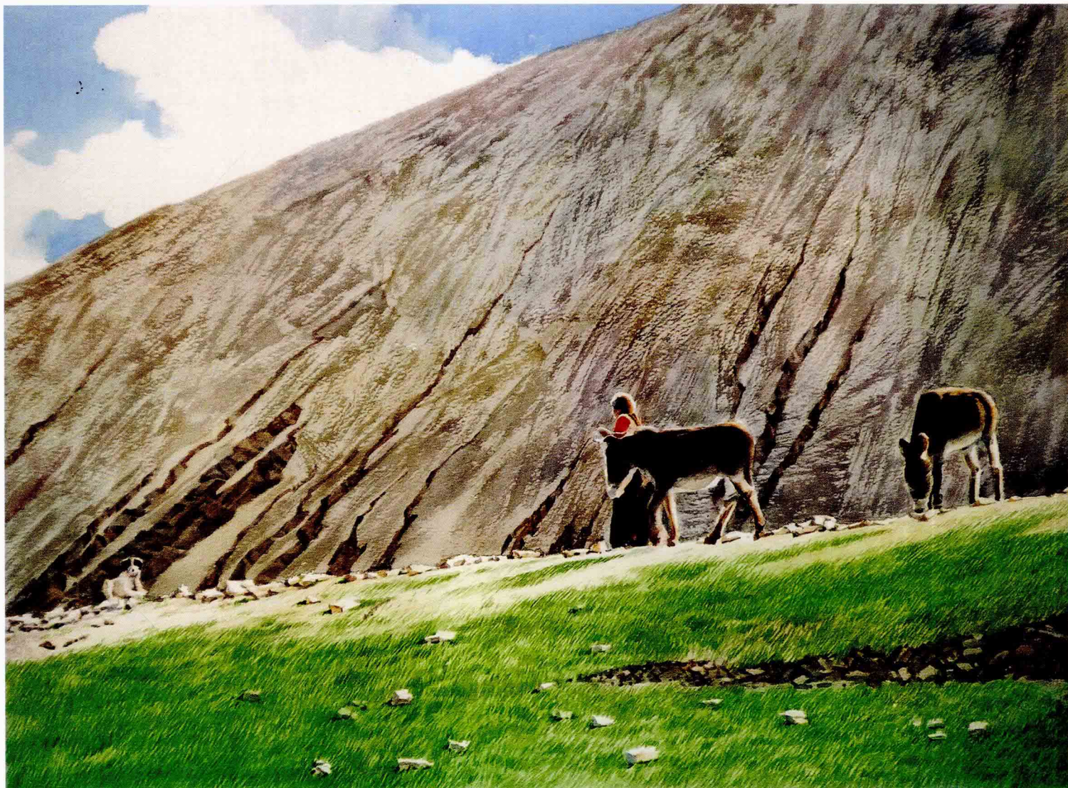
高山白云驴行 2004年 76cm × 56cm

停车珠峰景区大门，望前后道路千难万险，看旁边妇女悠然牵驴。7点了，翻越5000米高山今夜要住扎西宗。