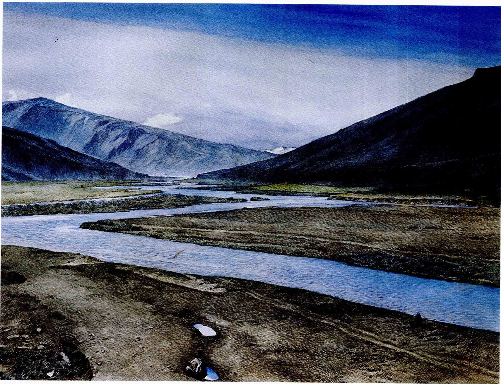
静静的邦达河 2007年 76cm × 56cm