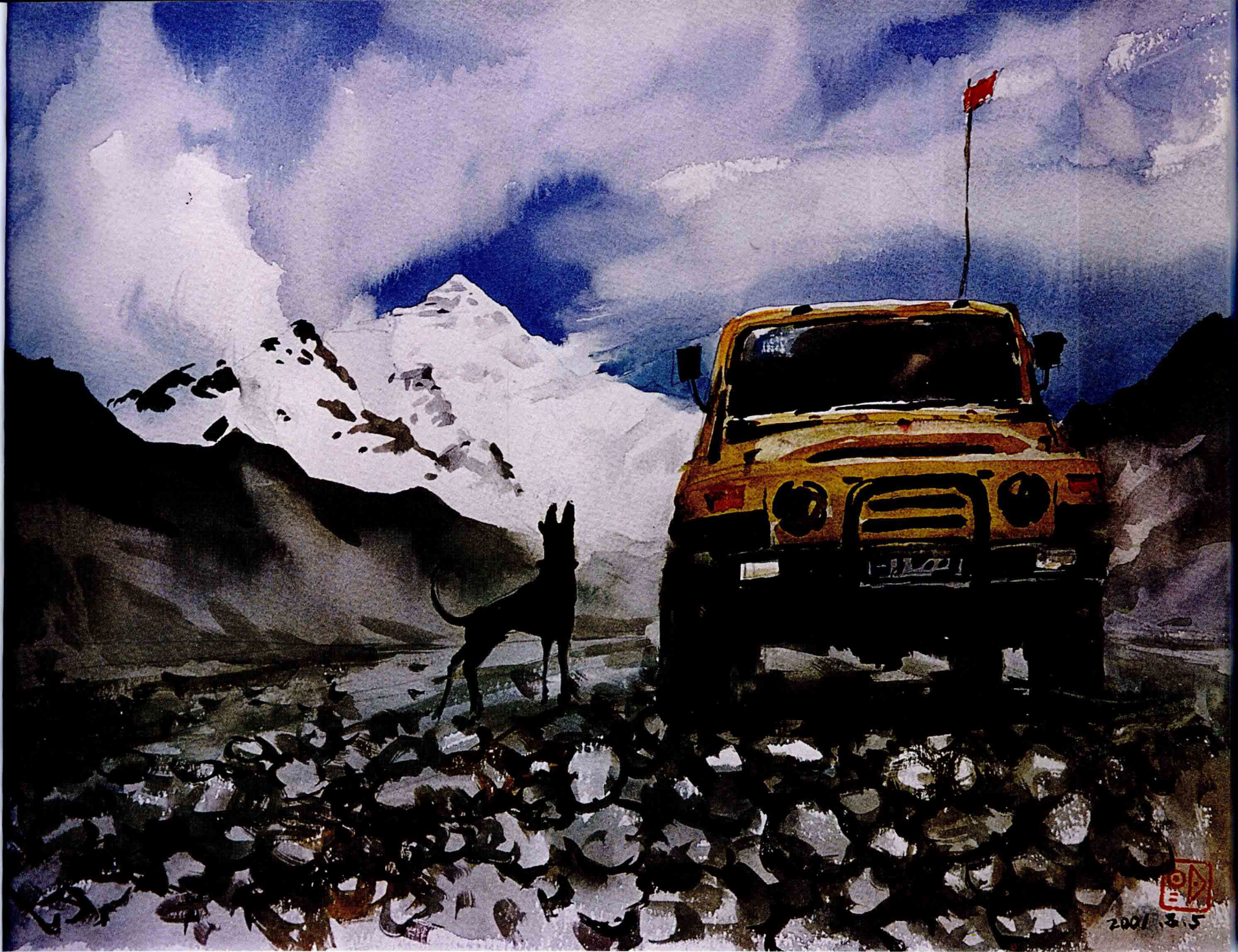
仰望珠峰旗云 2001年 38cm × 28cm