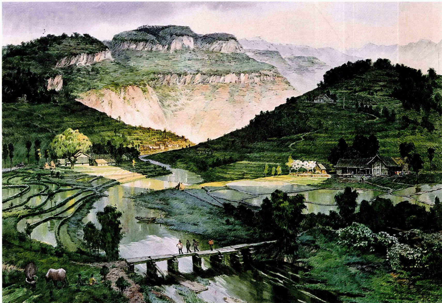
山乡 1998年 80cm × 55cm