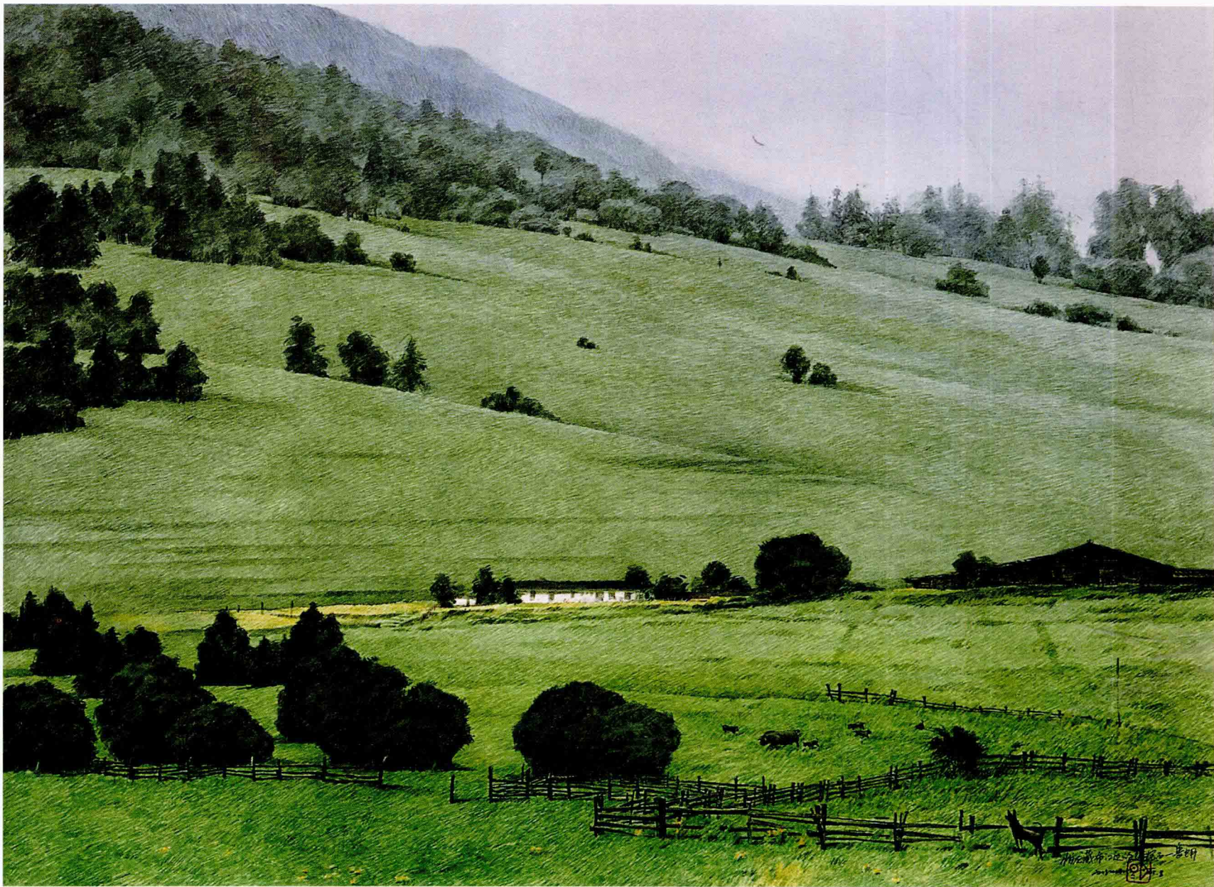
怀念翠绿鲁朗 2005年 76cm × 56cm