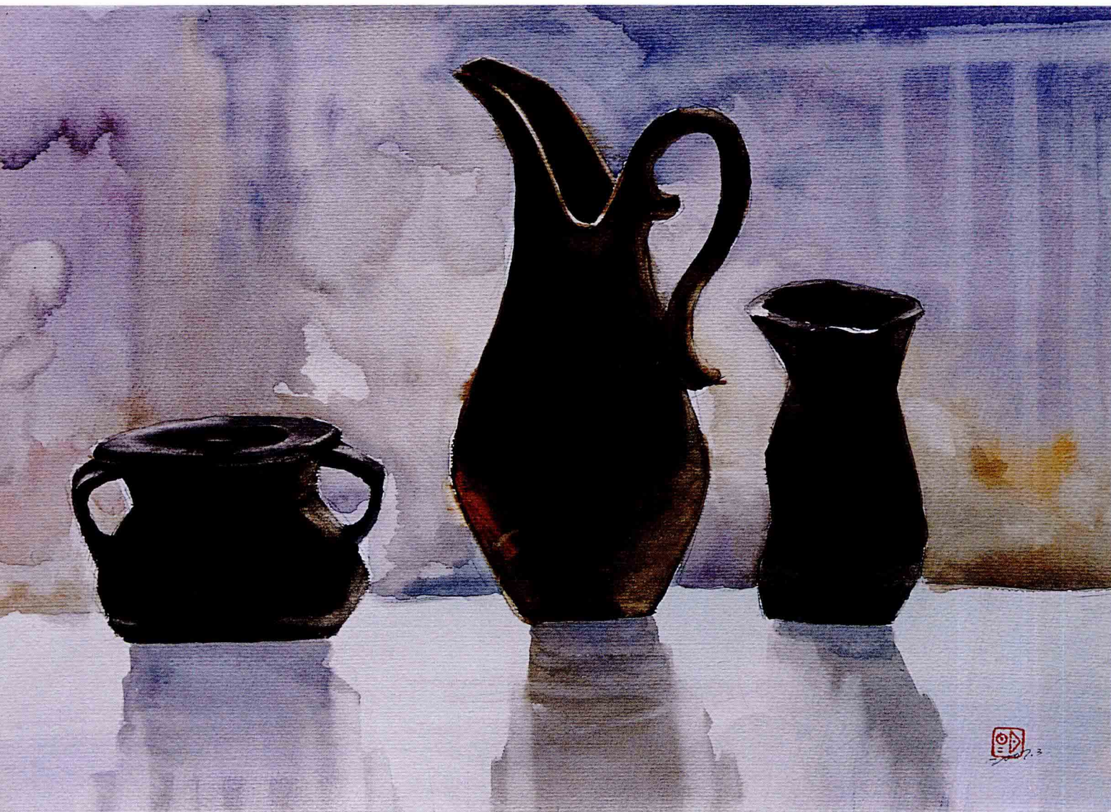
自然形态 2007年 55cm × 40cm