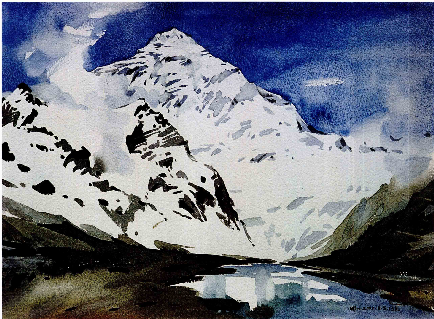
走近珠穆朗玛 2001年 38cm × 28cm