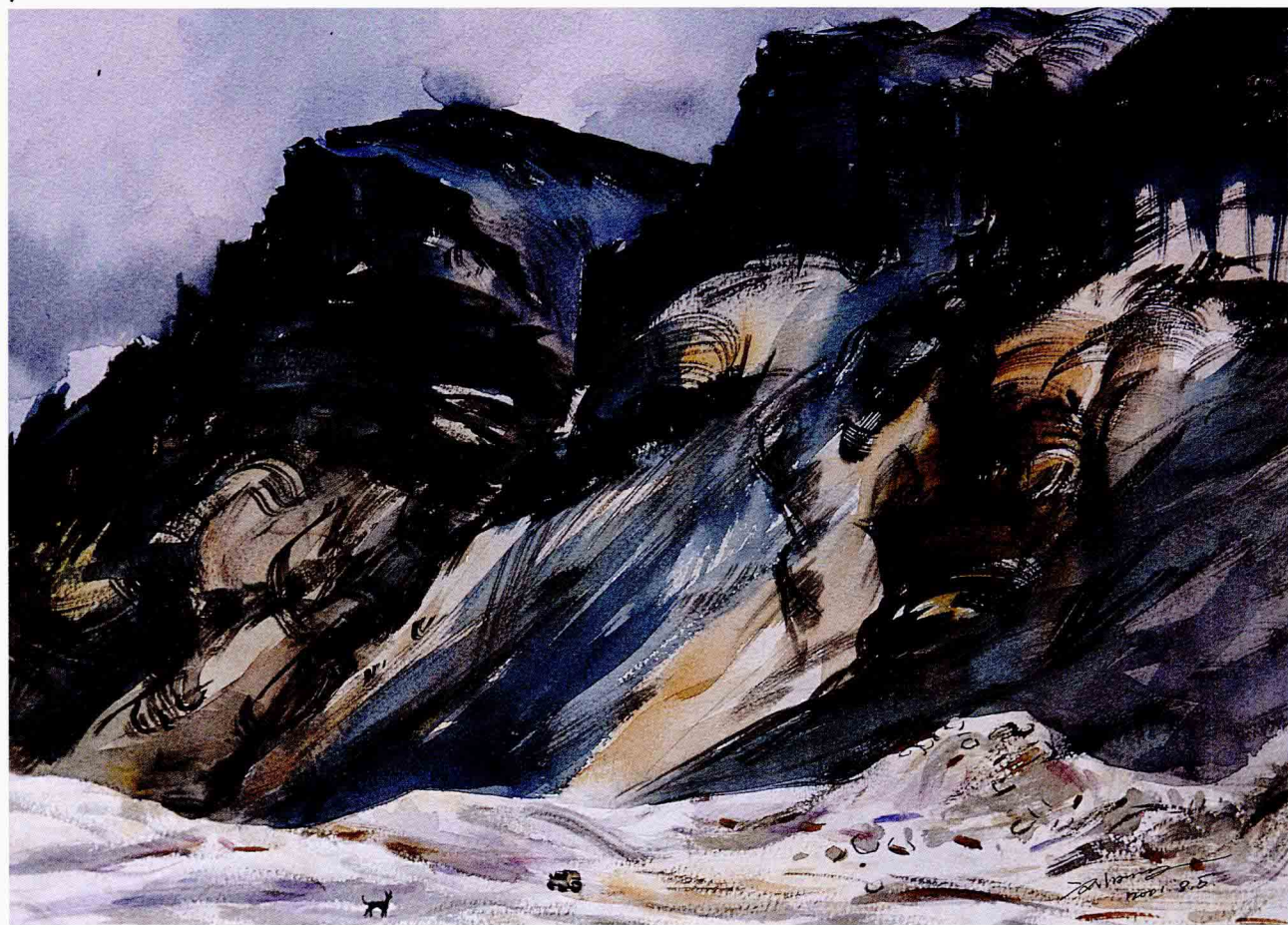
山陡声寂 2001年 38cm × 28cm