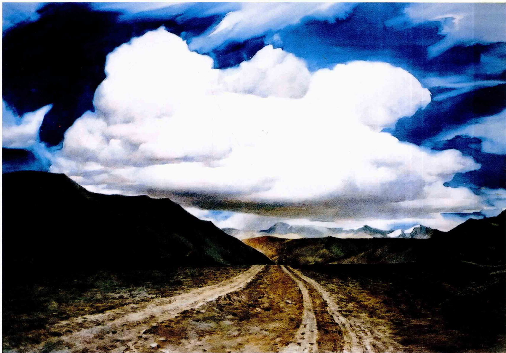
漫步喜马拉雅 2001年 102cm × 70cm

读万卷书，行万里路，走最险的道，爬最高的山，画一生的画。2001年夏天，一路狂奔的记忆。