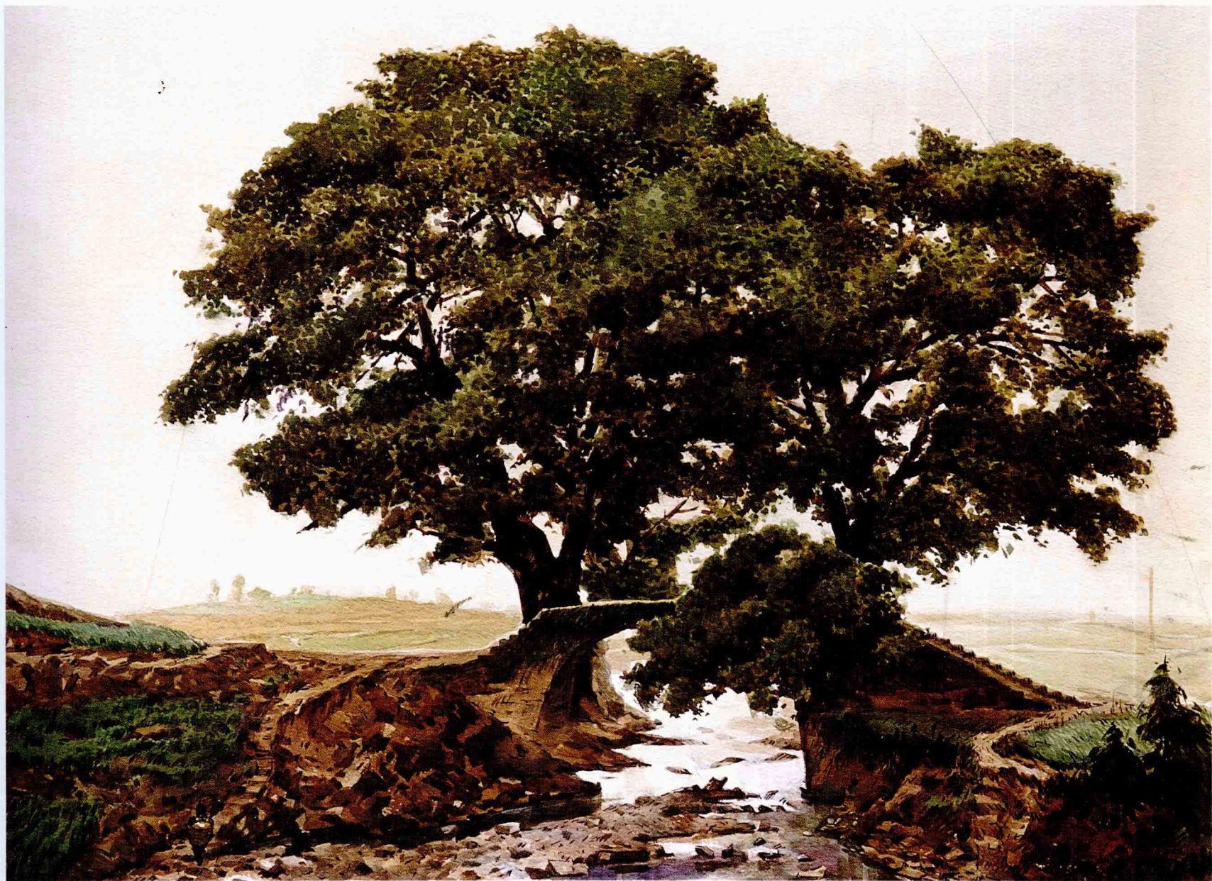
蜀道 1995年 76cm × 56cm