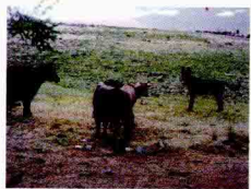
山高、天低、水急，川藏公路顺流而上，静寂而空灵。