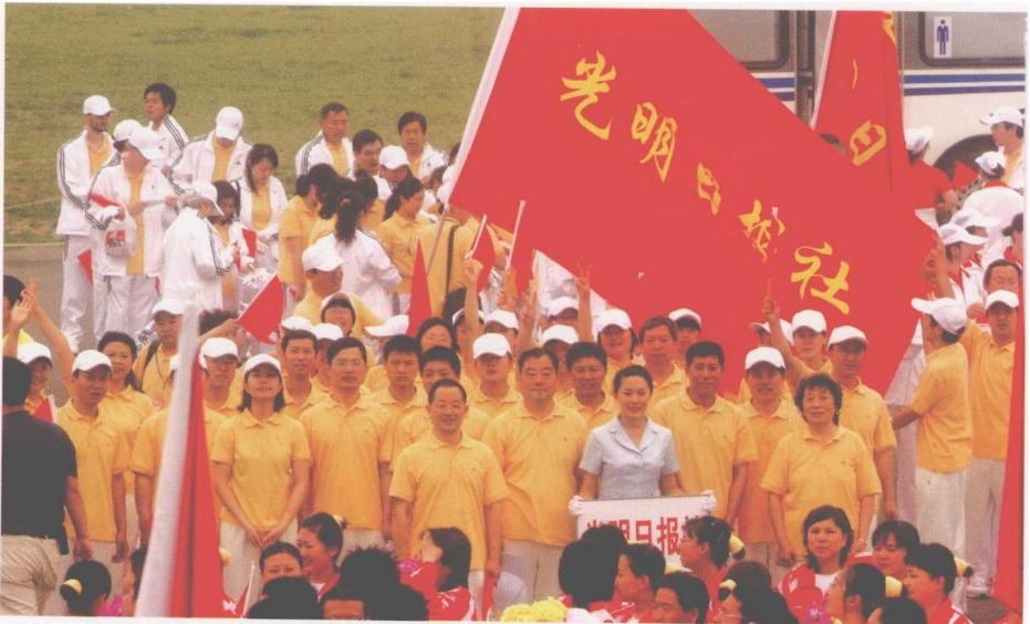
2007年6月2日，光明日报组成代表队参加中直机关第七届运动会。报社共有149人参加此次活动，其中80余人参加了比赛。