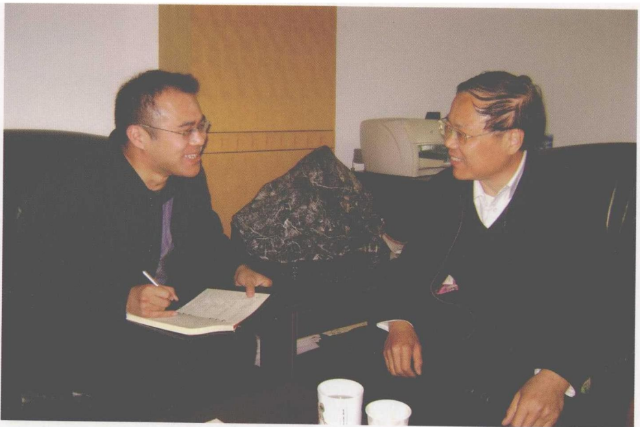
在贯彻落实十七大精神主题采访中，本报记者李可在江苏采访江苏省社科院院长宋林飞。