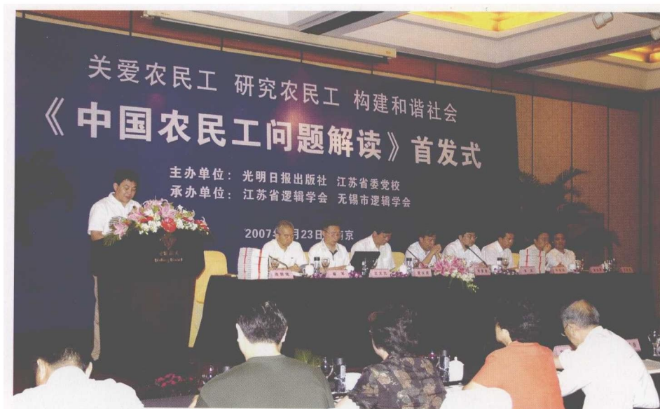
“光明学术文库”是被列入《“十一五”国家重点图书出版规划》的大型学术著作出版工程。图为学术文库新书首发式。