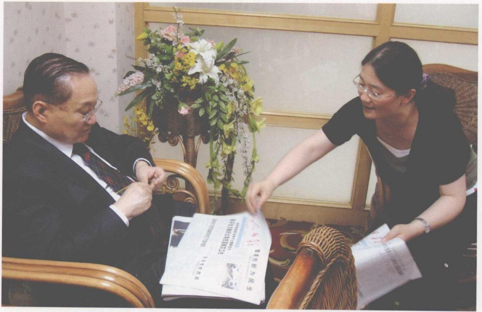
2007年6月18日，本报记者王庆环采访香港著名作家金庸。