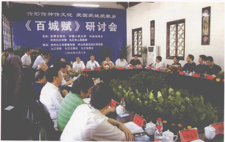
2007年7月8日，本报和中国人民大学、中央电视台、九江市委市政府在江西九江白鹿洞书院联合主办“百城赋”研讨会。