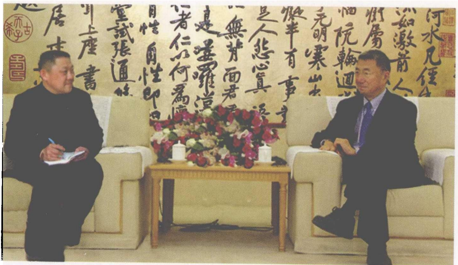
2007年初,本报记者郑晋鸣采访著名物理学家、诺贝尔奖获得者丁肇中。