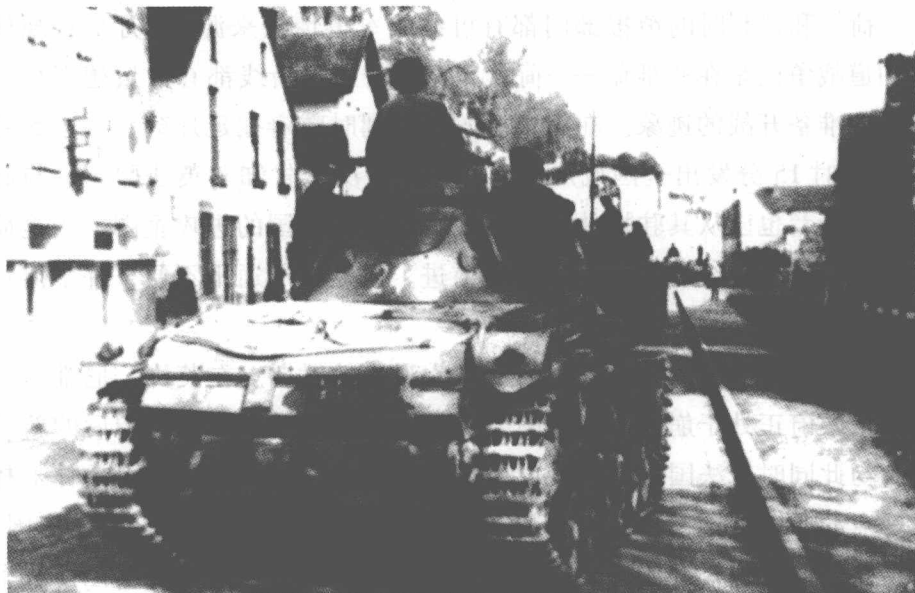
这是一辆法军的“夏尔”B1重型坦克。

1940年5月第一个周末之前，盟国情报部门报告说德国最近可能会向西进攻。由于此前数月已有类似的报告，所以盟军指挥官们并未太在意这些新情报（如果空中侦察好一些的话，就会发现在德国边境后方已集结了大批德军部队）。实际上，一名法国轰炸机飞行员在执行夜间飞行任务（只是一次向杜塞尔多夫散发传单的演习）时，就曾报告说发现了一列绵延100公里的车队正在接近阿登地区。此外，瑞士情报部门也指出最近莱茵河上已建起了8座军用桥——这已明显地向盟军指挥官们暗示了德国采取军事行动的可能性。