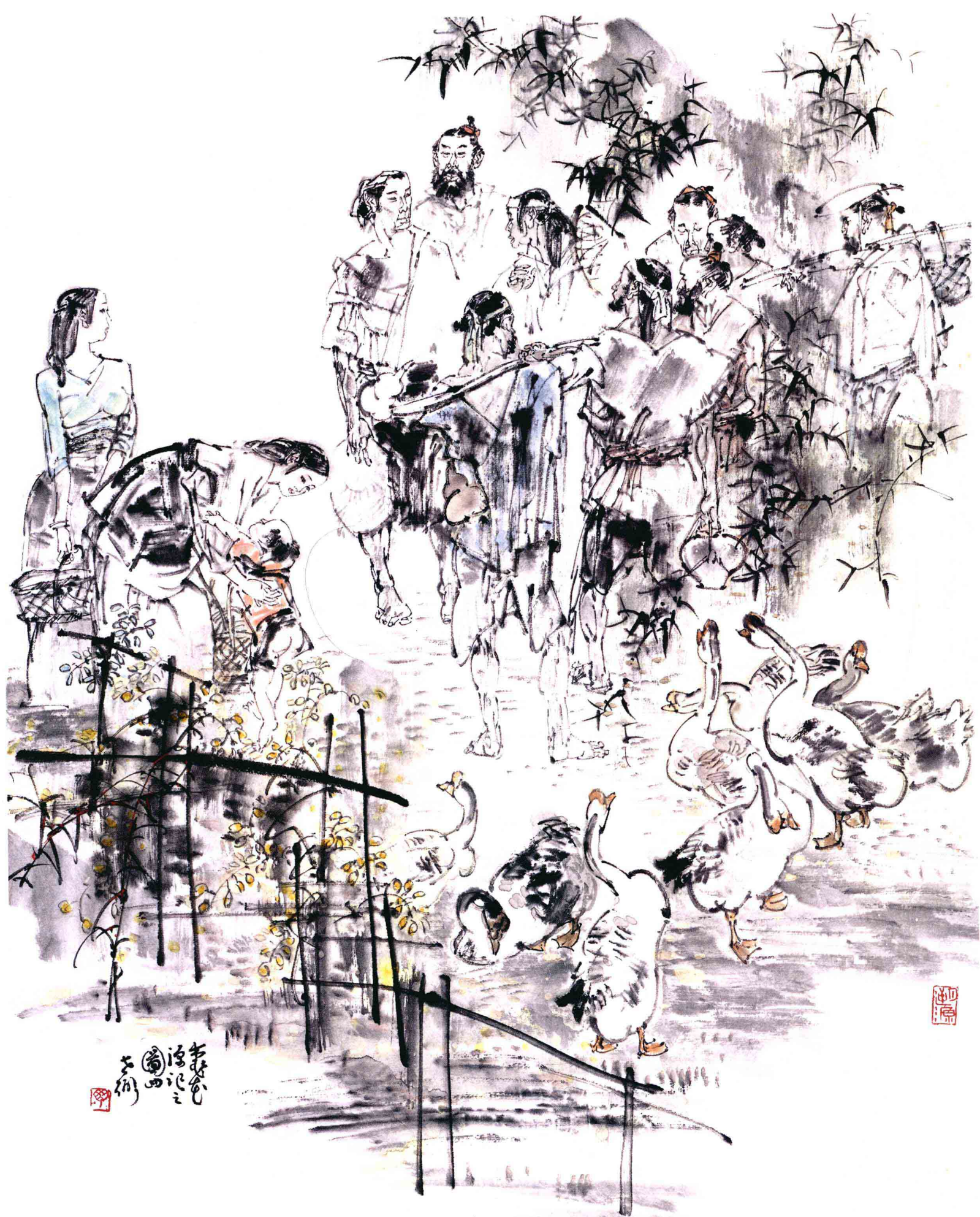
桃花源记 之四 52cm x 41cm