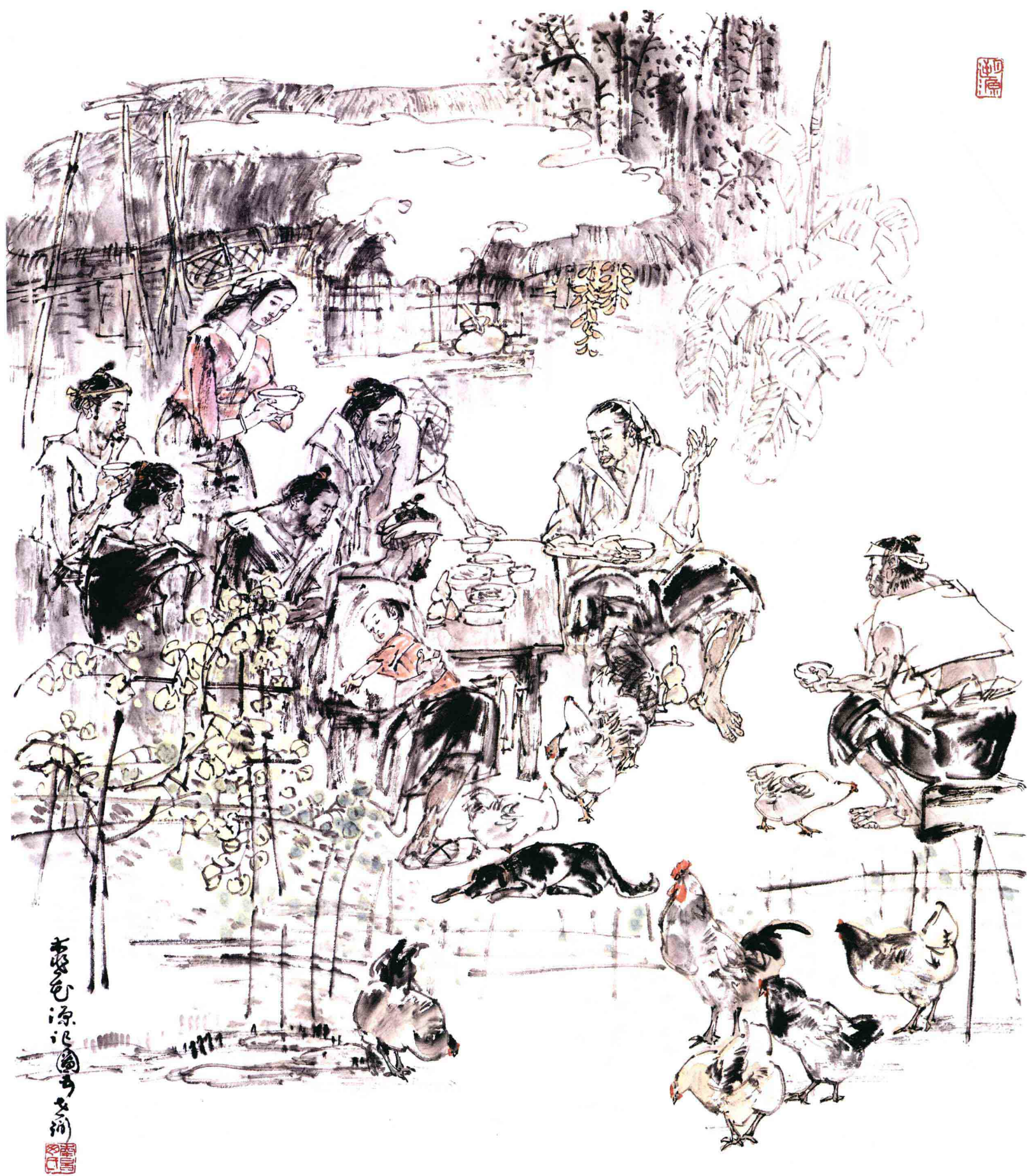
桃花源记 之五 41cm x 52cm