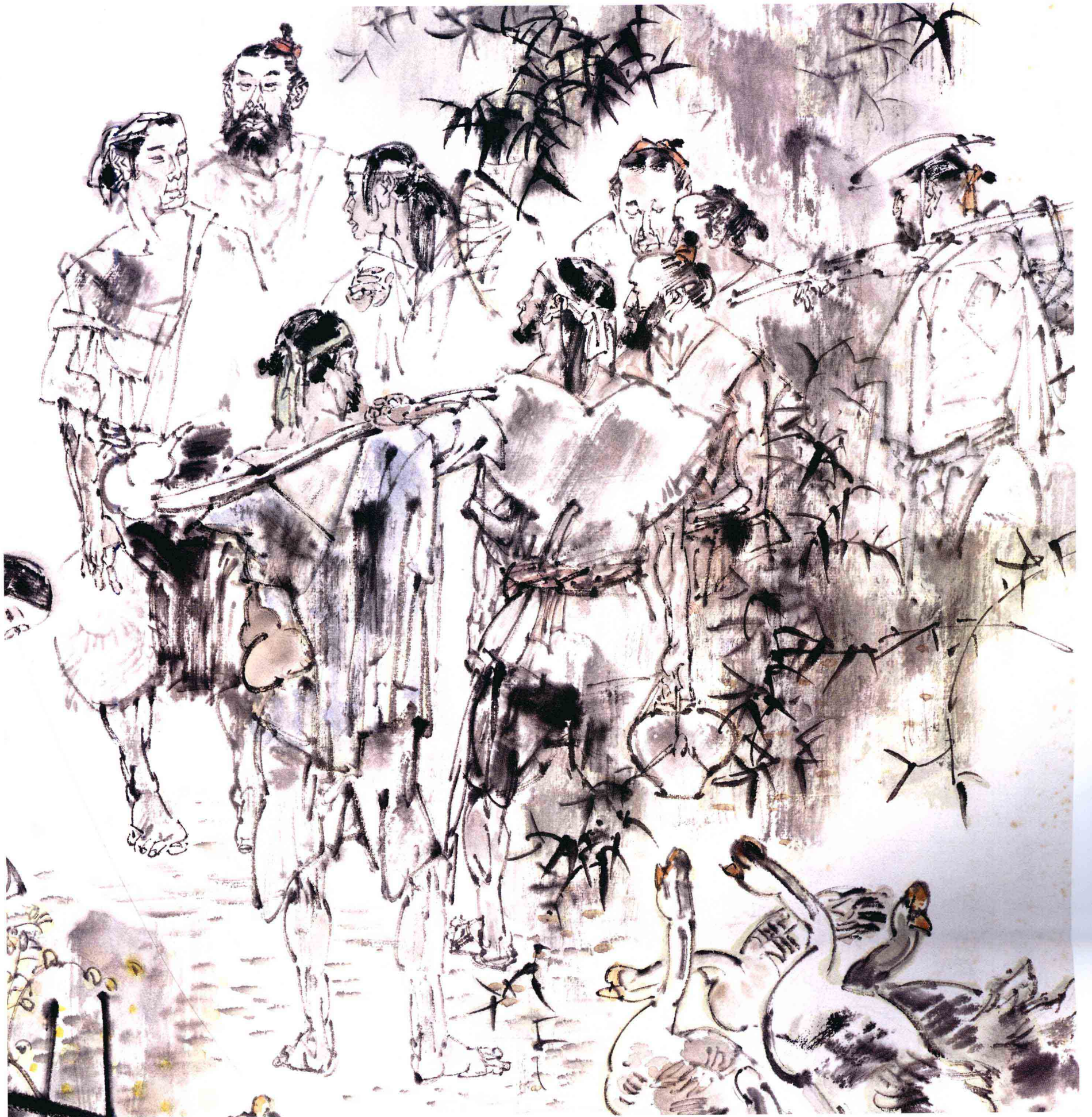
桃花源记 之四 (局部)