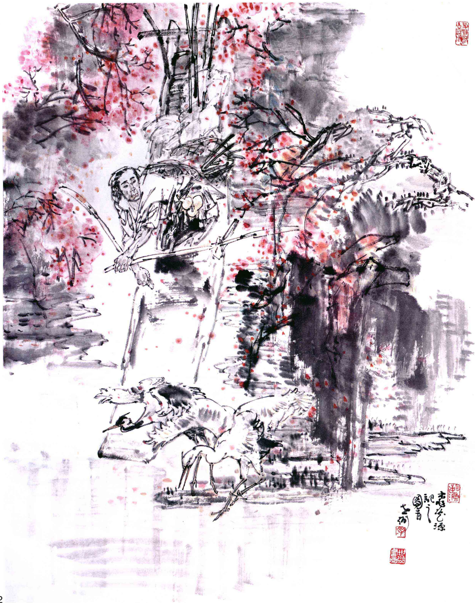
桃花源记之一 52cm x 41cm