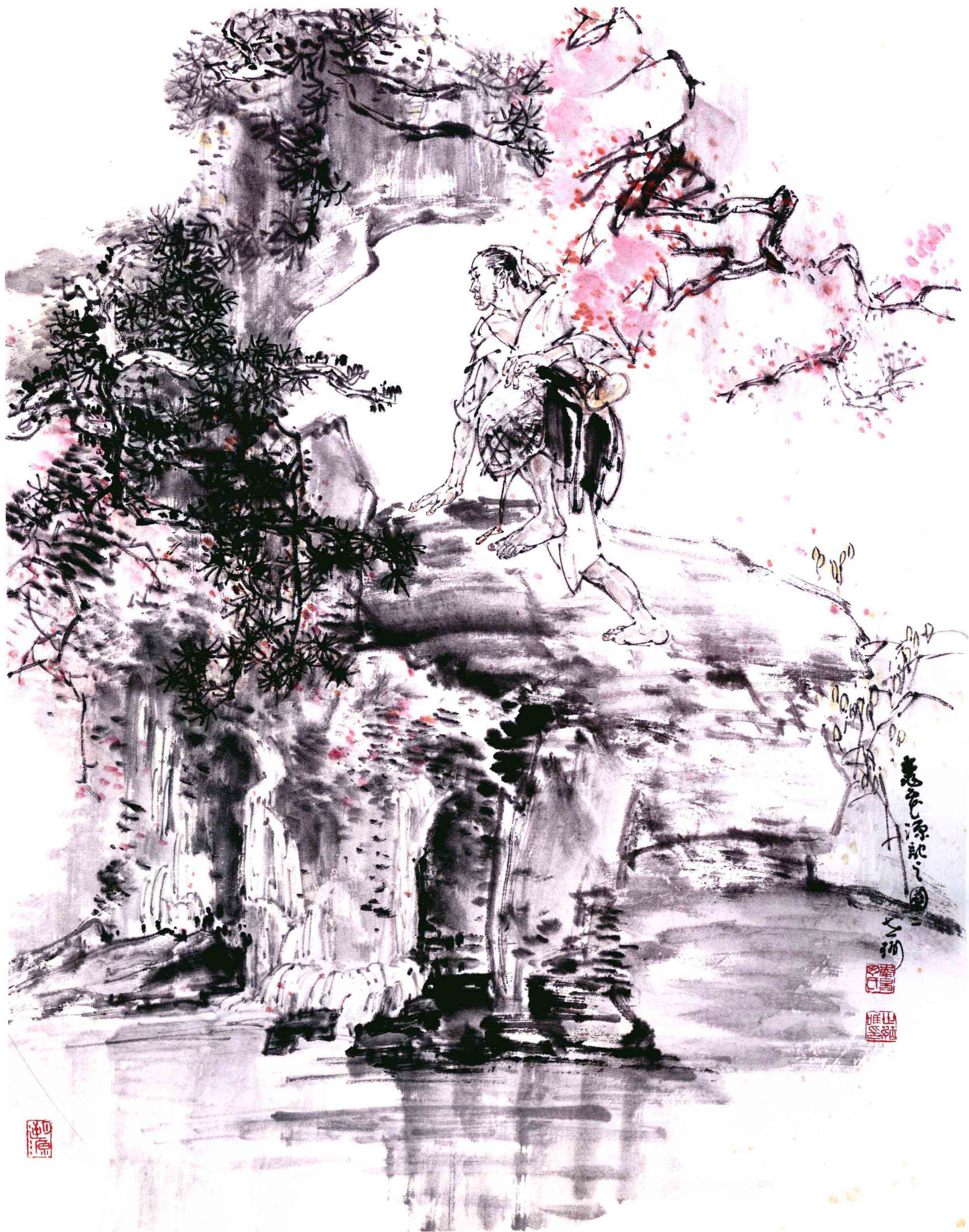
桃花源记 之二 52cm x 41cm