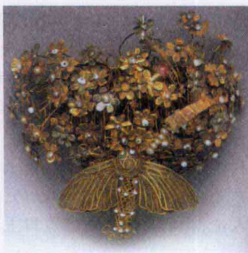
制作精美的隋代嵌珠宝钿金蝶头饰

隋朝建国不久就在全国严行户口搜索，用各种办法强化赋税征收，仅20余年，国库“富庶”就达到旷古少有的程度。集聚到中央政府的粮食多不胜数，仅京城长安、洛阳一线，就设有常平、广通、含嘉、兴洛（洛口）、回洛等八大