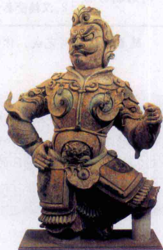
唐代彩绘涂金穿明光铠武士俑

思考与讨论： 比较秦汉与隋唐的官员选拔方式，列举它们的不同点，联系现实生活，你认为，推举与考试，哪一种方式更容易得到人才？更能体现公平竞争的精神？