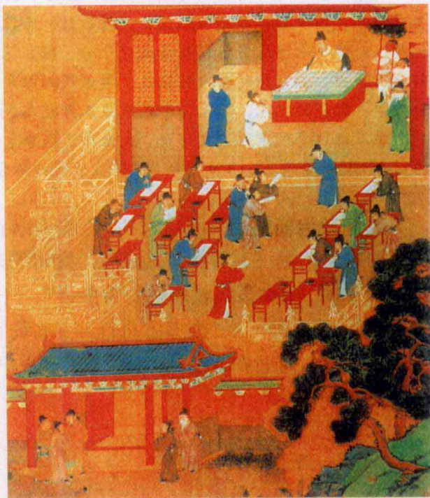
此为宋人所画《科举考试图》，根据画面可以想见唐宋时科举考试的情景。

唐代著名诗人孟郊，早年生活清贫，不欲做官，只爱写诗。40岁后，受母亲督促，才赴京应考进士，可是连续两次都没考取，遭来不少冷落和讥讽，于是潦倒失意，周游各地。后来，他终于考中进士，欣喜之情难以言状，当即写下《登科后》一诗，诗中“春风得意马蹄疾，一日看尽长安花”二句，将作者骑着快马在京城尽情游览时那种志得意满的情景，描述得淋漓尽致。