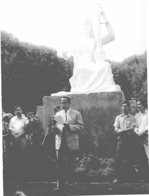
铁木尔·达瓦买提在新疆莎车县举行的维吾尔十二木卡姆大师阿曼尼莎汗陵墓塑像揭幕典礼上朗诵诗作。(1993年)