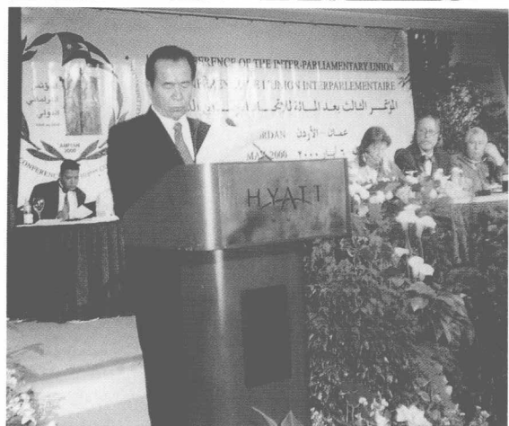
2000年5月1日,铁 木尔·达瓦买提(中)为 团长的中国人大代表团 出席在约旦首都阿曼举 行的第103届世界议联 大会。(铁木尔·达瓦买 提在大会上发言)。