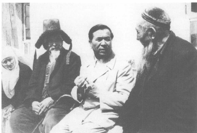
铁木尔·达瓦 买提与哈萨克族老 牧民亲切交谈。 (1988年)