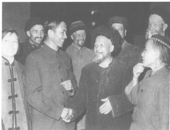
铁木尔·达瓦买提（前左二）于1964年3月在新疆维吾尔自治区第三届人民代表大会第一次会议上当选为自治区副主席。这是他当选后与各族人民代表亲切交谈的情景。