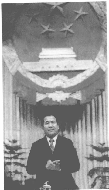
铁木尔·达瓦买提在新疆维吾尔自治区七届人大第一次会议上再次当选为自治区主席。(1988年)