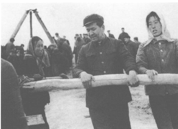
铁木尔·达瓦买提（左二）与农民群众打井。（1978年）