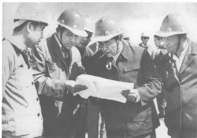
铁木尔·达瓦 买提深入克拉玛依 矿区钻井队视察， 右一为著名作家柯 尤慕·图尔迪。 (1985年)