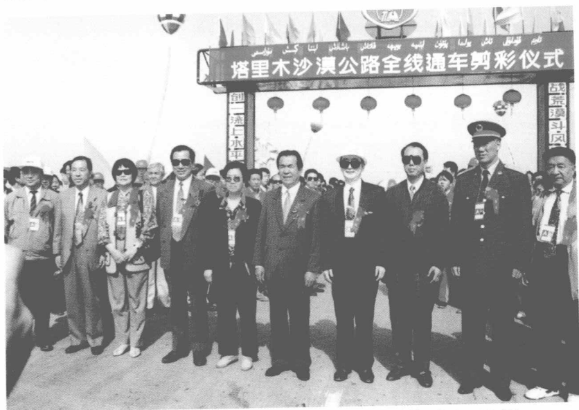
铁木尔·达瓦买提出席塔里木沙漠公路全县通车剪彩仪式。(1995年)