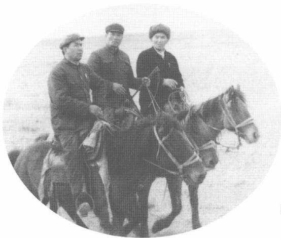
铁木尔·达瓦买提在牧区视察。(1978年)